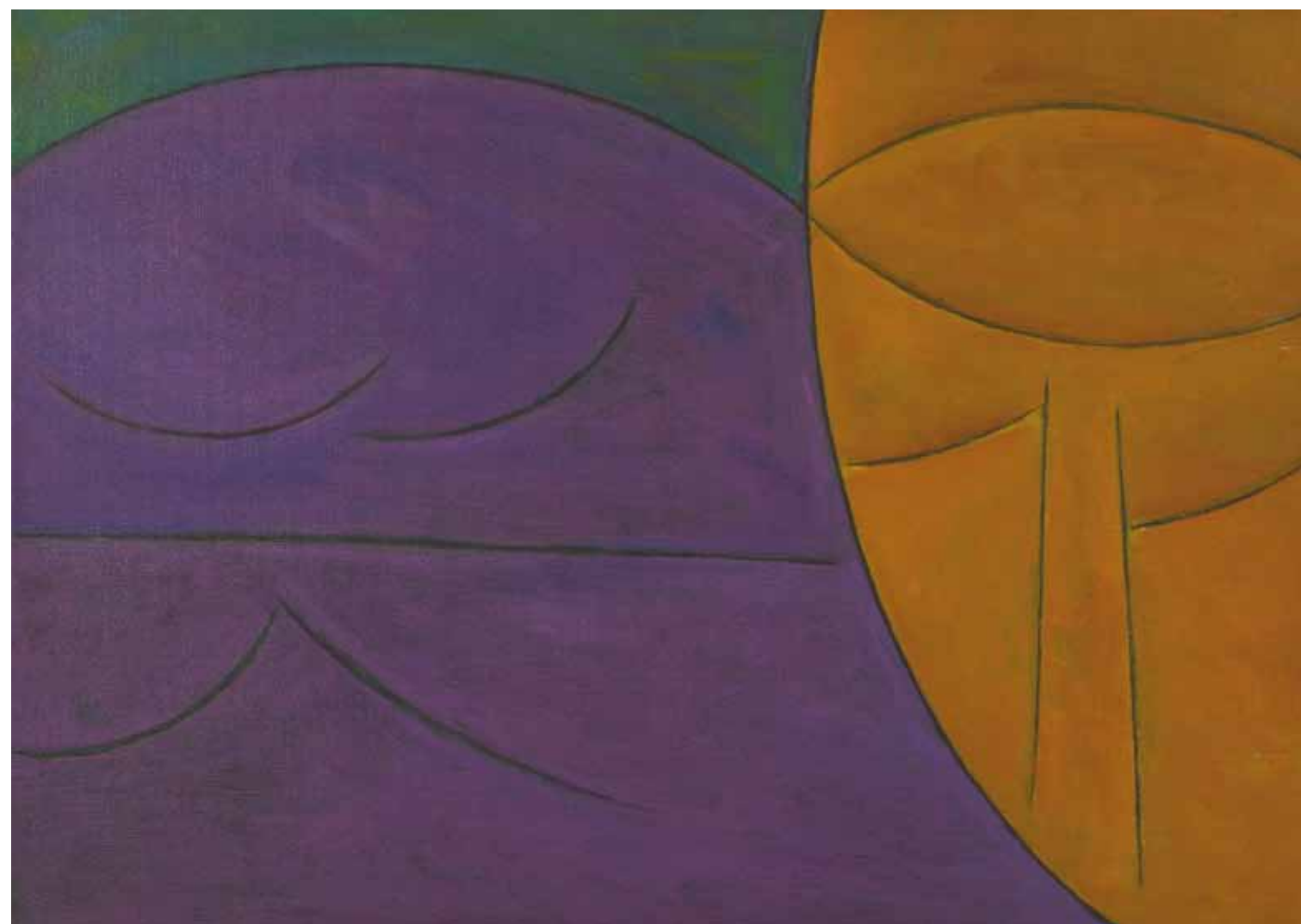
SIN TÍTULO 1984, ACRÍLICO SOBRE TELA, 50 X 70 CM.