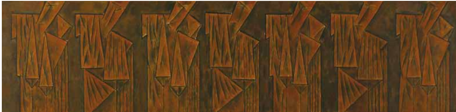
FRISO II 1985, ACRÍLICO SOBRE TELA, 45 X 180 CM.