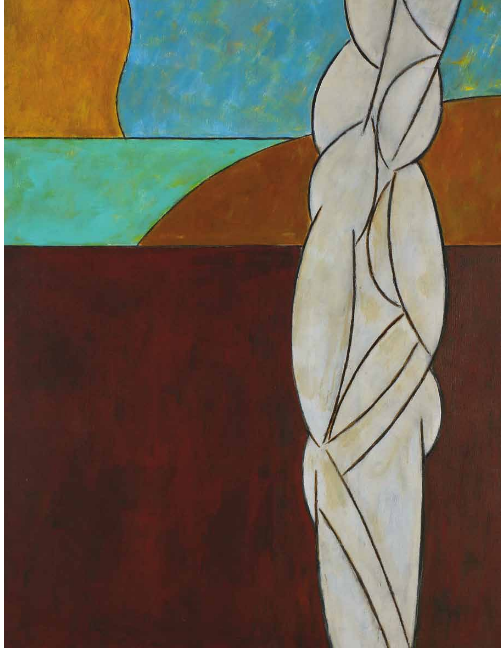
EFIGIE EN EL PAISAJE 1992, ACRÍLICO SOBRE TELA, 100 X 80 CM.