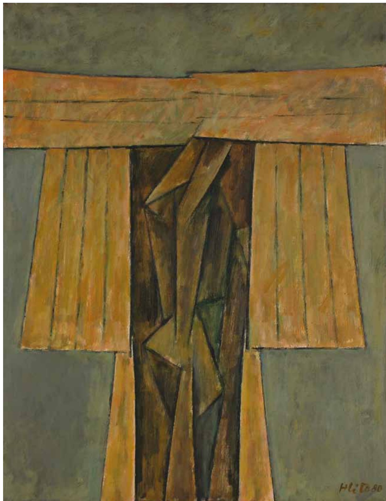
EFIGIE OCRE 1980, ACRÍLICO SOBRE TELA, 65 X 50 CM.