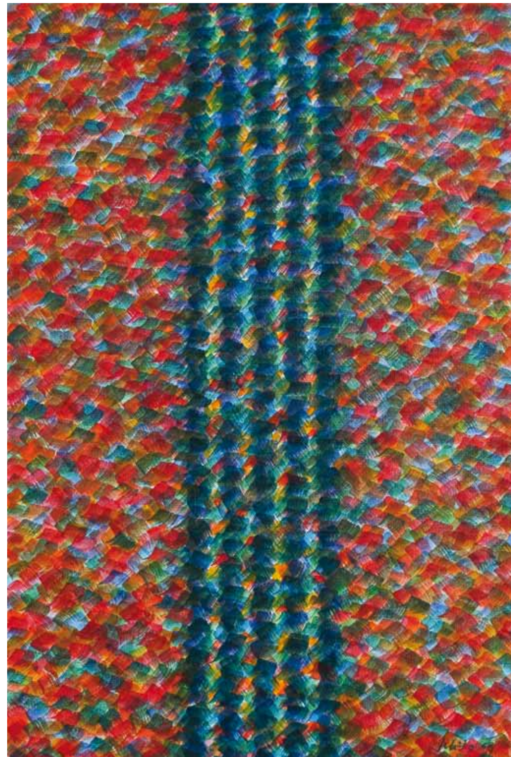
SIN TÍTULO, SERIE ESPECTROS 1959, ÓLEO SOBRE TELA, 60 X 40 CM.