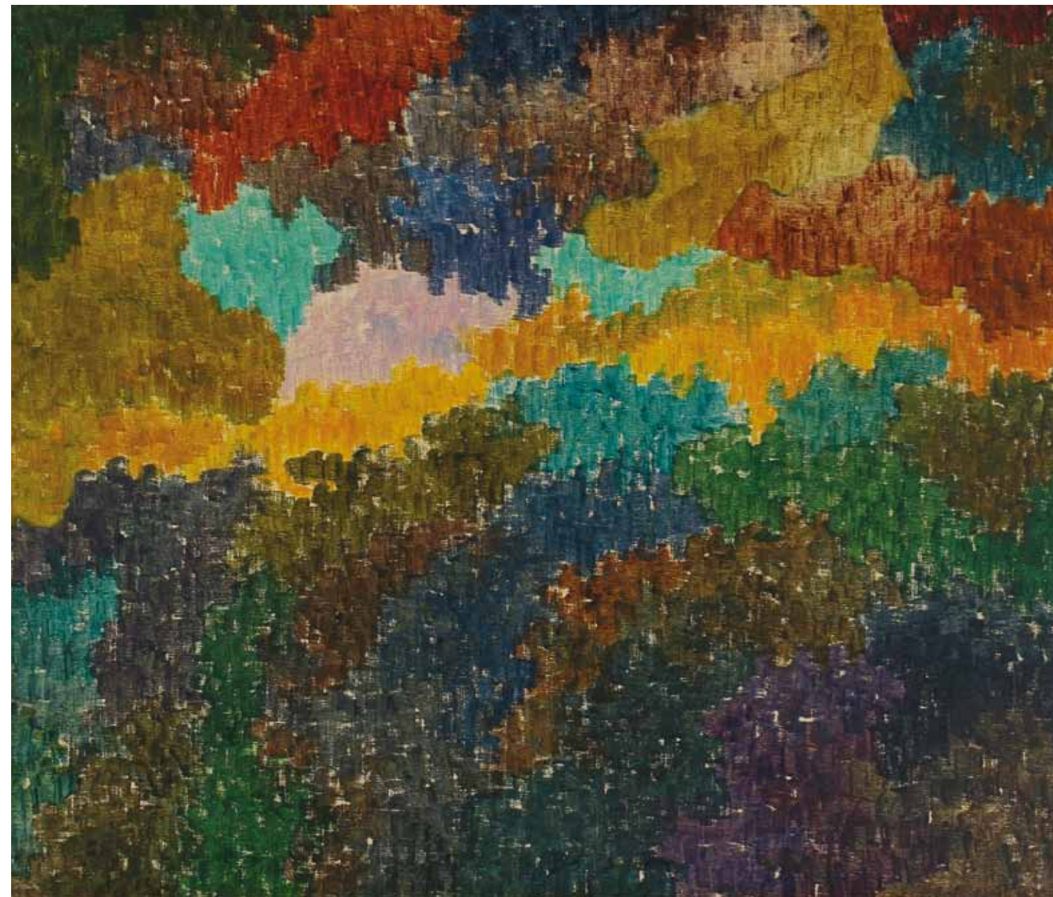
SIN TÍTULO SERIE PAISAJES 1961, ACRÍLICO SOBRE TELA, 59 X 68 CM.