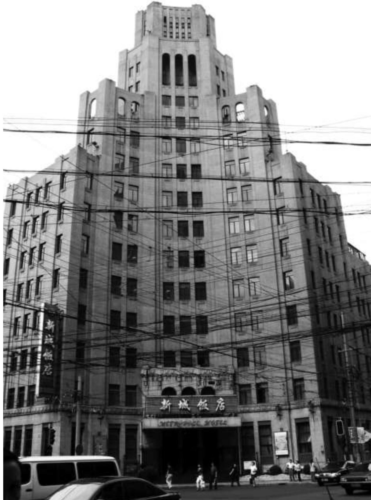
Metropol Hotel, Shanghai