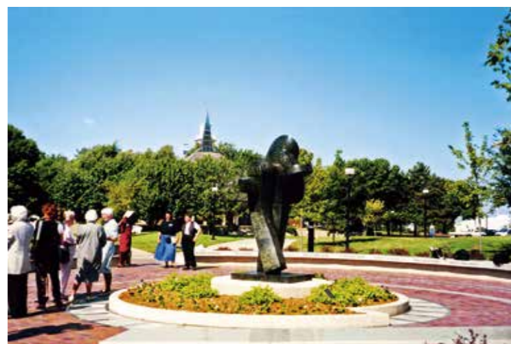
美国 维奇特塔州立大学, 英雄广场, 维 奇塔, 堪萨斯州