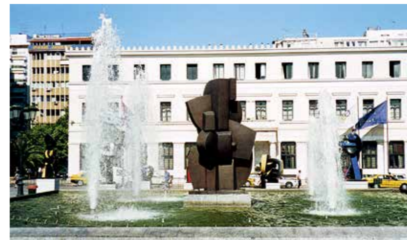
2000 雅典市政厅, “大型雕塑”, 考兹 亚广场, 雅典 - 希腊 City Hall of Athens, "Monumental Sculptures", Kotzia Square, Athens - Greece