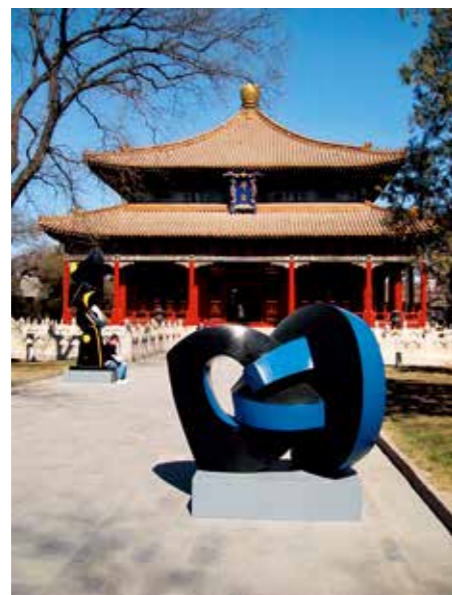
2008 孔庙, 北京 - 中国 Confucius Temple, Beijing - China