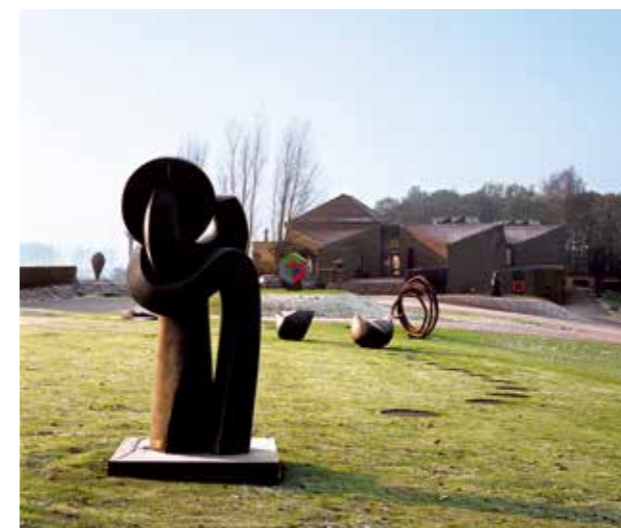
比利时 维拉能曼基金会, 克雷豪特姆