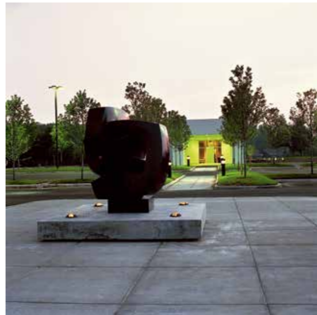
1997 布特勒美术学院, 回顾展, 扬斯敦, 亥俄州 - 美国 Butler Art Institute, retrospective show, Youngstown, Ohio - USA