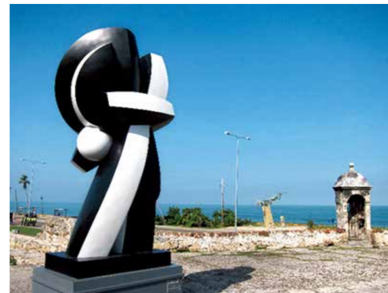
2011 “索菲亚·瓦丽 卡塔赫纳广场”, 大型雕塑, 卡塔赫纳 - 哥伦比亚 "Sophia Vari the Plazas of Cartagena", Monumental Sculptures, Cartagena de Indias - Colombia