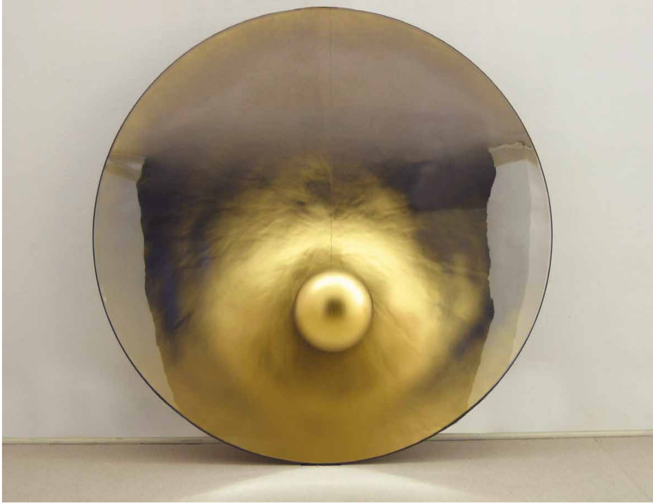
Vladimír Škoda, Galileo-Galilei , 2004