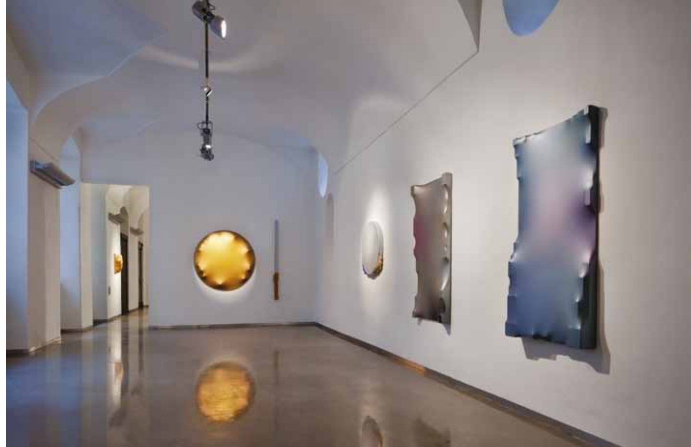
výstava Rehabilitace v podmínkách mimosoudního vyrovnání sporných děl, Kvalitář, Praha 2013

Porn Star Selection je na první pohled cyklus zdánlivě monochromatických maleb kruhového formátu. Proč jsi zvolil právě kruh?