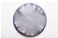
Petr Dub, Cheyenne Silver (2013) (z cyklu Porn Star Selection , 2013–2016) akryl, syntetické laky, dřevo, plátno, Ø120 cm majetek autora

Katalog vydala Galerie moderního umění v Roudnici nad Labem, příspěvková organizace Ústeckého kraje, v roce 2016 k výstavě pole rezonance / Václav Boštík - Petr Dub - Vladimír Škoda uskutečněné v rámci volného výstavního cyklu Pohledy do sbírek v době od 29. 9. 2016 do 27. 11. 2016 v budově zámecké jízdárny – sídle Galerie moderního umění v Roudnici nad Labem.