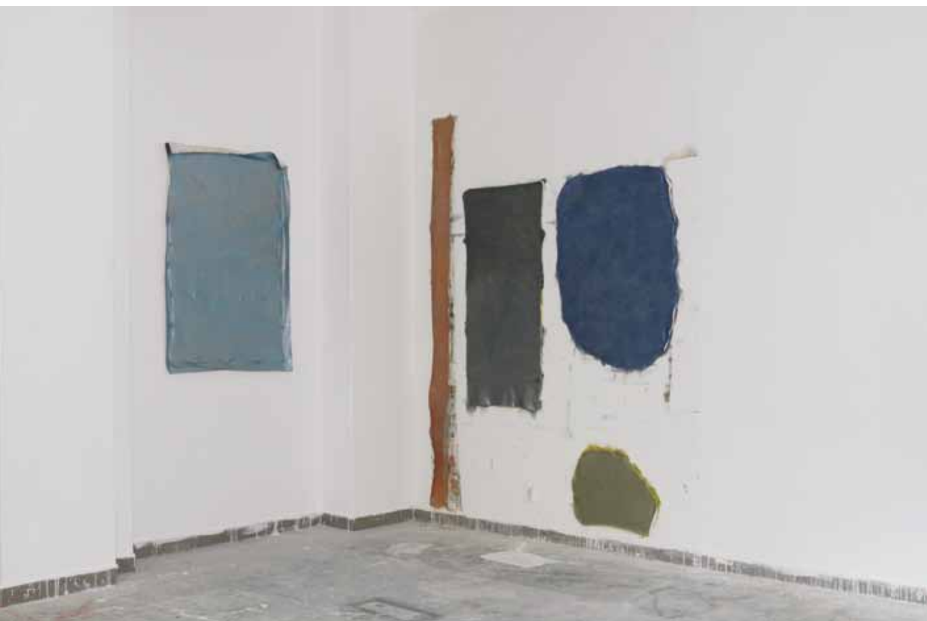
Petr Dub, Bez názvu , z cyklu Unframed , 2009

a tento diptych z roku 2008 představuje citaci hesel z porno stránek, které jsou autentické, ale neobsahují explicitní sexuální výrazy. Na obou obrazech mne vždy fascinovalo, kolik emocionálního sdělení může vyjádřit čistý konceptuální text na černém podkladu. Počátkem nultých let jsem se poprvé začal zajímat o práci On Kawary, a když jsem později o jeho díle mluvil s Janem, vyrazilo mi dech zjištění, že jeho věci neznal a právě tyto „paralelní umělecké existence“ v kombinaci s jeho Indexy se staly inspirací pro cyklus obrazů pojmenovaných po uměleckých pseudonymech pornohereček. Každý z obrazů si přivlastňuje název určité barvy podobně jako ony. Samotná díla ovšem nikdy nevznikají s předobrazem konkrétní osoby a některé z hereček jsem zcela upřímně ani nikdy neviděl. Pracuji totiž s podobnými textovými daty jako Šerých. Důležitým pro mne zůstává postprodukční triángl a snaha o hledání nové interpretace za názvy barev. Žádná z hereček pochopitelně není modrá, zelená, stříbrná nebo dokonce zlatá, ale i přesto lze za jejich pseudonymy chápat cosi mnohem hlubšího ze vztahu estetiky a podprahového vnímání. Dodávání smyslovosti něčemu, co je založené na čistém spektaklu, je podle mne přesným odrazem naší doby.