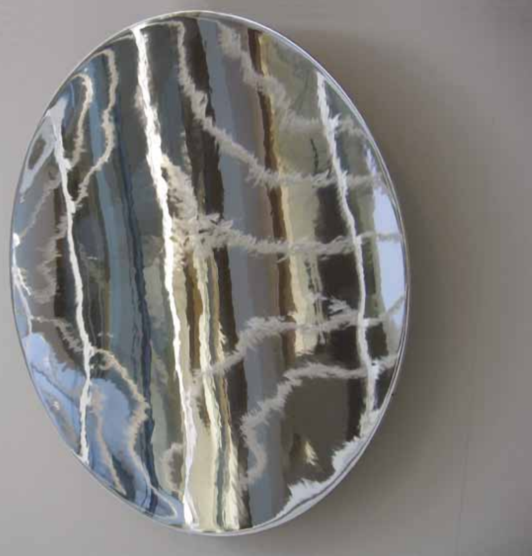
Vladimír Škoda, Miroir du temps (vibrant) / Zrcadlo času (vibrující) (1999–2005)

vytvářet strojově a jejich povrch upravoval provrtáváním, frézováním a leštěním. Často je rozmísťoval do konstelací ilustrujících děje probíhající ve vesmíru. Jeho zájem doposud soustředěný na energii ukrytou uvnitř hmoty se přesunul na povrch. Postupným leštěním začaly povrchy koulí odrážet okolní svět, jenž se tak stával součástí vlastního díla. Tímto způsobem autor dospěl až k dokonalé odrazné ploše - zrcadlu. Tehdy poprvé zahlédl ve vyleštěné sféře fascinující zakřivený prostor, který nepodléhá pravidlům geometrie, s níž se obvykle setkáváme. Lesklý povrch koule, posléze její vnitřní stěny v podobě konkávního zrcadla, odrážející a deformující okolní prostředí, jej přiměl k úvahám nad subjektivitou lidského vnímání. Záhy se k zrcadlicí ploše přidružil pohyb. Chvějící se zrcadlo rozostřilo jasné kontury okolního světa. Jako by se stalo vyjádřením autorovy snahy postihnout proces proměny energie, resp. hmoty, jenž je základem všeho dění ve vesmíru, výrazem snahy o „zachycení jeho dynamické představy“. Dalo by se však také přirovnat k výseku silového pole. Na posledních výstavách Vladimíra Škody v Čechách se však objevily zrcadlové objekty, které ve svém odrazu realitu nezkrslují, ale vytvářejí obraz zcela nový. V hladkých zrcadlicích plochách opřených o zeď jako by se přelévala roztavená hmota. Svým tvarem evokují trhlinu v prostoru skýtající pohled do jiné dimenze.