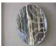
Vladimír Škoda, Miroir du temps (vibrant) / Zrcadlo času (vibrující) , (1999–2005) nerezová zrcadlově leštěná ocel, elektrický motor, Ø 96 x 15 cm, soukromá sbírka, Francie