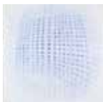
Václav Boštík, Zakřivený prostor (1970) olej, plátno, 123 x 123 cm Galerie moderního umění v Roudnici nad Labem, O 505