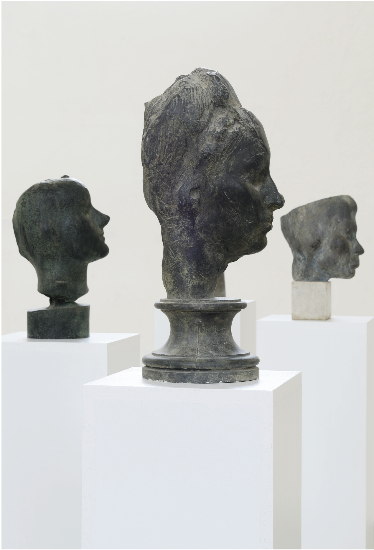
Jan Hendrych Portrét J. S. (1990), Portrét mladé ženy (konec 60. let), Portrét S. Š. (kolem 1980)