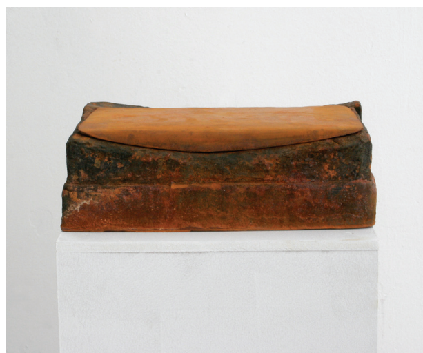
Rastislav Jacko Bez názvu (2005)

Skicák (2010–2016), papír, tužka, šelak, barva, 21 x 29,7 cm