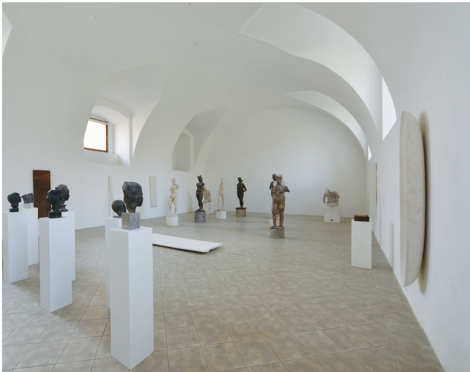
Pohled do instalace výstavy Vlevo: Jan Hendrych Venuše (kolem 1969), Ráno (1989), Studie k dívce (začátek 80. let)