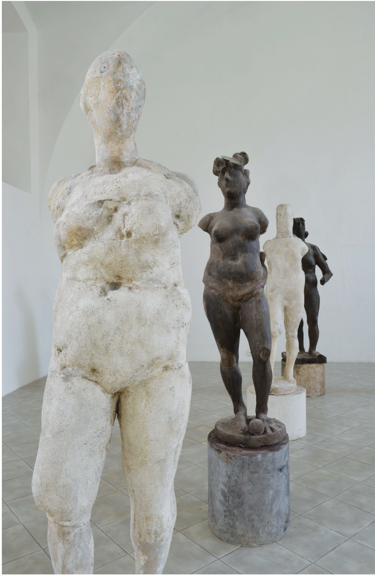
Jan Hendrych Stará dáma (1989), Barokní (1967), Ráno (1989), Venuše (kolem 1969)