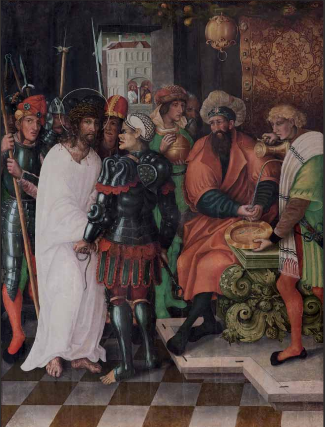
VIII Kristus před Pilátem Christus vor Pilatus