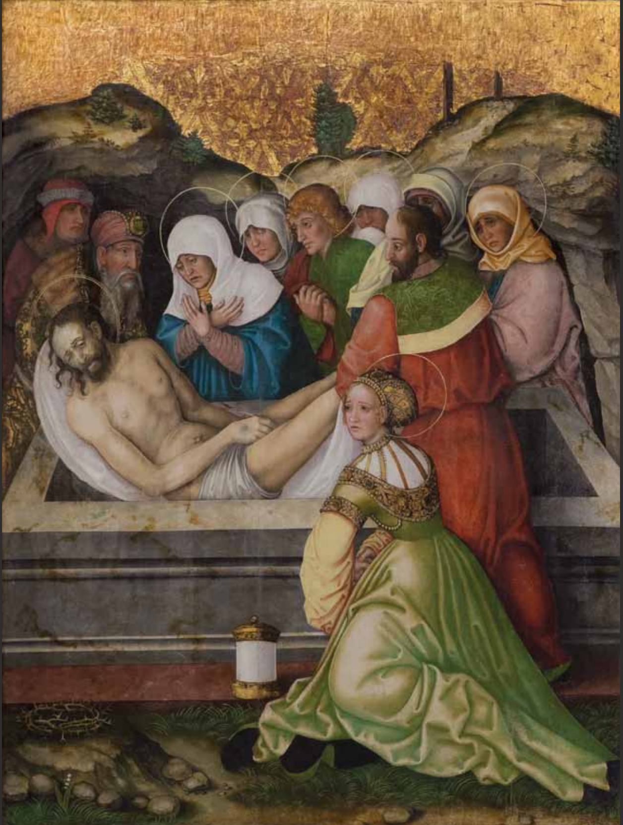
XI Kladení do hrobu Grablegung