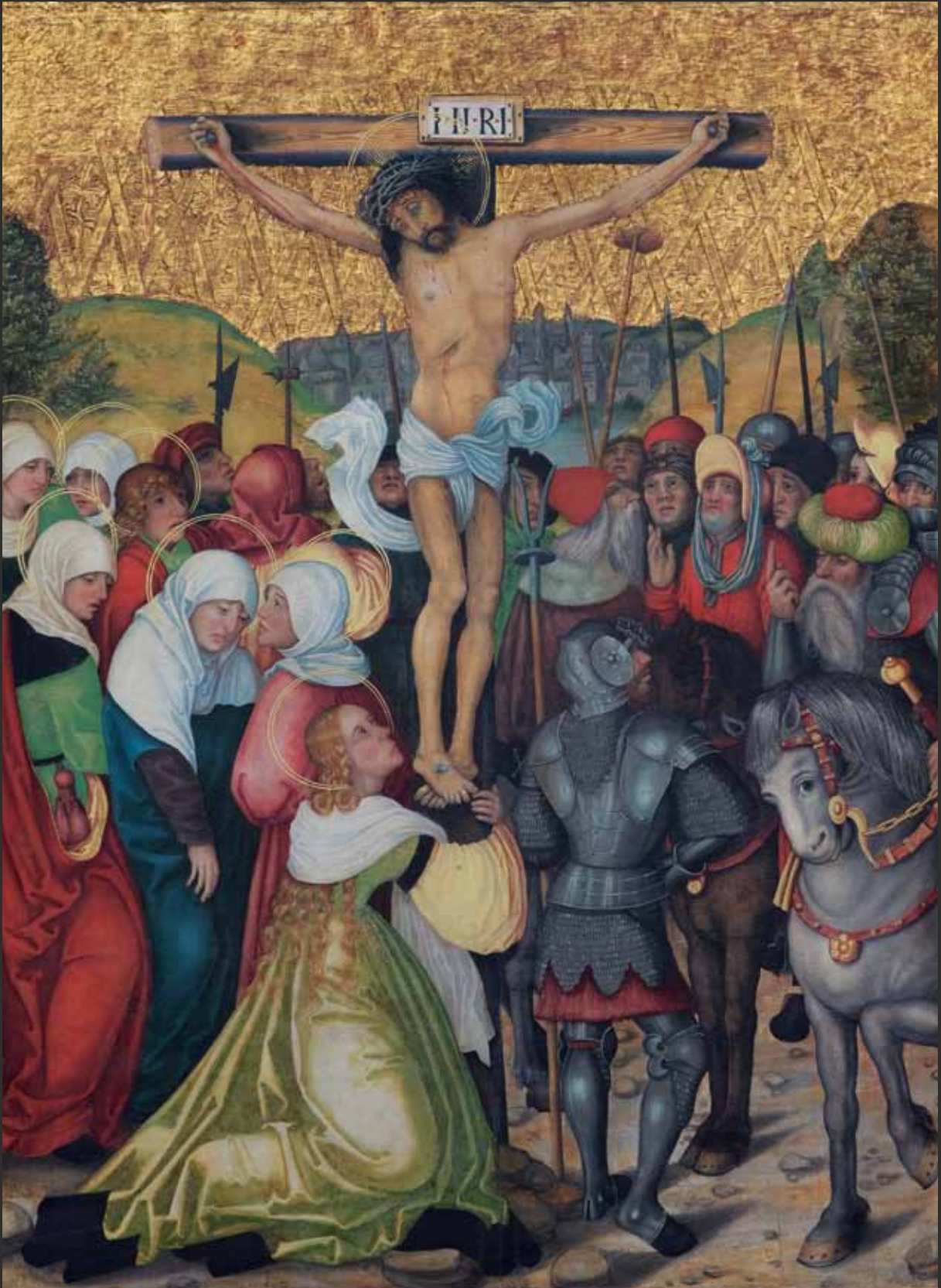
X Ukřižování Kreuzigung