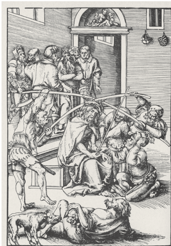
Lucas Cranach st. / d. Ä. Korunování trním Die Dornenkrönung Christi 25 x 17,2 cm