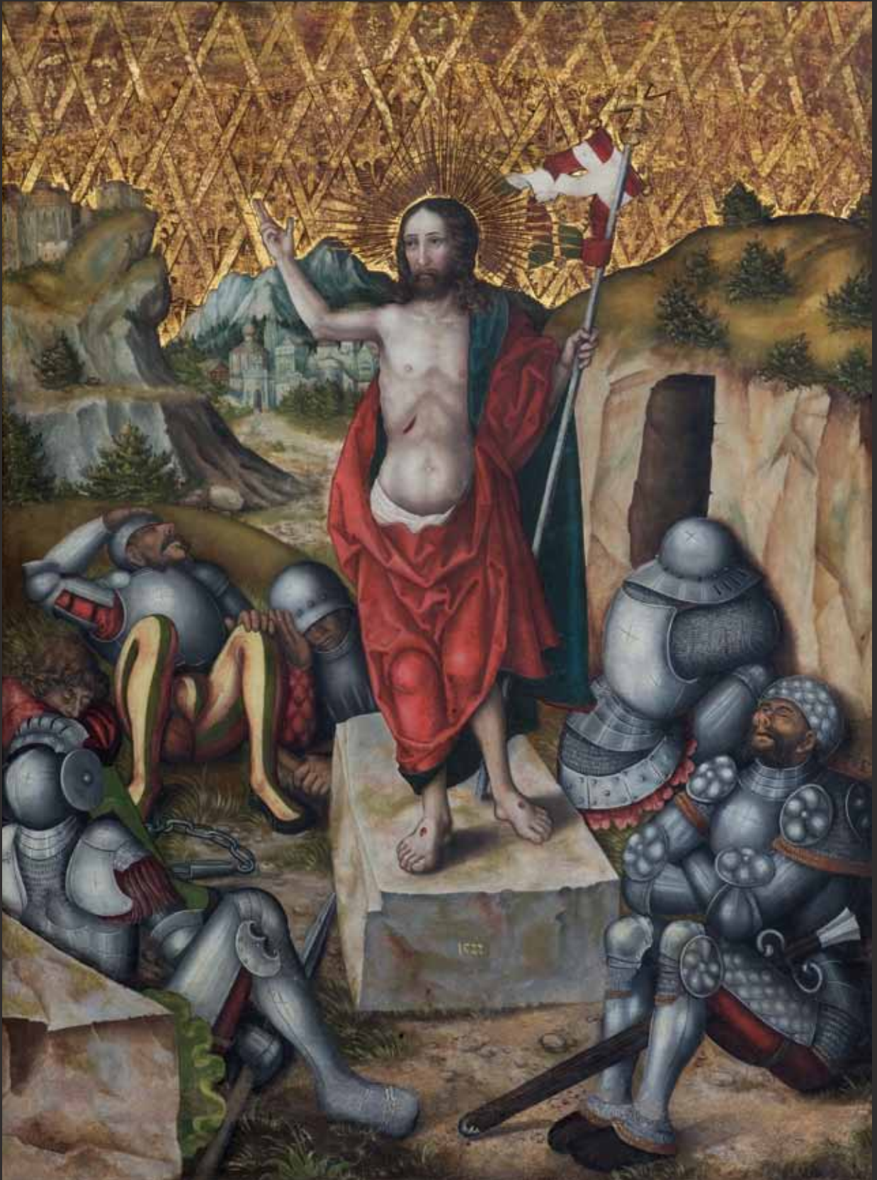
XII Zmrtvýchvstání Auferstehung