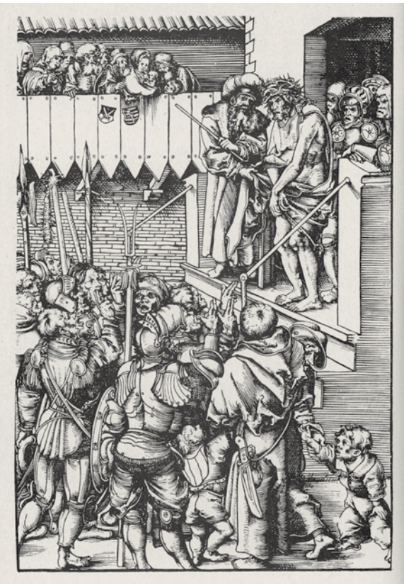
Lucas Cranach st. / d. Ä. Ecce homo 25 x 17,2 cm

von Cöln). Predelu zdobí reliéf s námětem Příbuzenstva Kristova. Pašijové scény jsou komponovány podle grafických listů z cyklů Pašijí Lucase Cranacha st. z roku 1509 ( Passio D. N. Jesu Christi vetustissimis imaginibus eleganter expressa, ab illustrissimis Saxoniae Ducis Pictore Luca Cranagio Anno 1509 ). 23 Také velké postavy světců na křídlech oltáře jsou inspirovány grafickými předlohami. Pro postavu sv. Jiří sloužil jako předloha grafický list A. Dürera (B 53), postava sv. Pavla byla komponována podle rytiny z Dürerových Malých pašijí, jako předloha pro postavu sv. Petra pak posloužil grafický list z Cranachova cyklu Krista a dvanácti apoštolů z roku 1512. 24