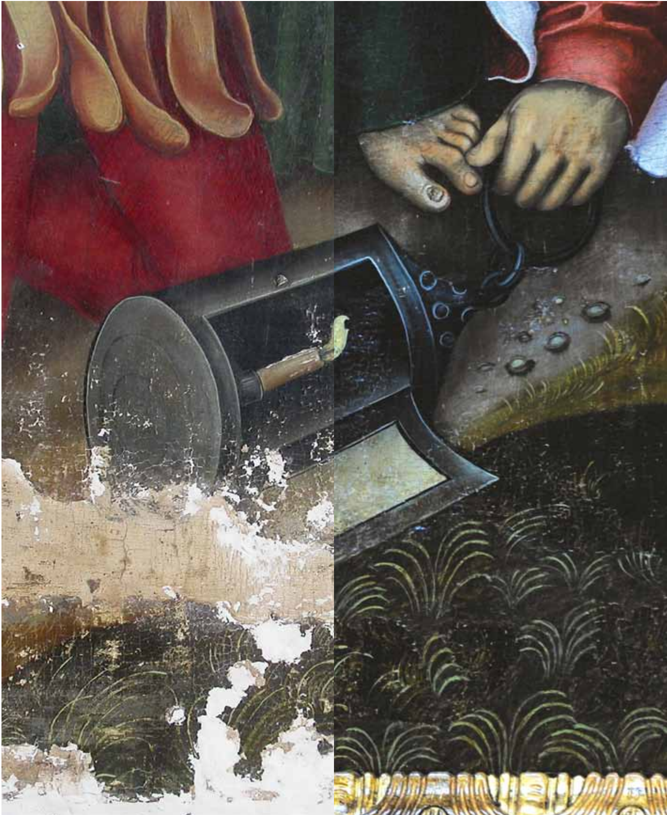
Detail obrazu Jidášův polibek – levá část restaurování (tmelení), pravá část po restaurování Gefangennahme Christi, Detail – der linke Teil wird restauriert (Spachteln), rechter Teil nach der Restaurierung