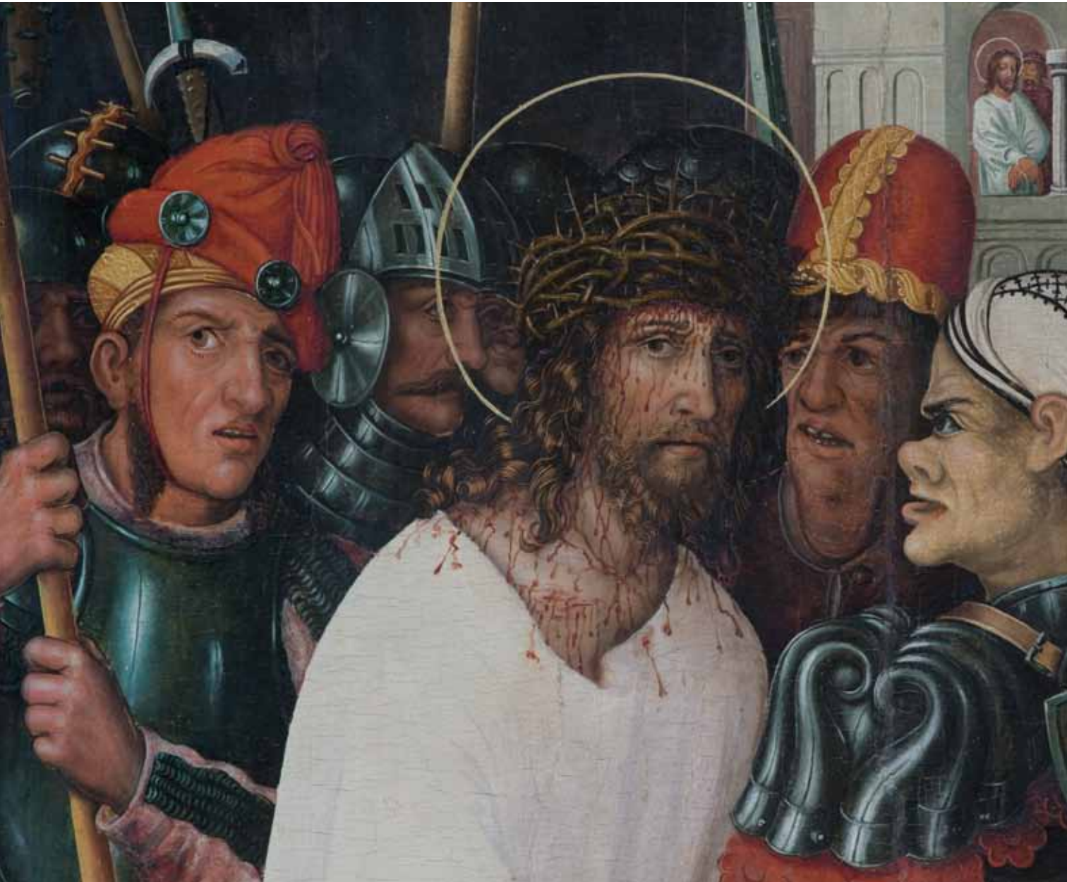
Detail obrazu Kristus před Pilátem Christus vor Pilatus, Detail