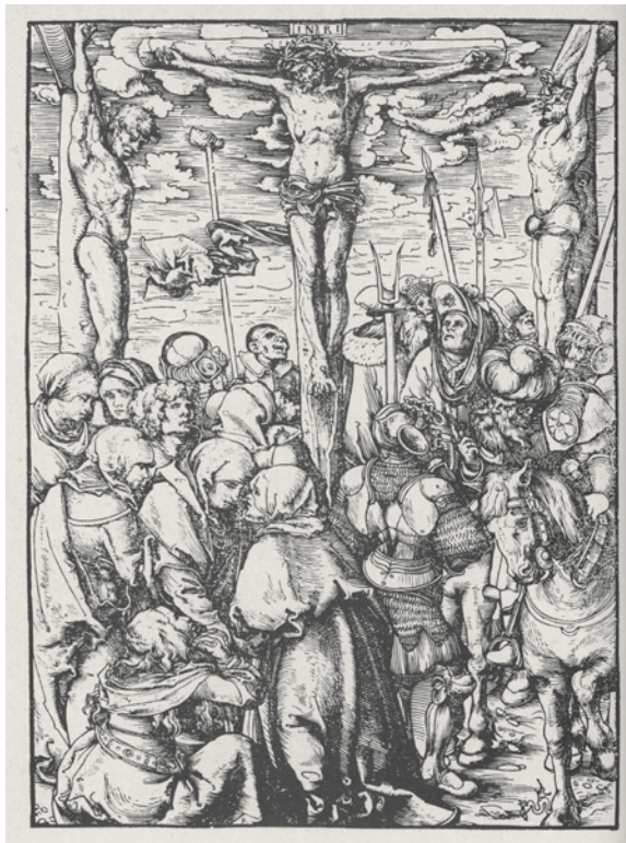
Lucas Cranach st. / d. Ä. Ukřižování Krista Christus am Kreuz 25 x 17,2 cm