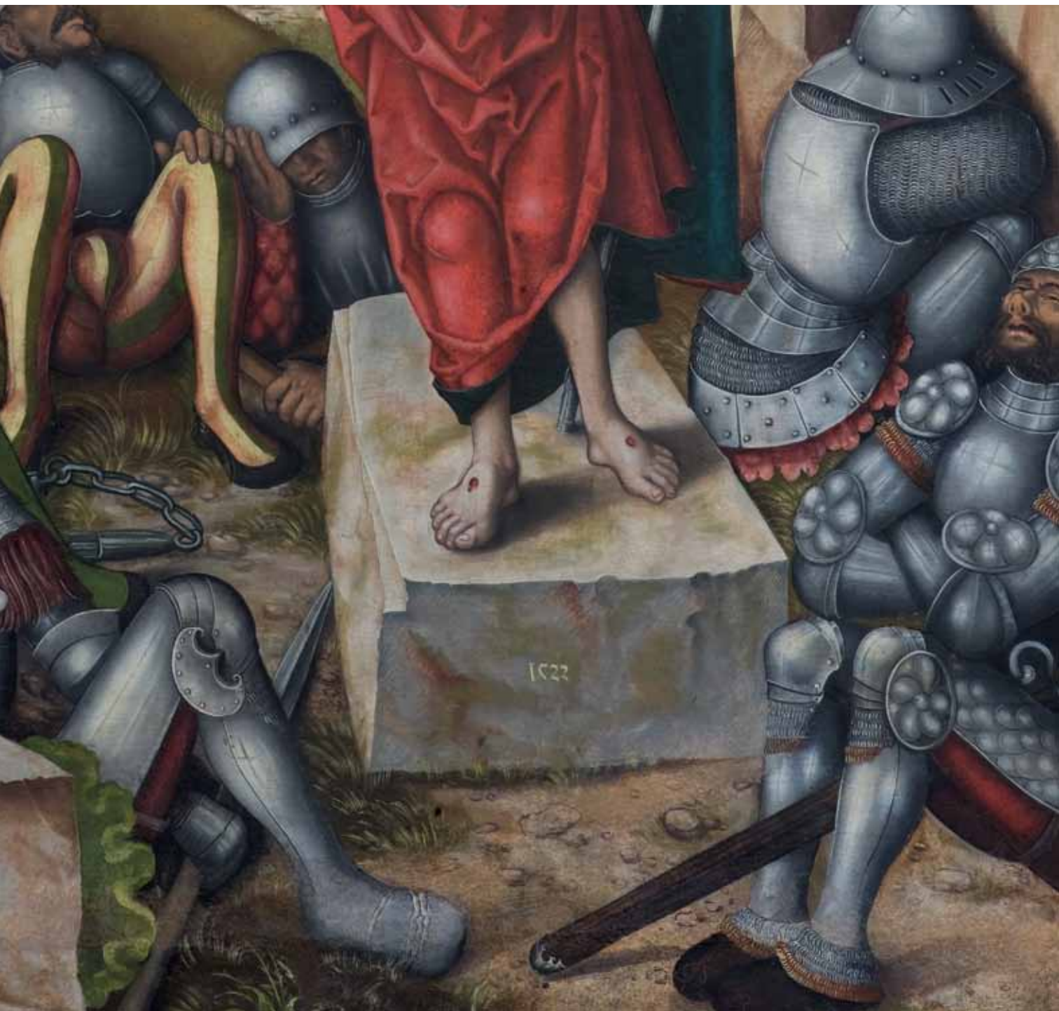
Detail obrazu Zmrtvýchvstání Auferstehung, Detail