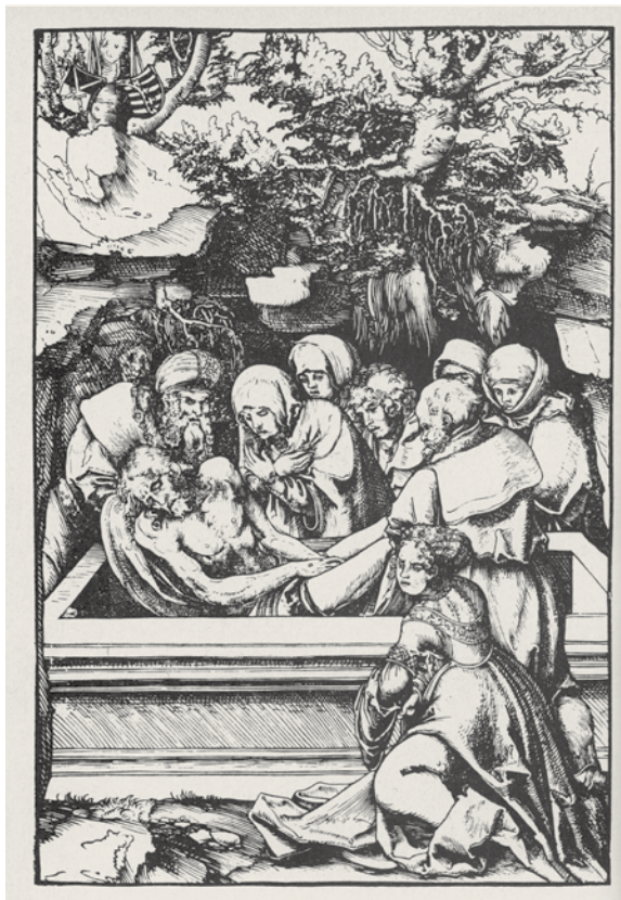
Lucas Cranach st. / d. Ä. Kladení do hrobu Die Grablegung Christi 25 x 17,2 cm