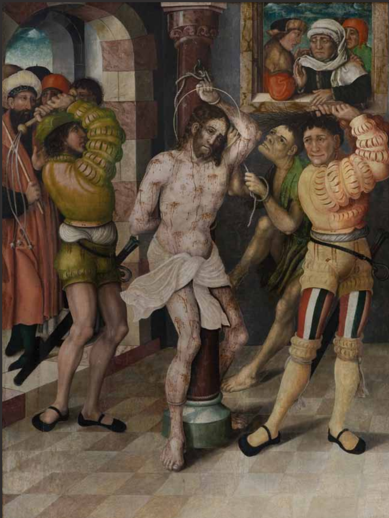
V Bičování Geißelung