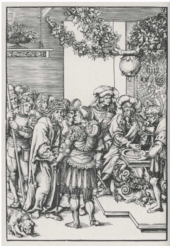
Lucas Cranach st. / d. Ä. Pilát si myje ruce Pilatus wäscht sich die Hände 25 x 17,2 cm