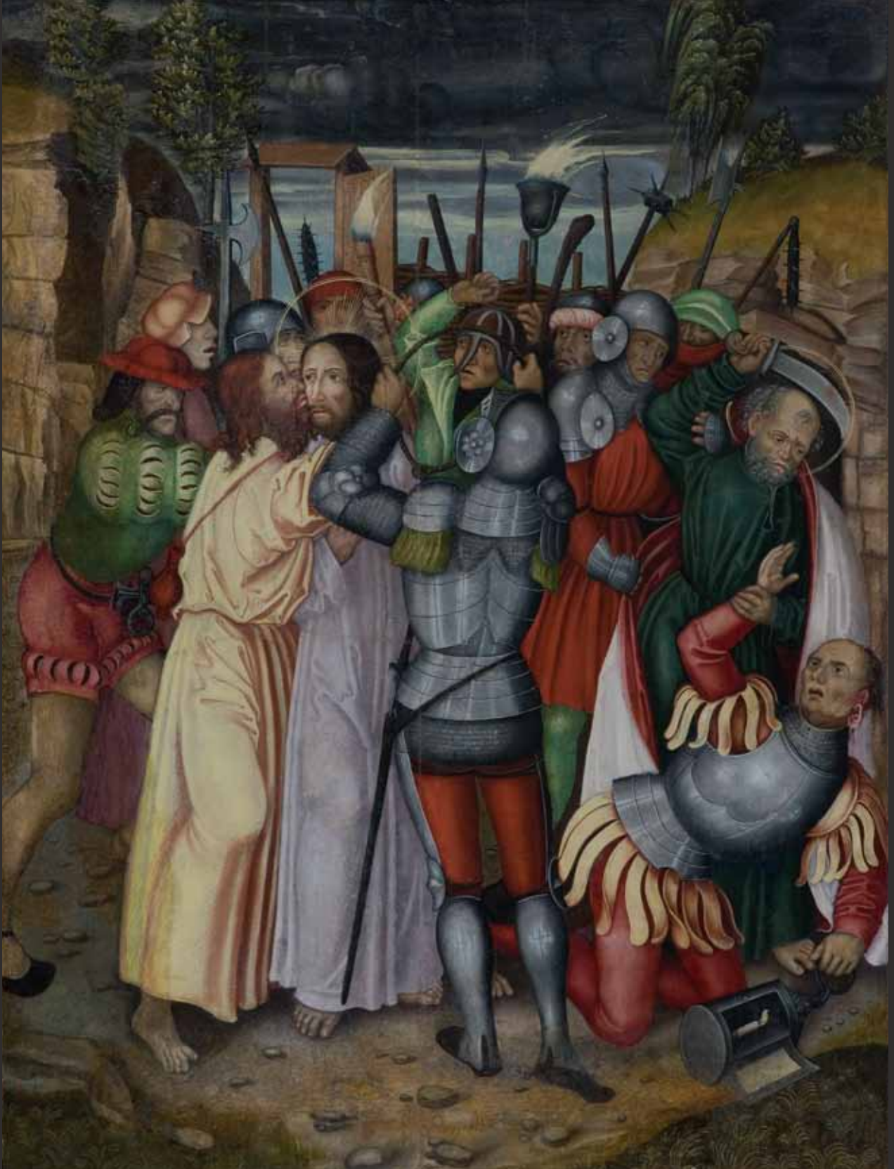
III Jidášův polibek Gefangennahme