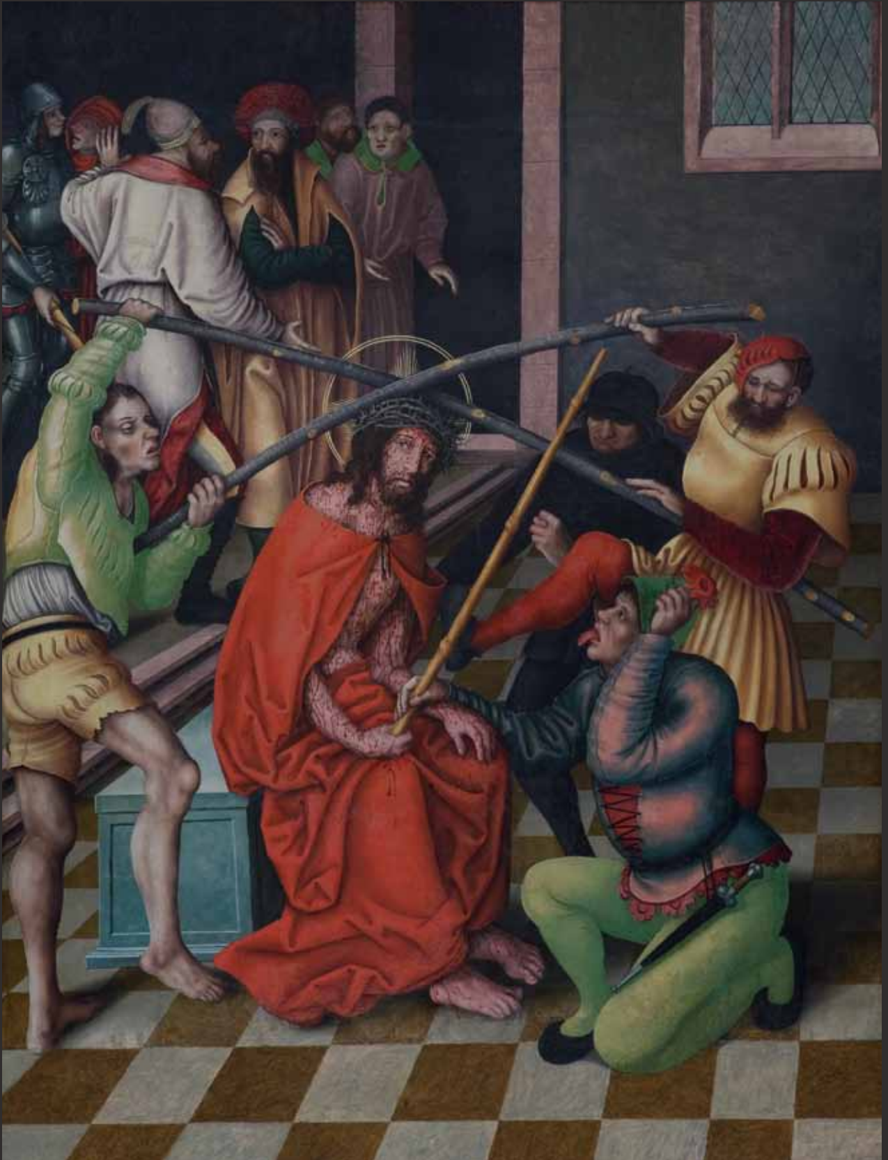
VI Korunování trním Dornenkrönung