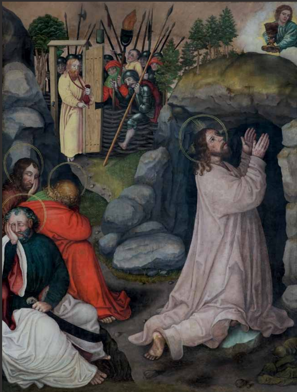
II Olivetská hora Christus am Ölberg