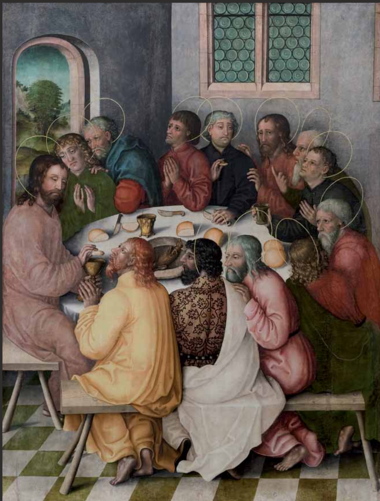
I Poslední večeře Letztes Abendmahl