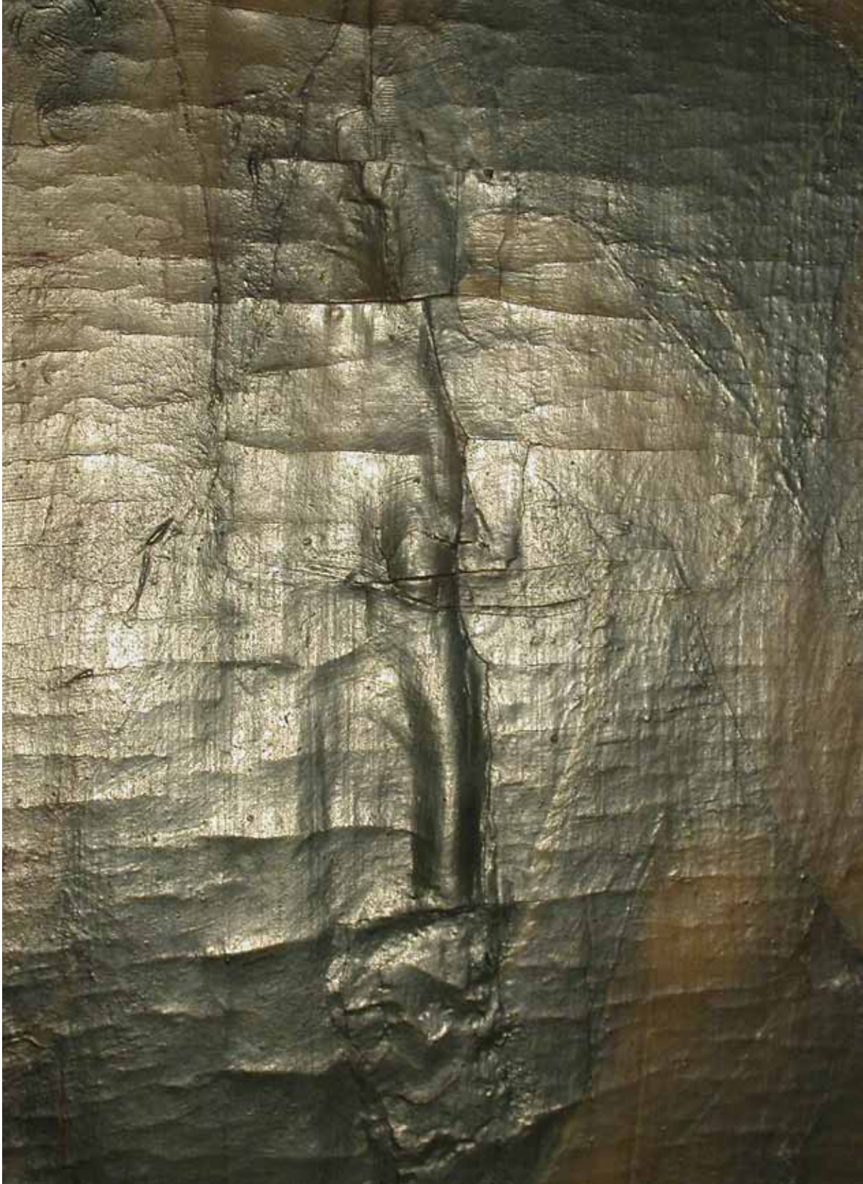
Detail obrazu Bičování, stav před restaurováním – uvolněné barevné vrstvy od podkladu Geißelung Christi, Detail – Zustand vor der Restaurierung – von der Grundierung gelöste Farbschichten