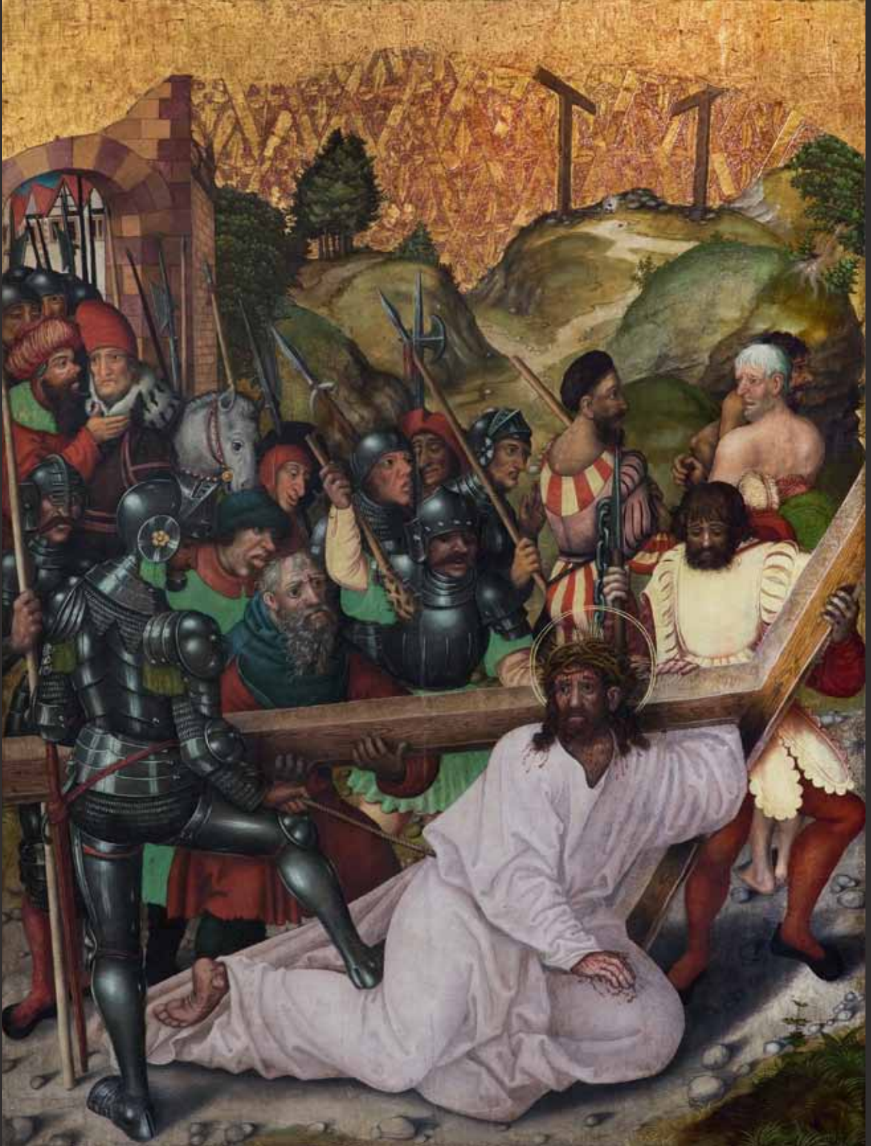
IX Kristus padá pod křížem Kreuztragung