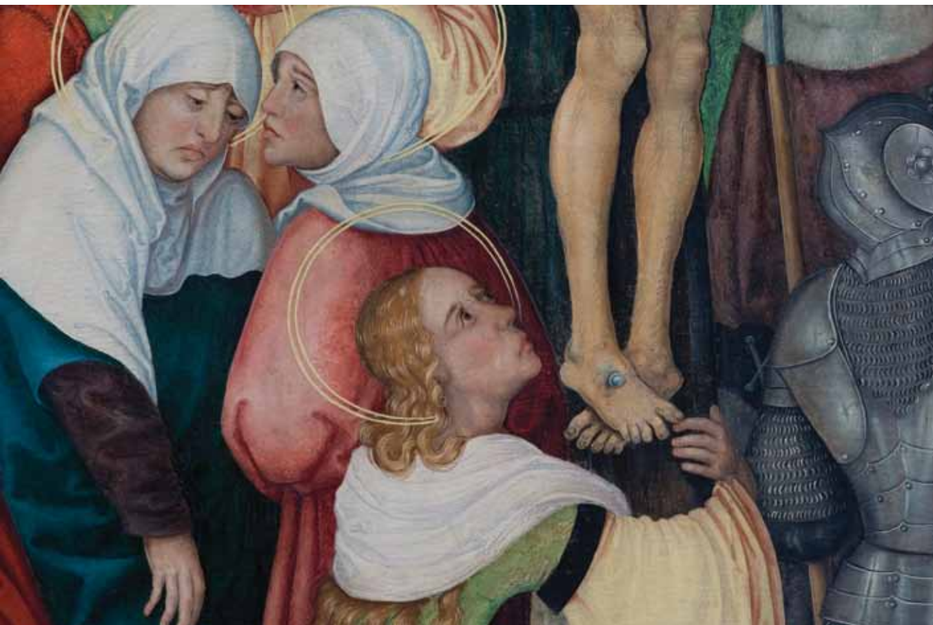
Detail obrazu Ukřižování Kreuzigung, Detail