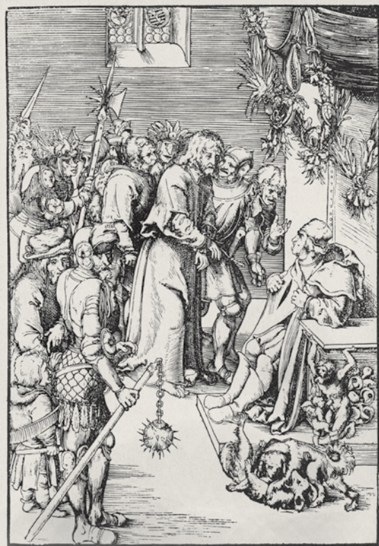
Lucas Cranach st. / d. Ä. Kristus před Annášem Christus vor Hannas 25 x 17,2 cm