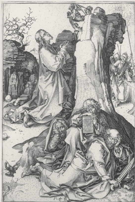
Martin Schongauer Kristus na Olivetské hoře Das Gebet Christi am Ölberg 16,3 x 11,5 cm

Ještě v roce 1503 dokončuje Hesse pro Marienkirche ve Zwickau Epitaf Baldassara Teufela, z něhož se dochovala pouze centrální scéna s námětem Ecce homo. Kompozici dominují ve spodní části dvě živě diskutující skupiny postav oblečených do dobových oděvů.