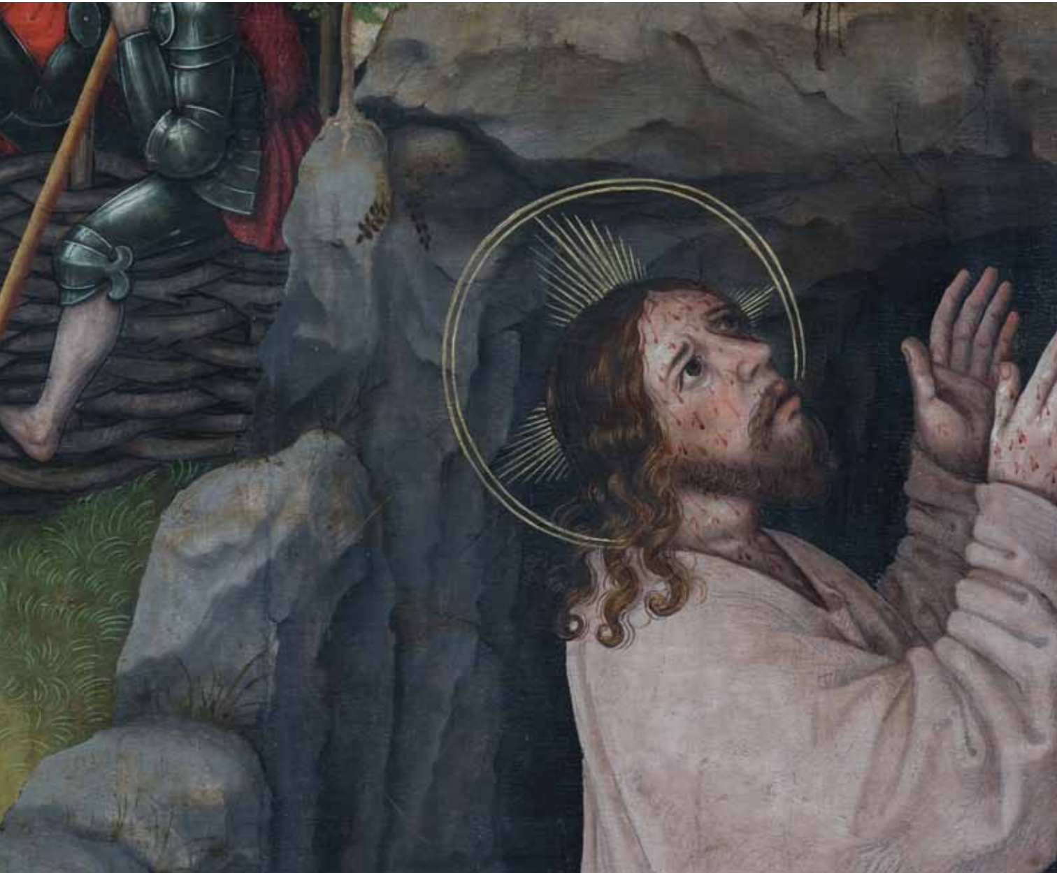
Detail obrazu Olivetská hora Christus am Ölberg, Detail