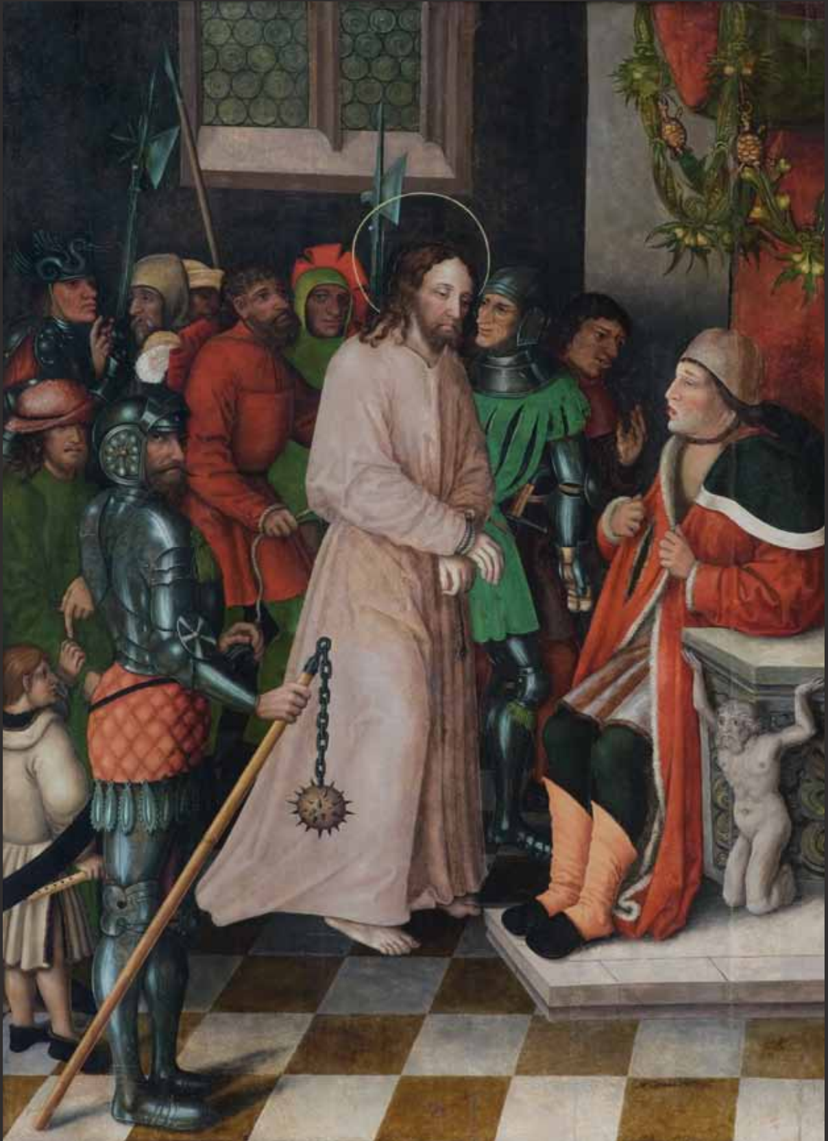
IV Kristus před Annášem Christus vor Hannas