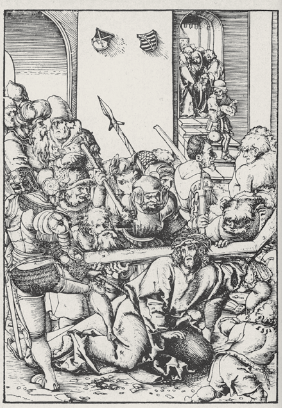
Lucas Cranach st. / d. Ä. Kristus padá pod křížem Die Kreuztragung 25 x 17,2 cm

Annášem, Kristus před Pilátem, Bičování Krista, Korunování Krista trním, Ecce homo, Nesení kříže, Ukřižování, Kladení Krista do hrobu, Zmrtvýchvstání Krista – zde na tumbě datace 1522, původně křídla rozebraného křídlového pětídílného oltáře s archou ve středu. Osm desek vzniklo rozříznutím čtyř původně oboustranně malovaných pohyblivých křídel oltáře; čtyři desky pocházejí z dvoudílných, po jedné straně malovaných, původně pevných křídel. Hans Hesse vycházel při komponování roudnického cyklu z grafických předloh, avšak zacházel s nimi daleko volněji než na oltáři z klášterního kostela v Chemnitz/Ebersdorf (1513). Výrazně se přidržel Cranachových grafických listů z cyklu Pašijí u scény Krista před Annášem, Krista před Pilátem, u Korunování Krista trním, a dále u námětů: Ecce homo, Nesení kříže, Kladení do hrobu a Zmrtvýchvstání Krista. Scéna s Kristem na hoře Olivetské je volně inspirována grafickým listem Schongauerovým (kol. 1480) či rytinou Antona Sorga z cyklu Pašijí, vydaného v St. Gallen v roce 1480. 28 Zajímavou paralelou je také scéna Krista na hoře Olivetské na desce spojené s Mistrem der Gewandstudien