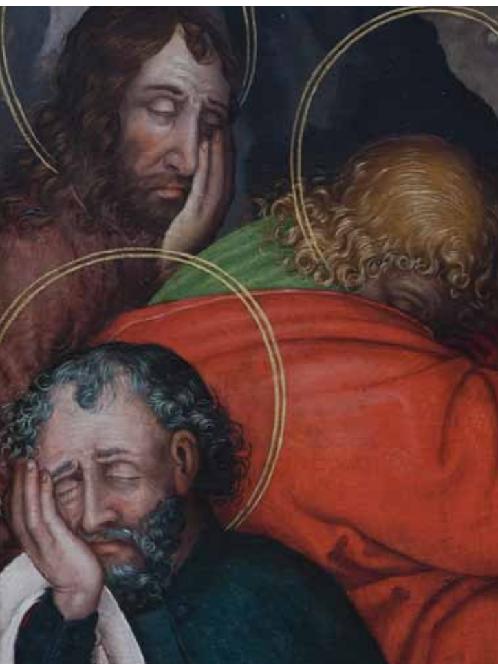
Detail obrazu Olivetská hora Christus am Ölberg, Detail