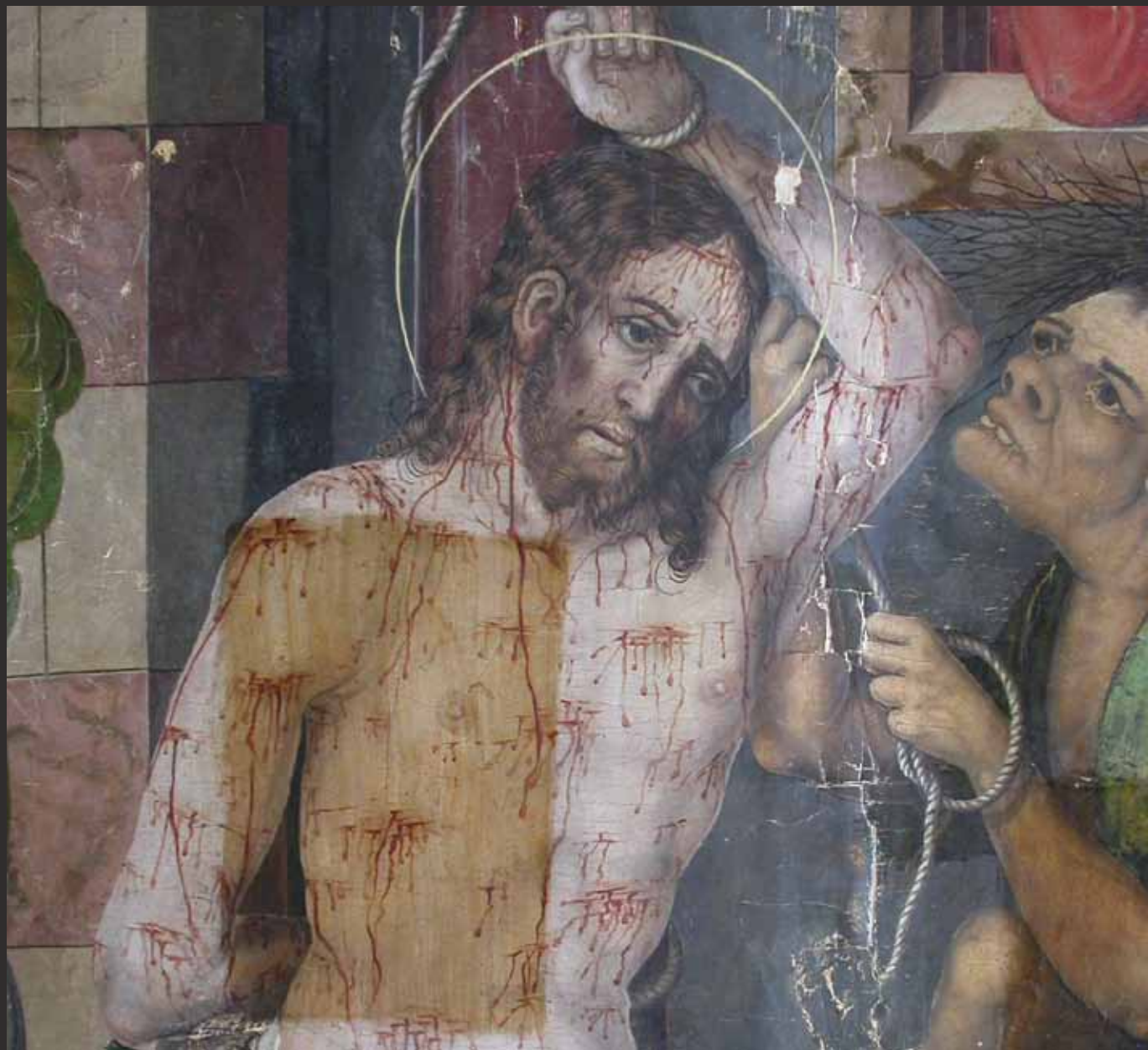
Detail obrazu Bičování Geißelung Christi, Detail ◀ Detail obrazu Poslední večeře ◀ Das Letzte Abendmahl, Detail