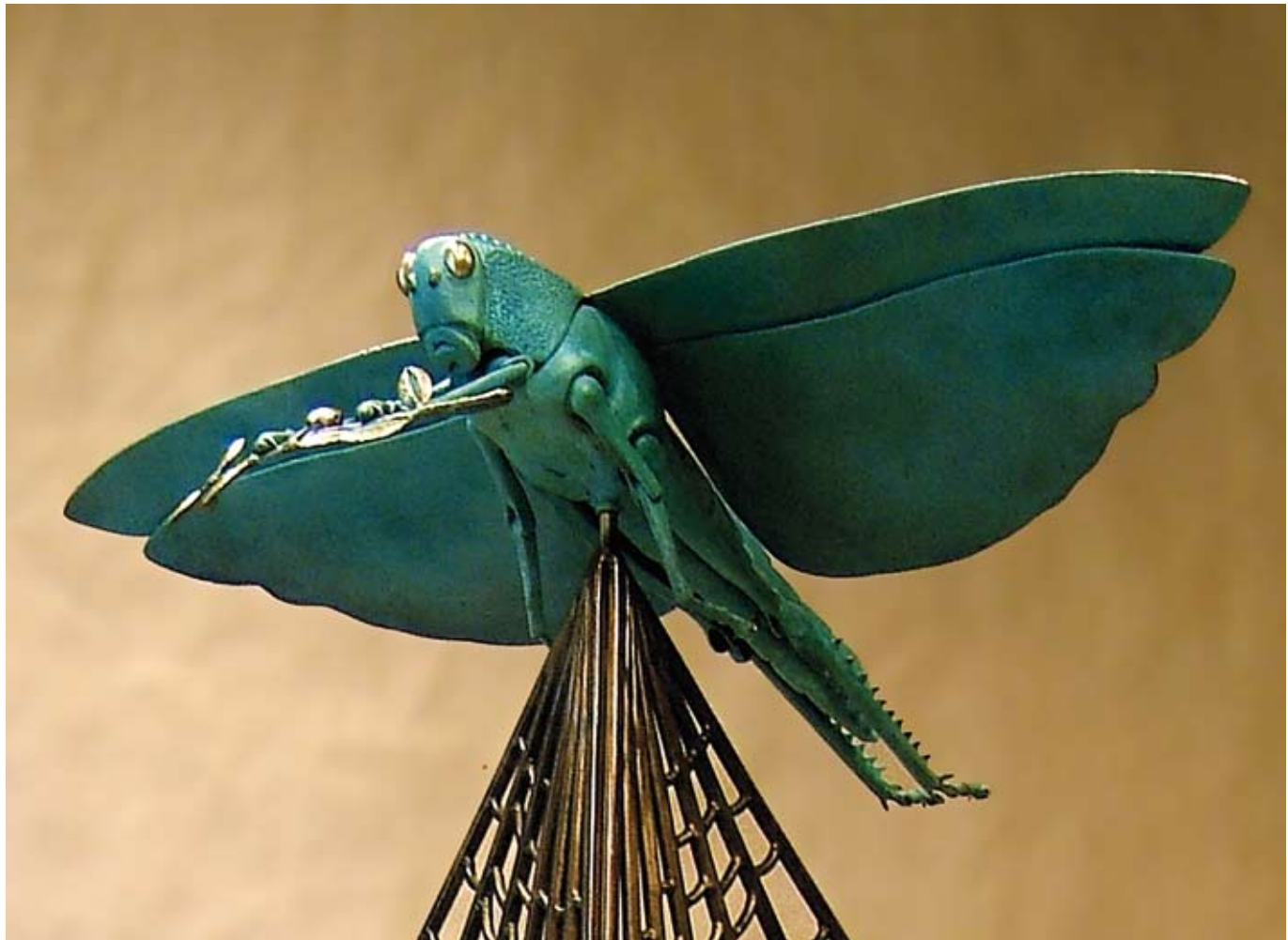
PEACE KEEPER GRASSHOPPER, 2006, edition 1/5 Bronze, 55 ½ x 30 ¾ x 23 ½ in.