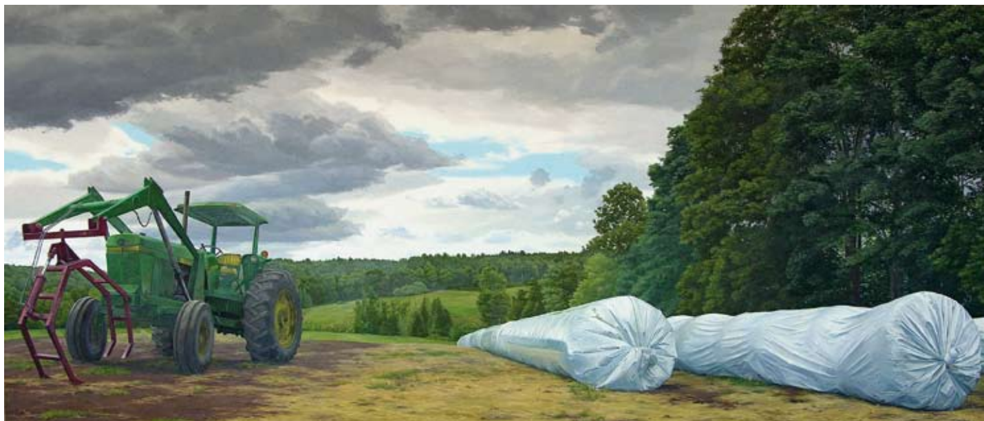
TRACTOR AND AG-BAGS, GROTON, VERMONT, 1994 Oil on canvas, 30 x 90 in. Courtesy of the artist and Tibor de Nagy Gallery, New York, New York

ТРАКТОР І МІШКИ, ГРОТОН, ВЕРМОНТ, 1994 Олійні фарби, полотно, 78,2 x 228,6 см. Картину люб'язно надано автором та галереєю Тібор де Нагі, Нью-Йорк