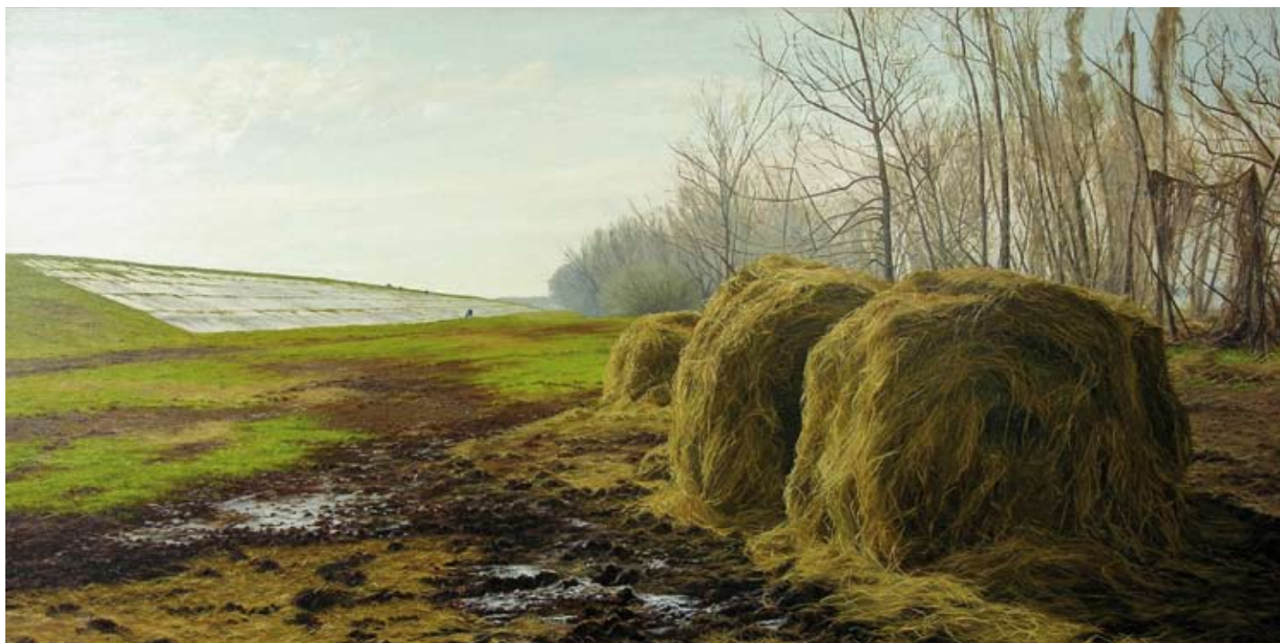
HAY BALES ON THE BATTURE, BATON ROUGE, LOUISIANA, 1997 Oil on canvas, 30 x 60 in. Courtesy of the artist and Tibor de Nagy Gallery, New York, New York

СТОГИ СІНА, БАТОН РУЖ, ЛУЇЗІАНА, 1997 Олійні фарби, полотно, 76,2 x 152,4 см. Картину люб'язно надано автором та галереєю Тібор де Нагі, Нью-Йорк