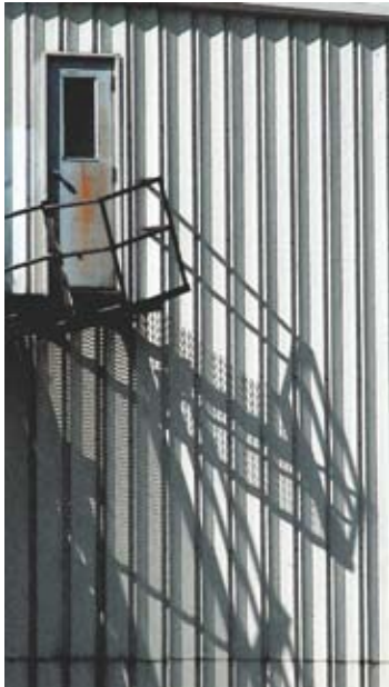
DRY BATCH PLANT, Virginia Concrete Company, Woodbridge Facility, detail 1, 2004 Digital print, 10 ½ x 6 in.

БЕТОННИЙ ЗАВОД, Цементна компанія Вірджинії, Вудбрідж, деталь 1, 2004 Цифровий друк, 26,7 x 15,2 см