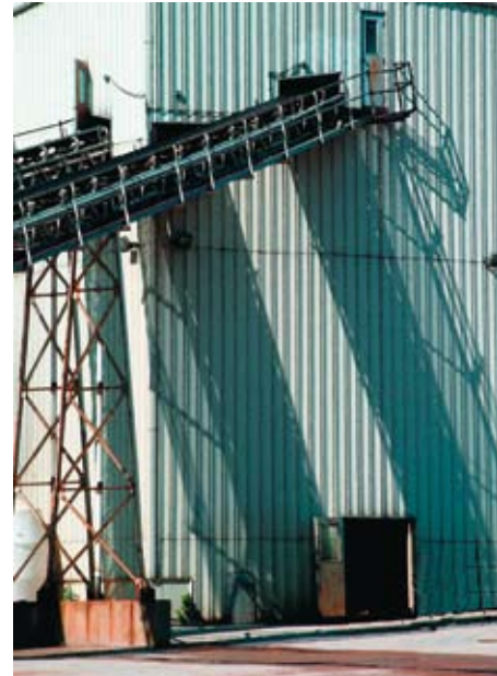
DRY BATCH PLANT, Virginia Concrete Company, Woodbridge Facility, detail 3, 2004 Digital print, 9 ¼ x 8 in. Courtesy of the artist, Mason Neck, Virginia

БЕТОННИЙ ЗАВОД, Цементна компанія Вірджинії, Вудбрідж, деталь 1, 2004 Цифровий друк, 26,7 x 15,2 см Картину люб'язно надано автором, Мейсон Нек, штат Вірджинія