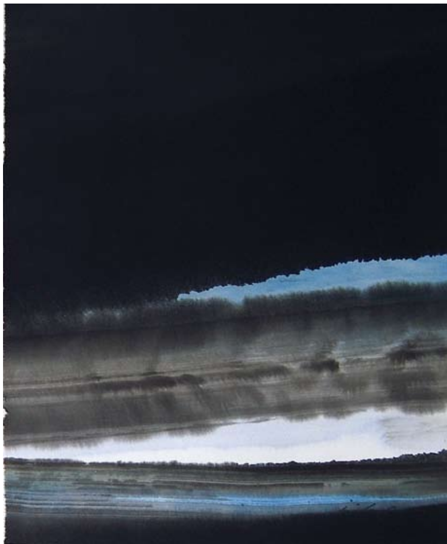
ANTICIPATION , 2006

Ink and watercolor, 11 ⅞ x 9 ¼ in. Courtesy of the artist and Carla Massoni Gallery, Chestertown, Maryland