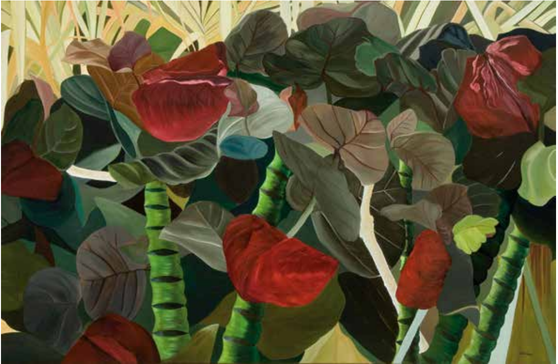
Red Leaves , 2005. Oil on canvas, 42 x 64 in. (106,7 x 162,6 cm). Courtesy of the artist, Crofton, Maryland

အနီရောင်သစ်ရွက်များ (2005) ပတ္တမြားပေါ်တွင် ဆီဆေးဖြင့် ရေးဆွဲသည်။ ၄၂ ဝ ၅၄ လက်မ ( ၁၀၆.၇ ဝ ၁၆၂.၆ စင်တီမီတာ) မယ်ရီလန်ပြည်နယ်၊ ခရော့စ်တန် မှ ပန်းချီအနုပညာရှင် ဇနီးချစ်ပြုချက်ဖြင့် တင်ပြသည်။