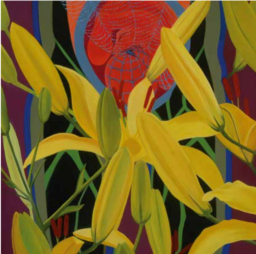
Spider Baby (Red). Oil on canvas, 20 x 20 in. (50,8 x 50,8 cm). Courtesy of the artist, Crofton, Maryland

ပင့်ကူပေါက်လေး (အာနီ) ပတ္တမြားပေါ်တွင် ဆီဆေးဖြင့် ရေးဆွဲသည်။ ၂၀ ထ ၂၀ လက်မ ( ၅၀၈၈ မီ ၅၀၈၈ မီလီမီတာ ) မယ်ရီလန်ပြည်နယ်၊ ခရော့စ်တန် မှ ပန်းချီအနုပညာရှင် ၏ ခွင့်ပြုချက်ဖြင့် တင်ပြသည်။