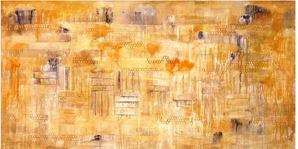
Cave Symphony, 2005 Acrylic on canvas on panel 38 x 76 in. (96,5 x 193 cm) Courtesy of the artist, Pleasanton, California

ဥမင်တေးသွားသံစဉ် (2005) ပျဉ်ချပ်ပေါ်ရှိ ပတ္တမြားပေါ်တွင် အခရယ်လစ်ဖြင့် ရေးဆွဲသည်။ ၃၈ ထ ၇၆ လက်မ (၉၆.၅ ထ ၁၉၃ စင်တီမီတာ) ကယ်လီဖိုးနီးယားပြည်နယ်၊ ပလယ်ဆန်တန် ရှိ ပန်းချီအနုပညာရှင်၏ ခွင့်ပြုချက်ဖြင့် တင်ပြသည်။