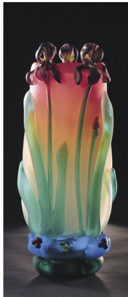
Iris Vase 2004 Glass