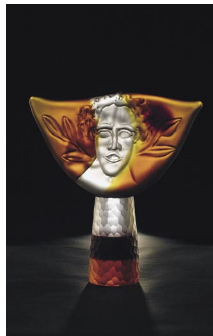
Rise 2002 Glass