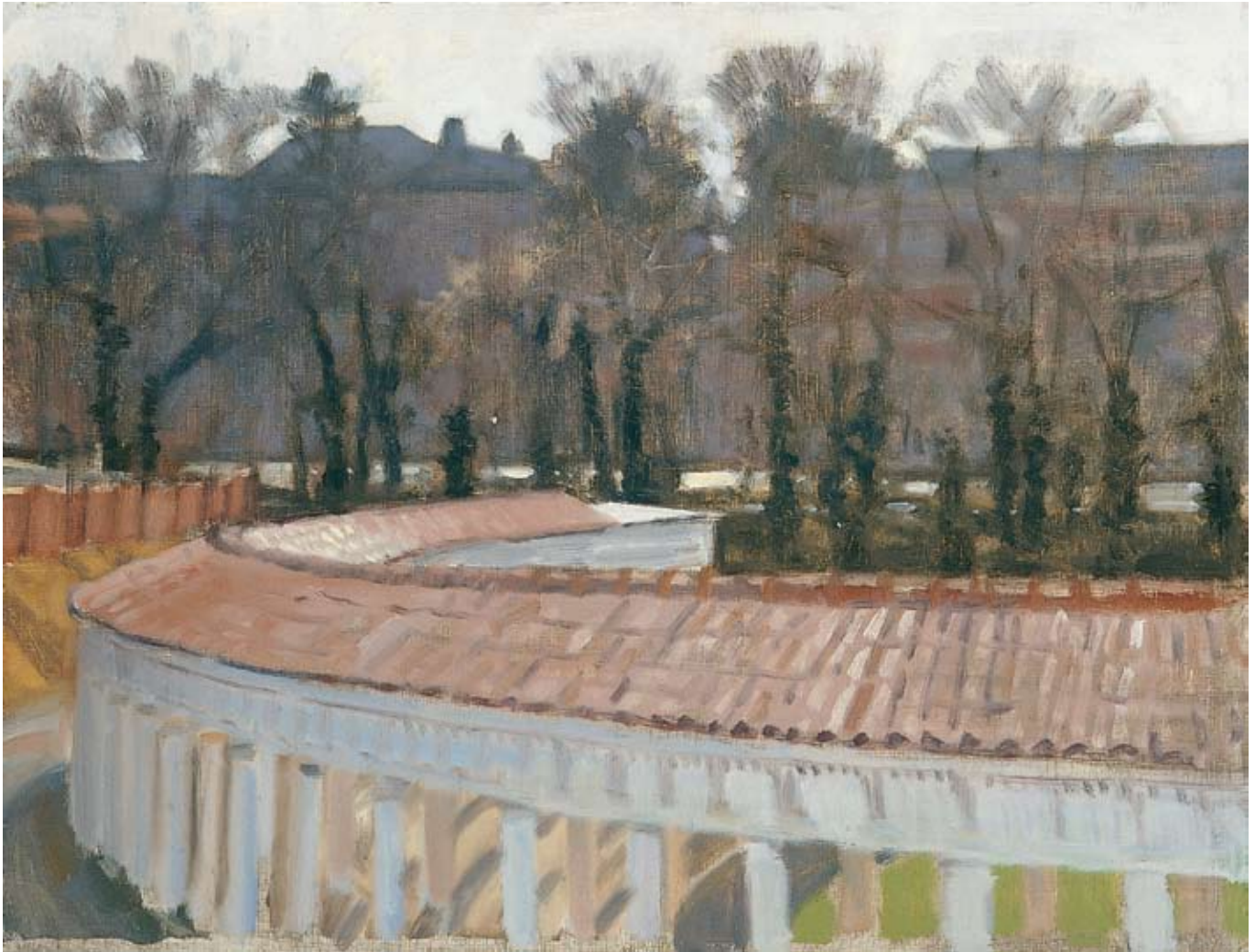
Colonnade, University of Virginia, 2005 Oil on board, 12 x 16 in.