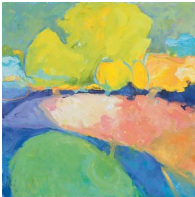
Spring, 2004 Oil on canvas, 24 x 24 in.