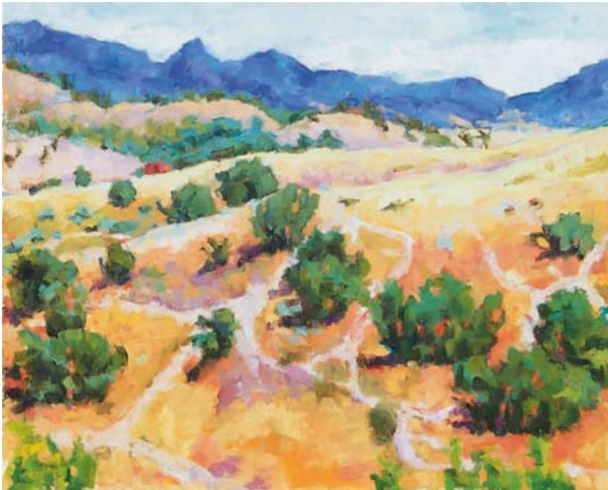
Copper Ridge, 2004 Oil on canvas, 24 x 30 in.