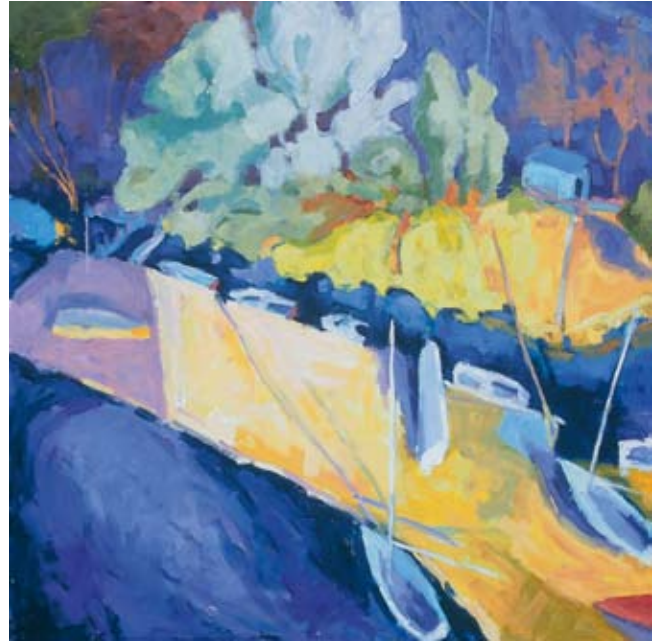
Jack's Boats, 2004