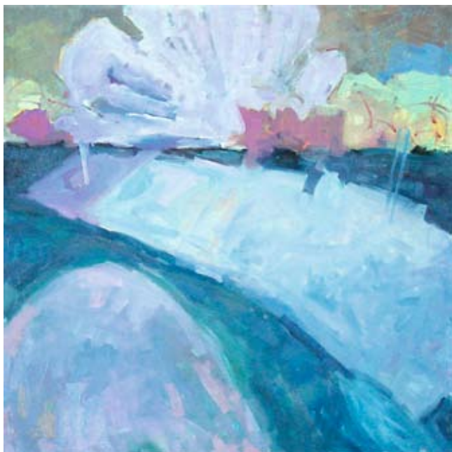
Winter, 2004 Oil on canvas, 24 x 24 in.