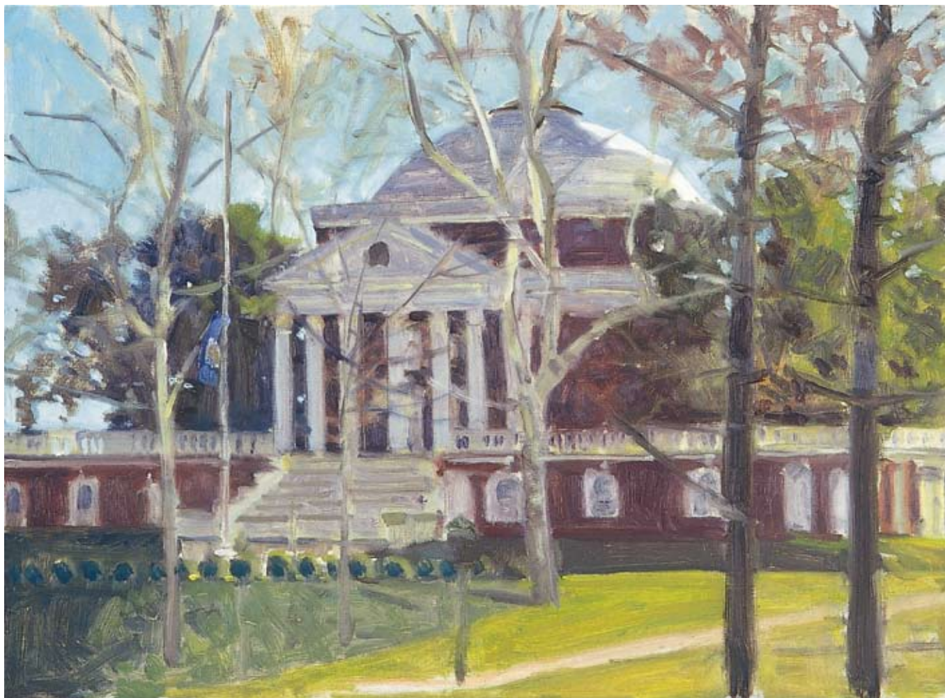
Rotunda, University of Virginia, 2007 Oil on board, 12 x 16 in. Courtesy of the artist, Charlottesville, Virginia