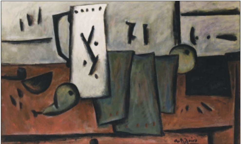
4. Jarra blanca. Oli/tela. 73 x 116 cm. (2003)