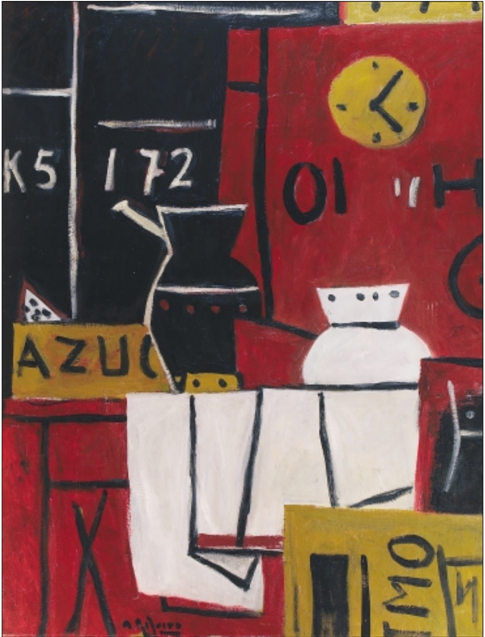
1. Ritmo. 116 x 89 cm. Oli/tela. (1995)