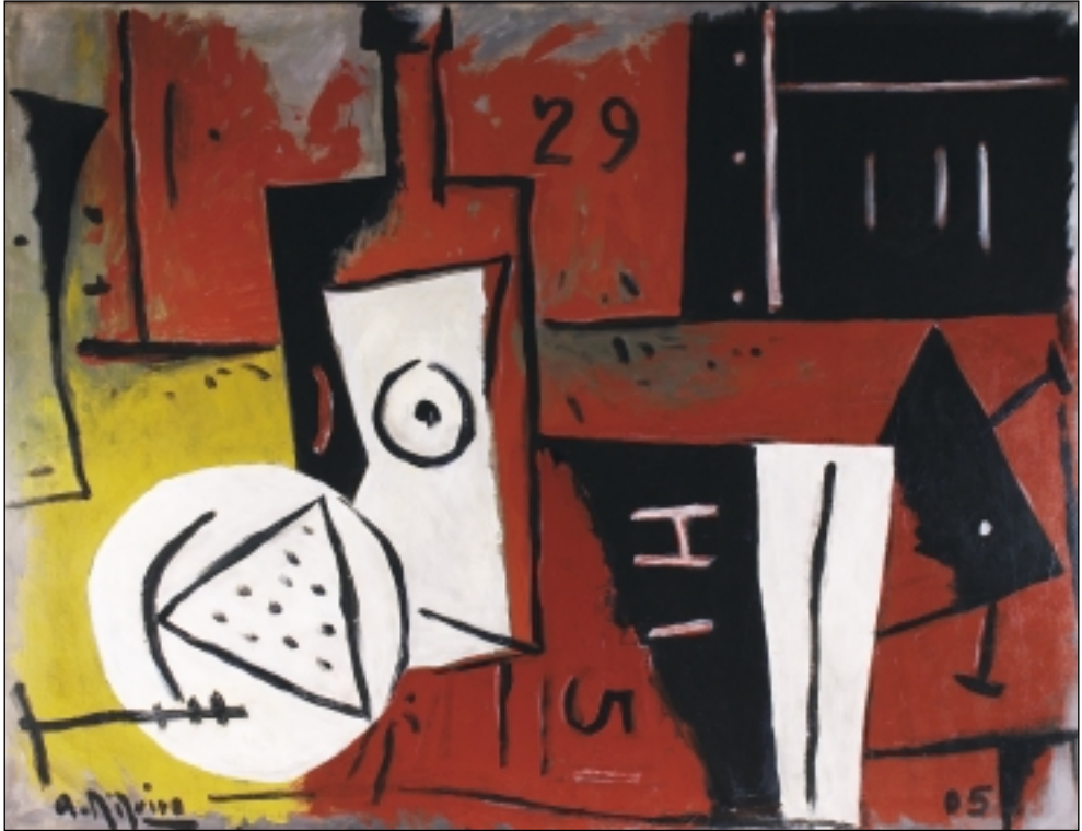
2. Bodegón 29. Acrílico/tela. 130 x 162 cm. (2005)