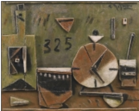
7. Bodegón. Oli/fusta. 51 x 60 cm. (2002)