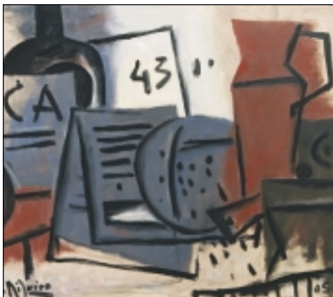
Bodegón 43. Oli/tela. 54 x 65 cm. (2005)