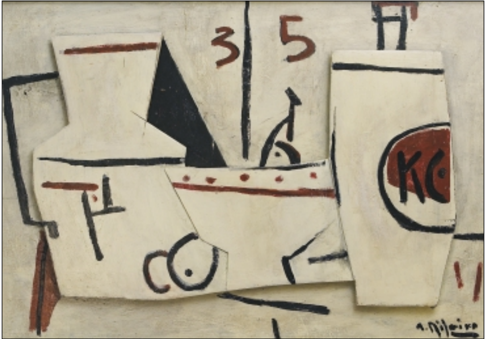
6. Bodegón 35. Oli/fusta. 65 x 92 cm. (2005)