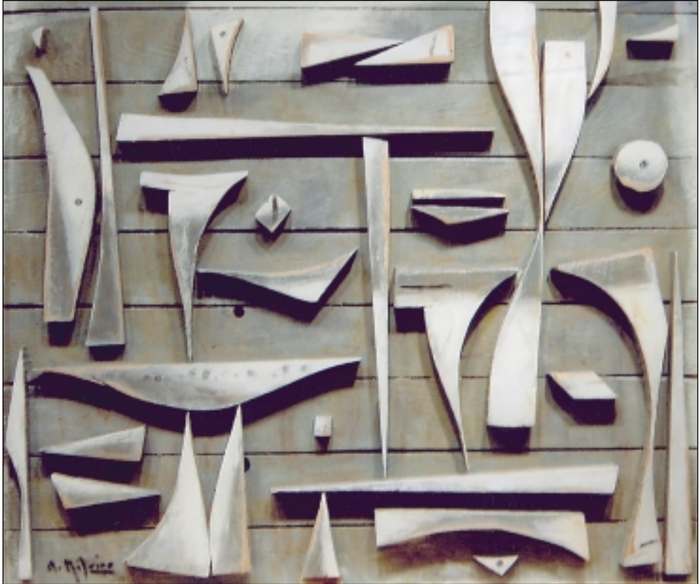
5. Ritmo constructivo. Oli/fusta. 87 x 100 cm. (2005)