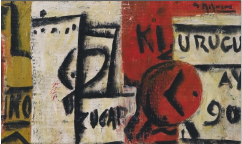
3. Bodegón. Oli/cartró. 35 x 61 cm. (1989)