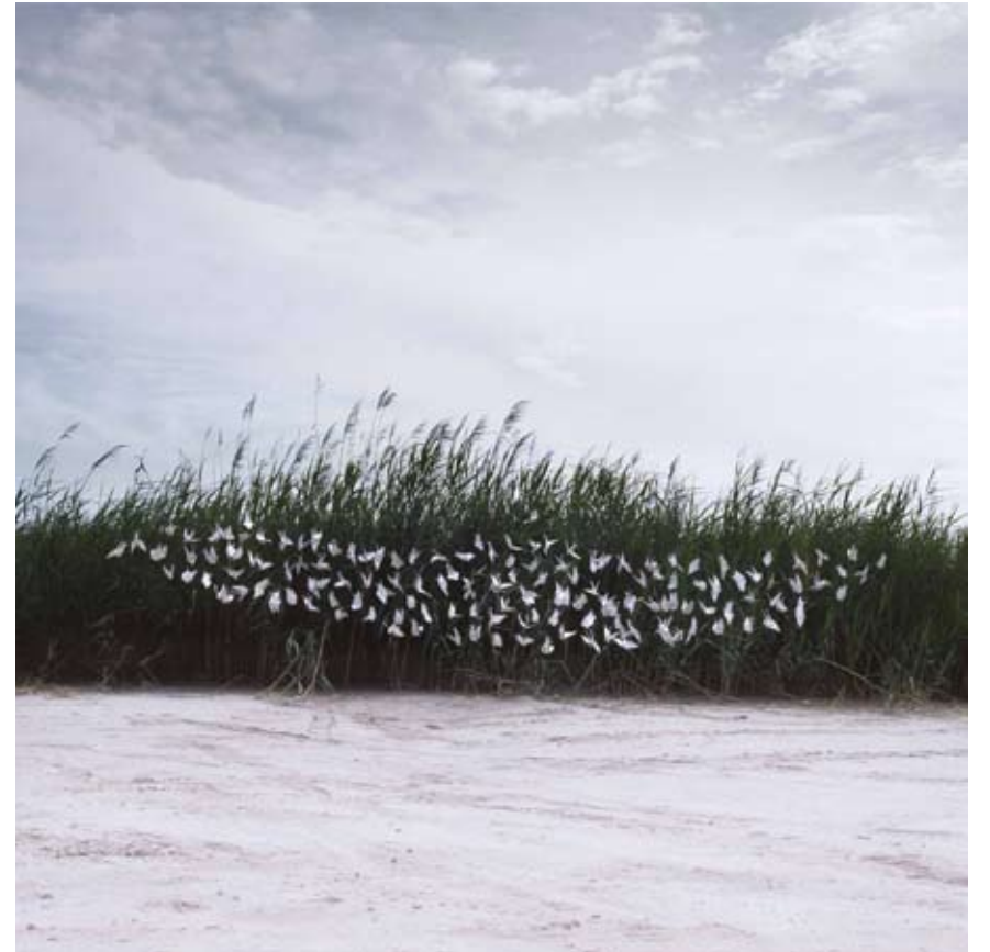
Delicias en mi Jardín 005 | 100 x 100 cm | C-Print on Henemmulher, dibond | 2011