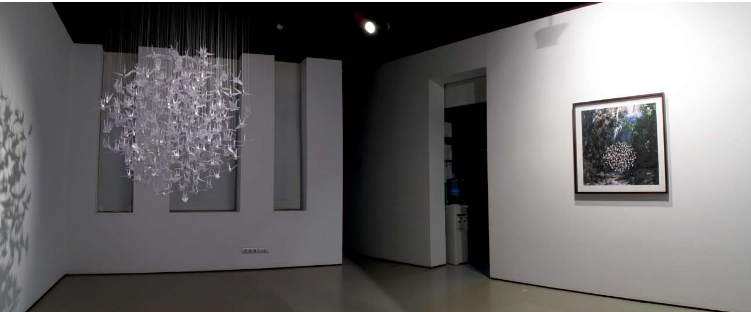
Sala III | Vista lateral