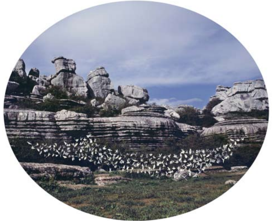
Delicias en mi Jardín 006 | 100 x 80 cm | C-Print on Henemmulher, dibond | 2011