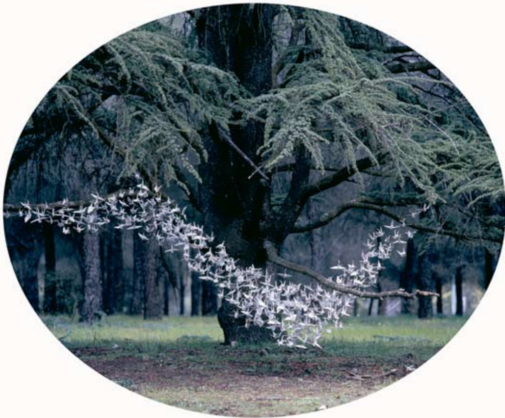
Delicias en mi Jardín 001 | 150 x 128 cm | C-Print on Henemmulher, dibond | 2010