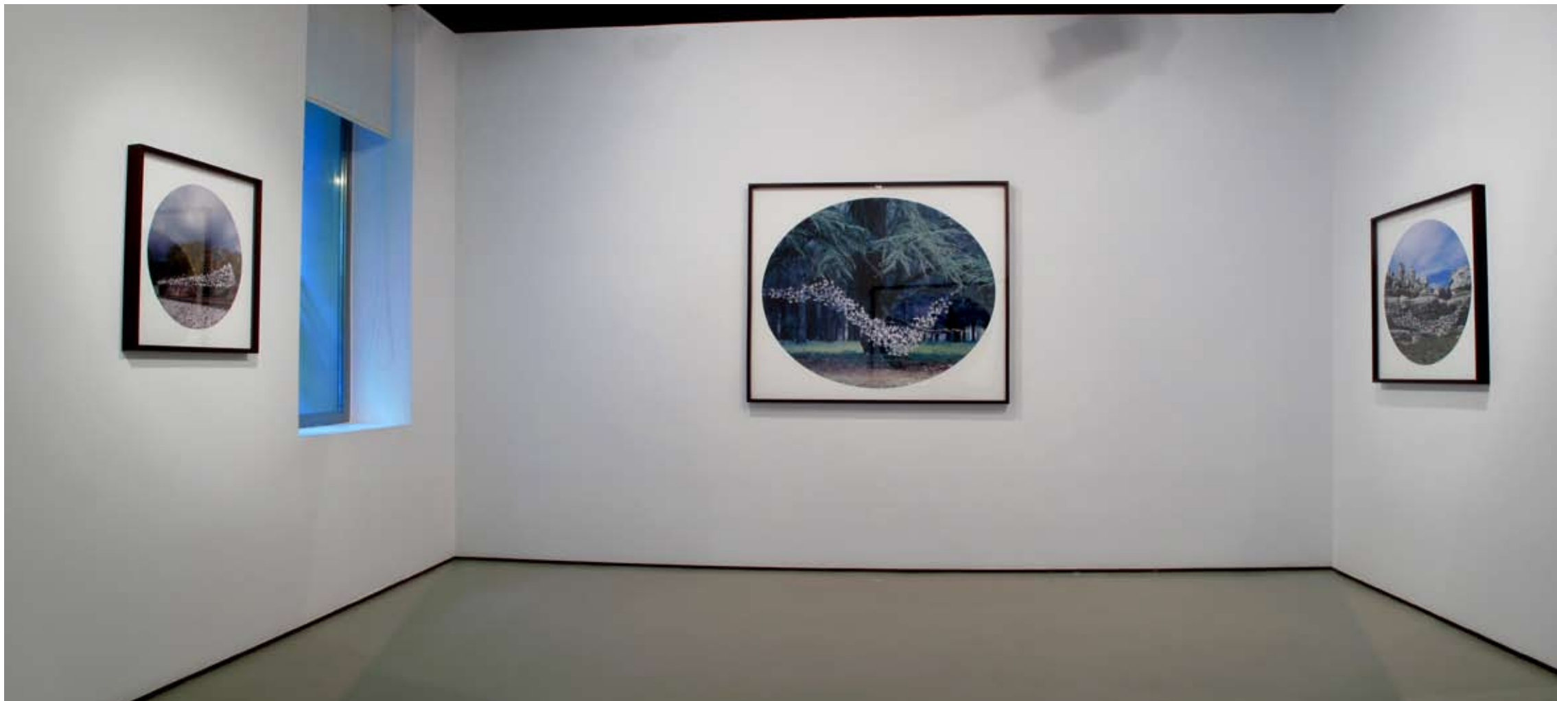
Sala I | Vista Frontal