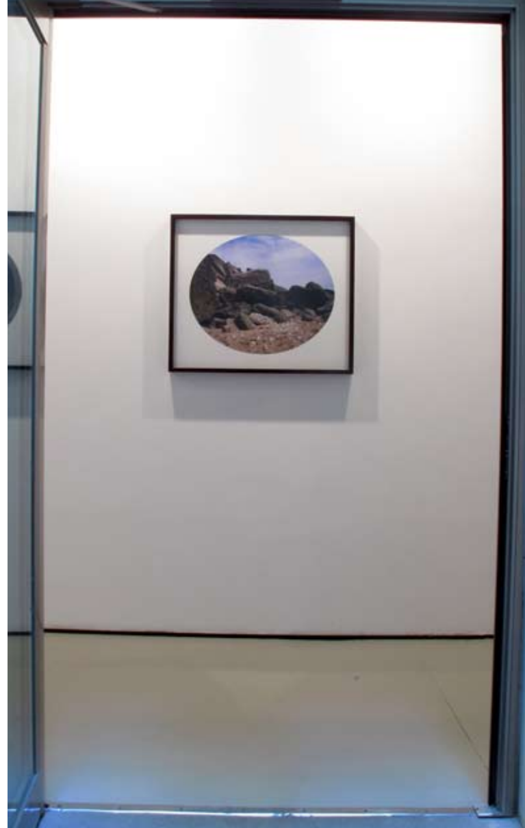
Pasillo I | Vistas frontal y lateral