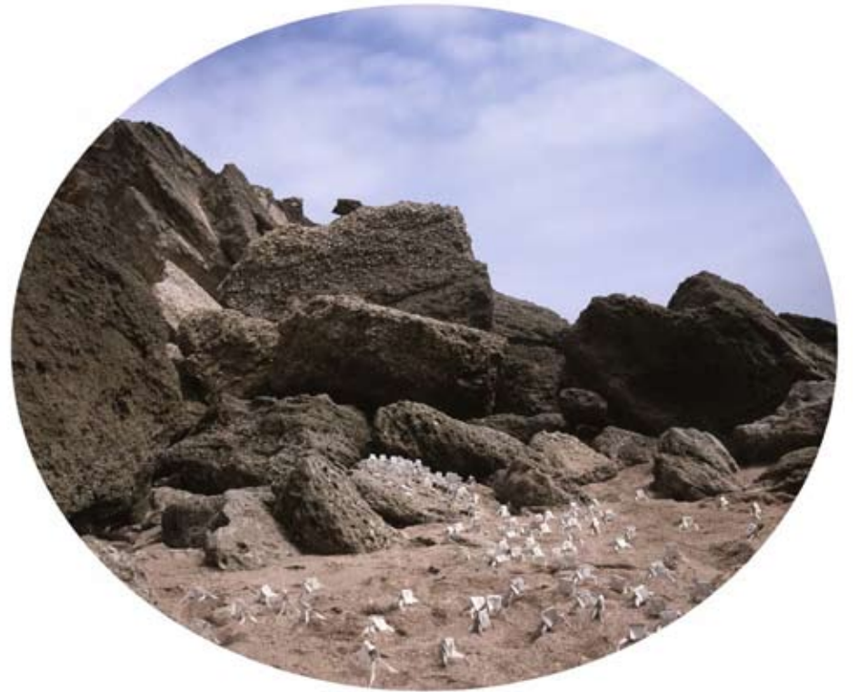
Delicias en mi Jardín 002 | 70 x 80 cm | C-Print on Henemmulher, dibond | 2010