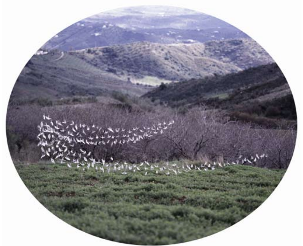
Delicias en mi Jardín 007 | 150 x 128 cm | C-Print on Henemmulher, dibond | 2011