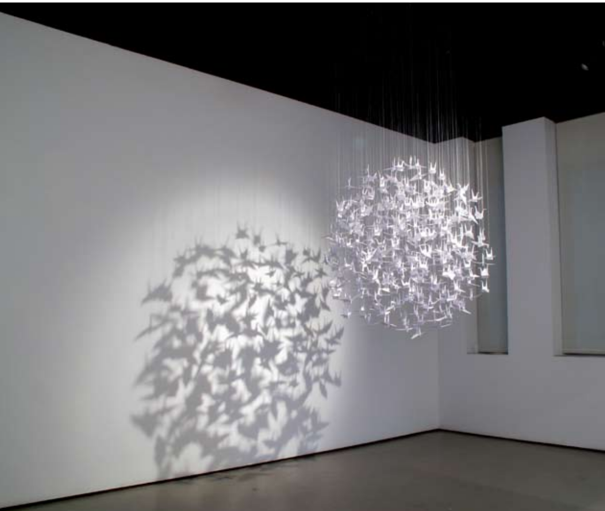
Instalación Delicias en mi Jardín | 110 x 110 cm aprox. | Origamis en papel bond/resita e hilos de seda | 2012