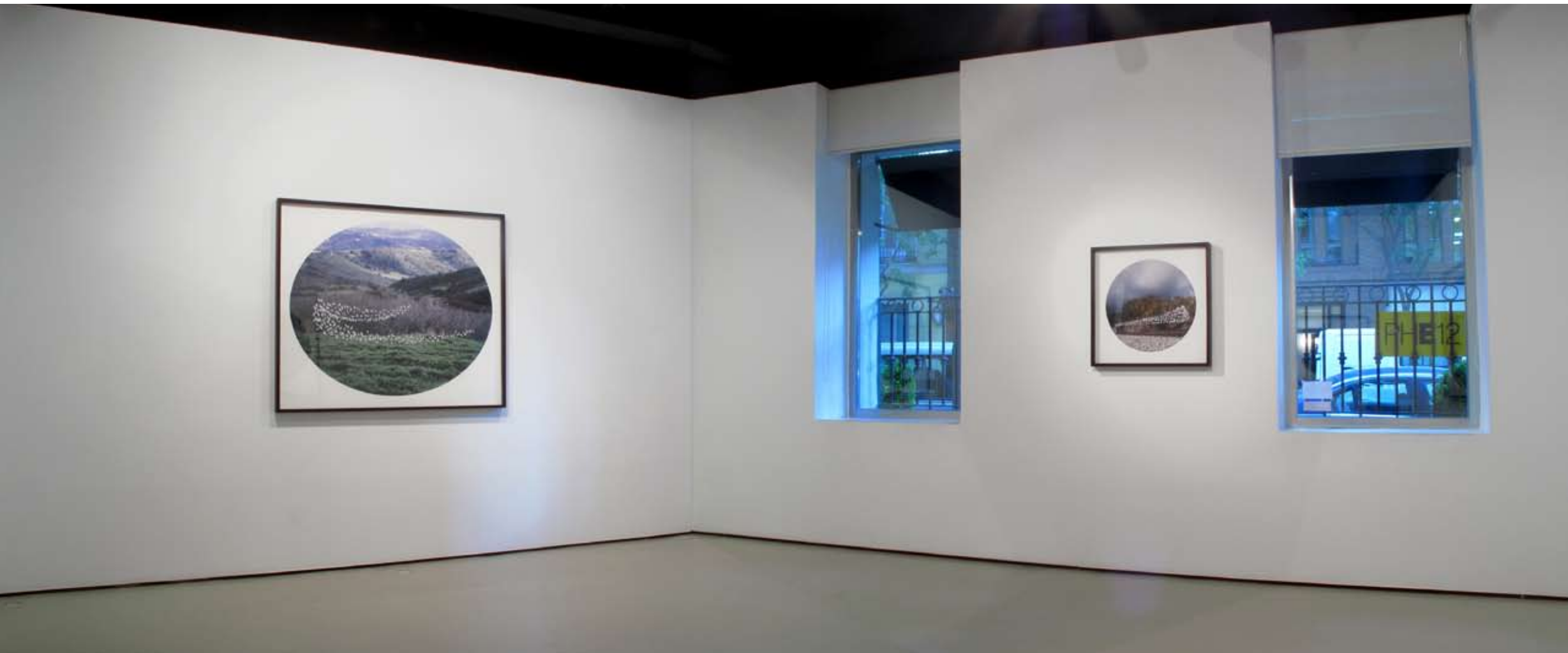
Sala I | Vista posterior