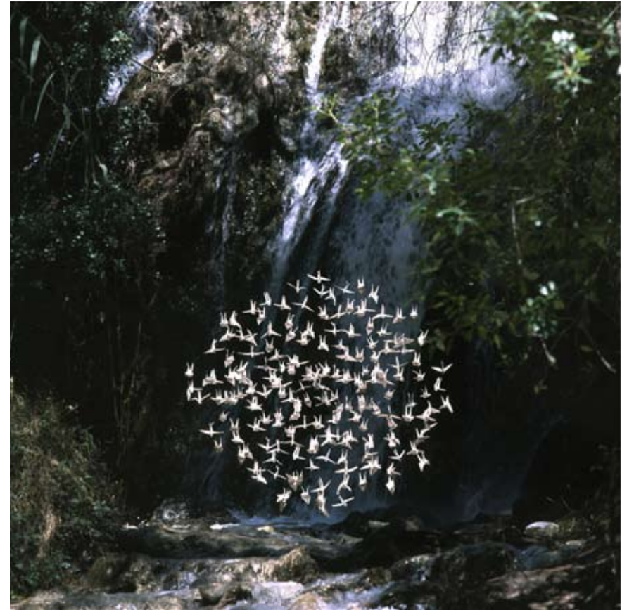
Delicias en mi Jardín 007 | 100 x 100 cm | C-Print on Henemmulher, dibond | 2010