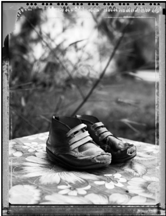
Botas. (Zapatos) 2012 | 80 x 60 cm | Impresión por pigmentos minerales sobre papel. Ed. 5