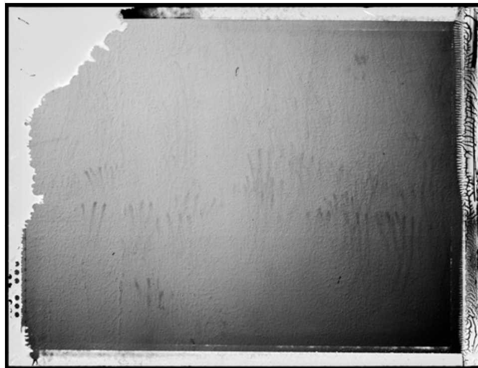
Pegadas. (Huellas) 2013 | 60 x 80 cm | Impresión por pigmentos minerales sobre papel. Ed. 5