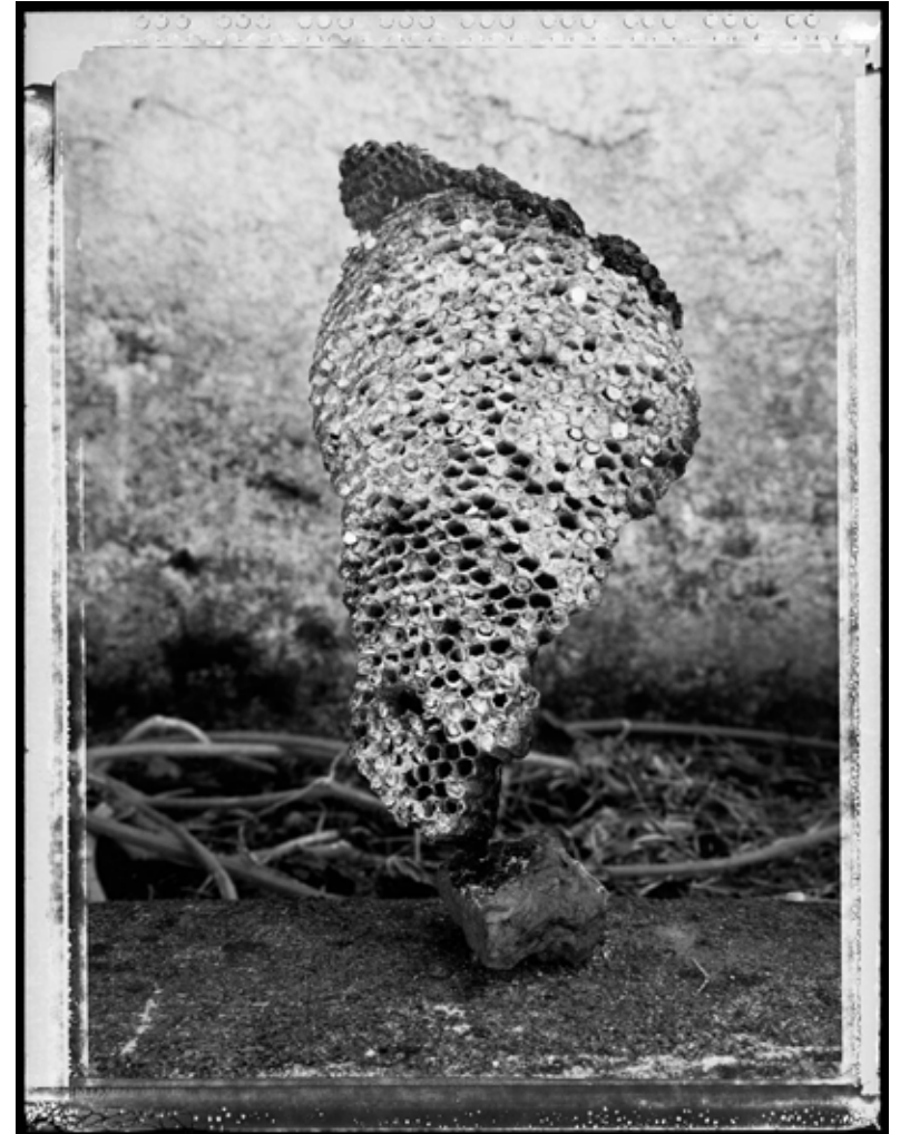
América. 2013 | 130 x 100 cm | Impresión por pigmentos minerales sobre papel. Ed. 5