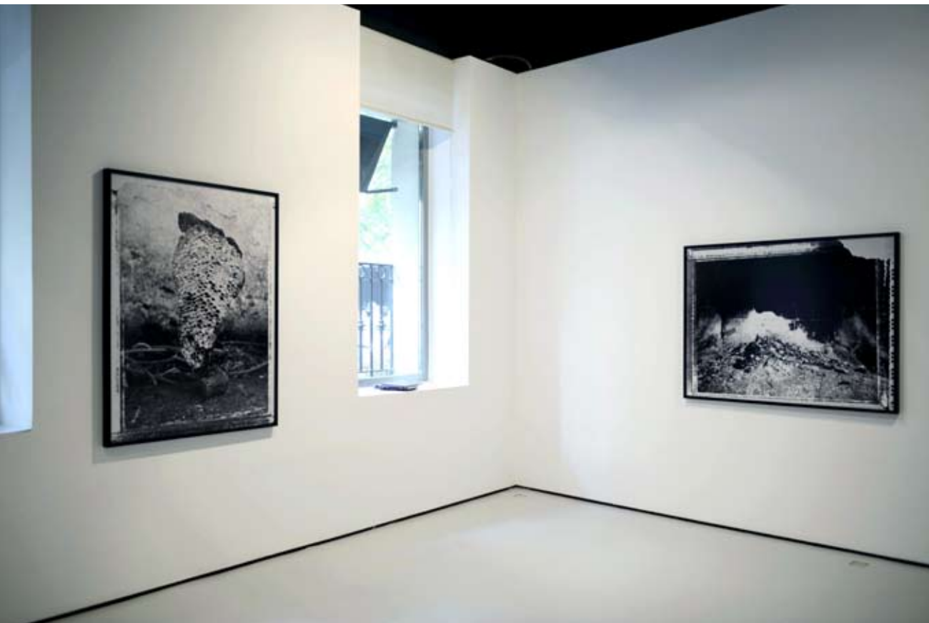
Vista sala I.