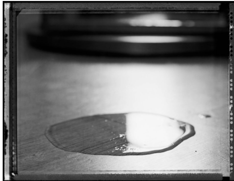
Lago. 2013 | 60 x 80 cm | Impresión por pigmentos minerales sobre papel. Ed. 5