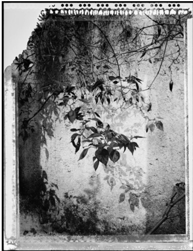
Dedo de Moça. (Dedo de chica) 2012 | 80 x 60 cm | Impresión por pigmentos minerales sobre papel. Ed. 5