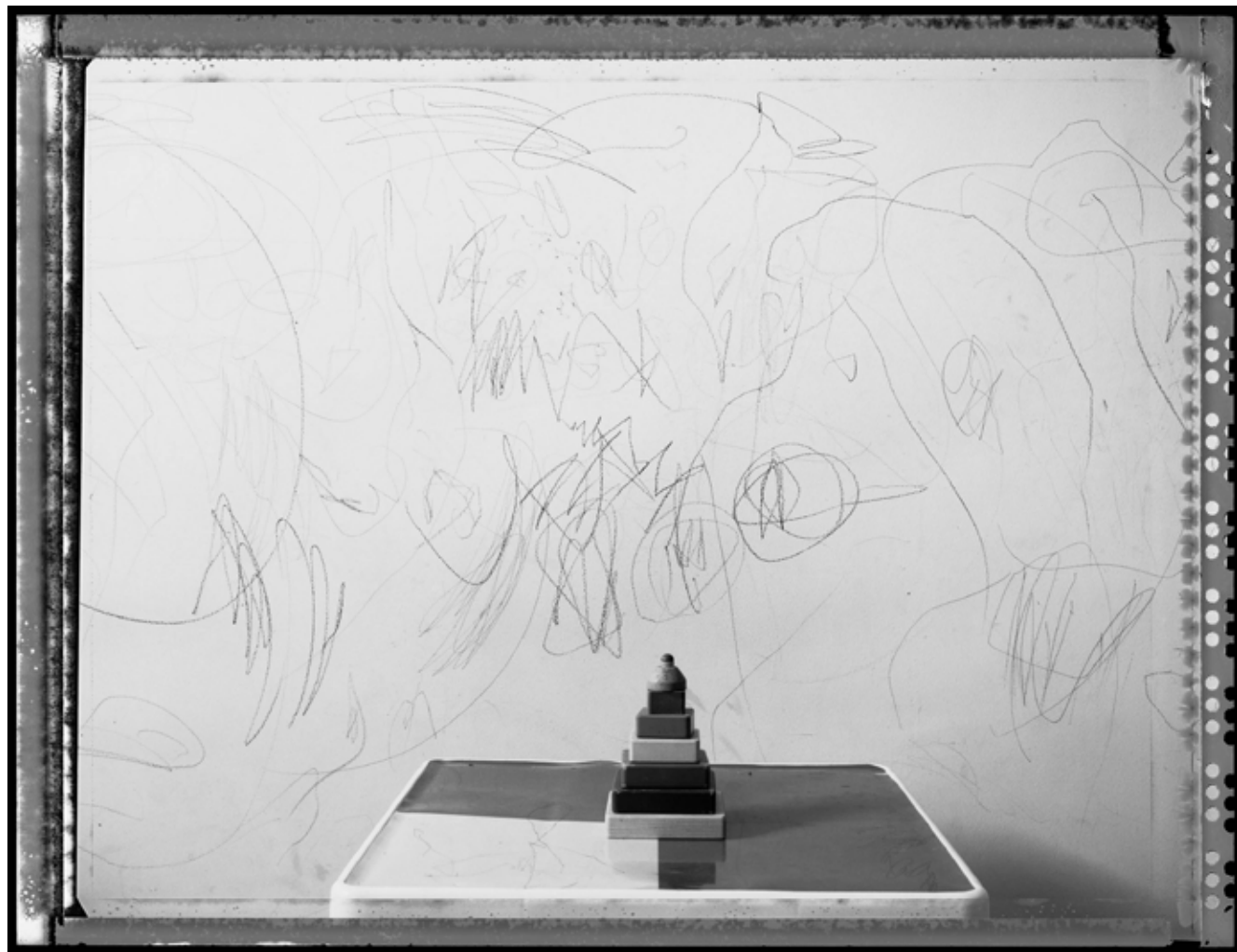
Torre. 2013 | 100 x 130 cm | Impresión por pigmentos minerales sobre papel. Ed. 5