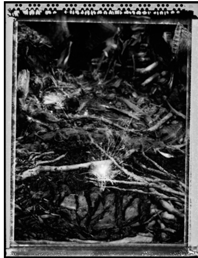
Estrla. (Stella) 2013 | 80 x 60 cm | Impresión por pigmentos minerales sobre papel. Ed. 5