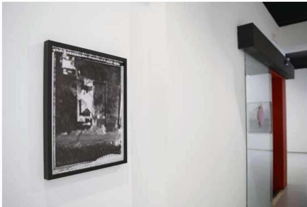
Vistas del pasillo.