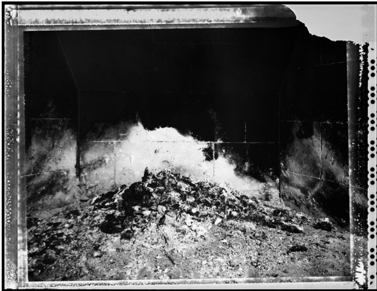
Lareira. (Chimenea) 2013 | 100 x 130 cm | Impresión por pigmentos minerales sobre papel. Ed. 5