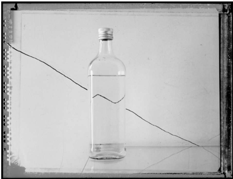
Garrafa. (Botellas) 2013 | 60 x 80 cm | Impresión por pigmentos minerales sobre papel. Ed. 5