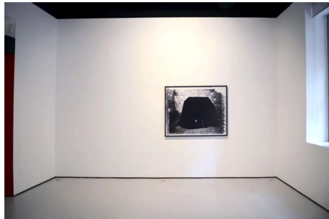
Vista hall y sala I.