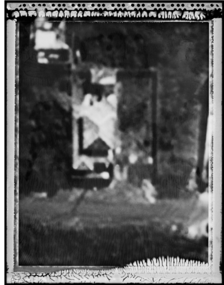
Satélite. 2014 | 60 x 40 cm | Impresión por pigmentos minerales sobre papel. Ed. 5