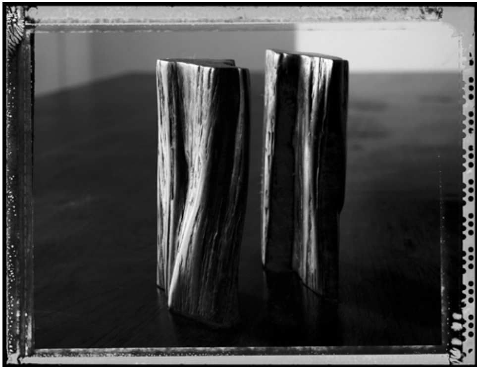
Braúnas. 2013 | 60 x 80 cm | Impresión por pigmentos minerales sobre papel. Ed. 5