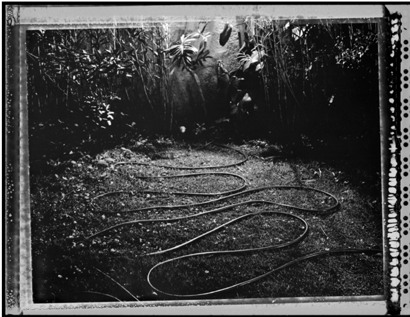
Mangueira. (Manguera) 2013 | 100 x 130 cm | Impresión por pigmentos minerales sobre papel. Ed. 5