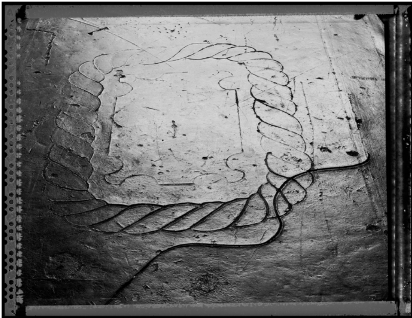
Malao. (Malón) 2013 | 100 x 130 cm | Impresión por pigmentos minerales sobre papel. Ed. 5