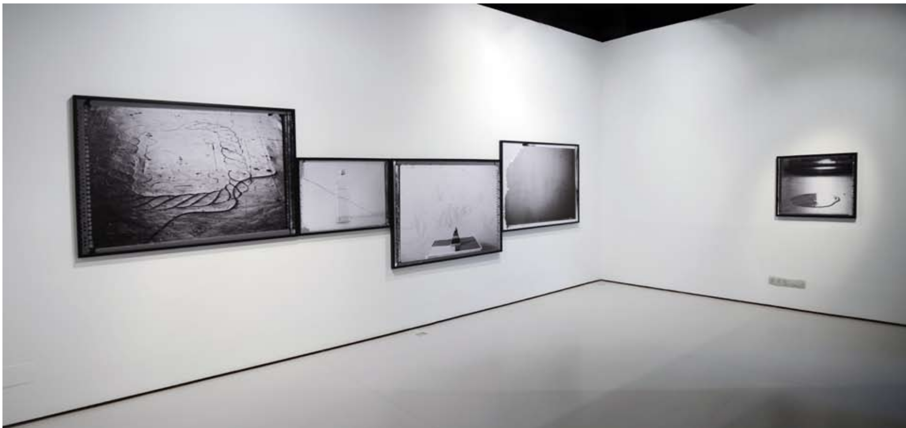
Vista sala II.