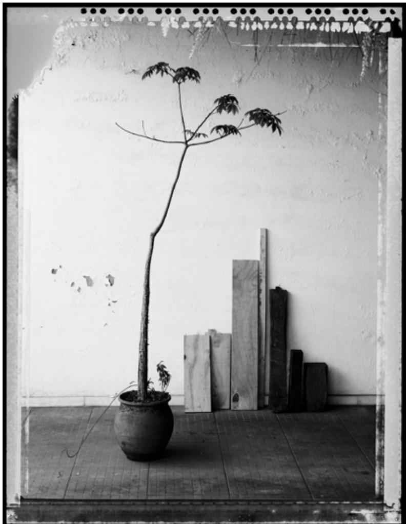
Skyline. 2012 | 130 x 100 cm | Impresión por pigmentos minerales sobre papel. Ed. 5