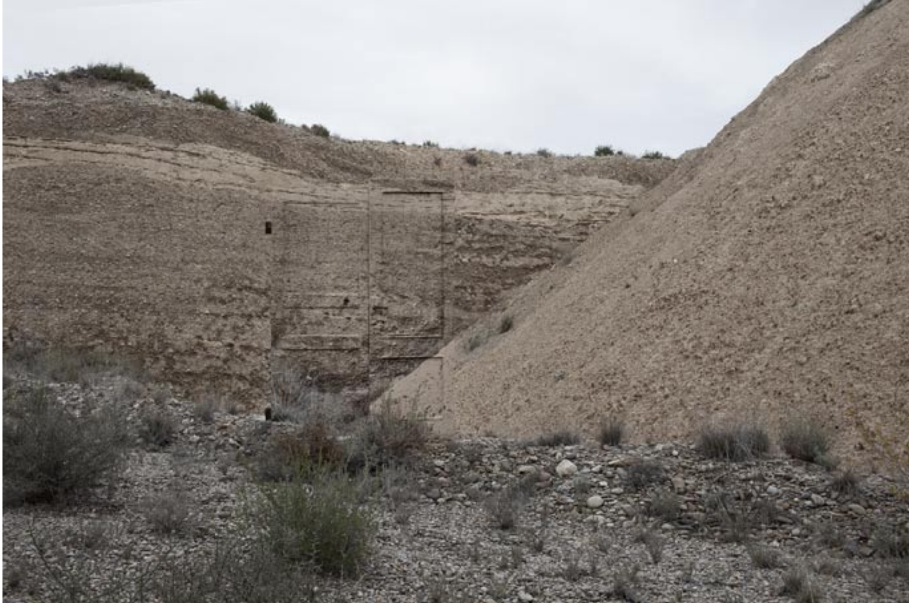
Infranqueable 02. En el límite 9. 2013 | 150 x 100 cm | Copia fotográfica lambda encapsulada en metacrilato y dibond.