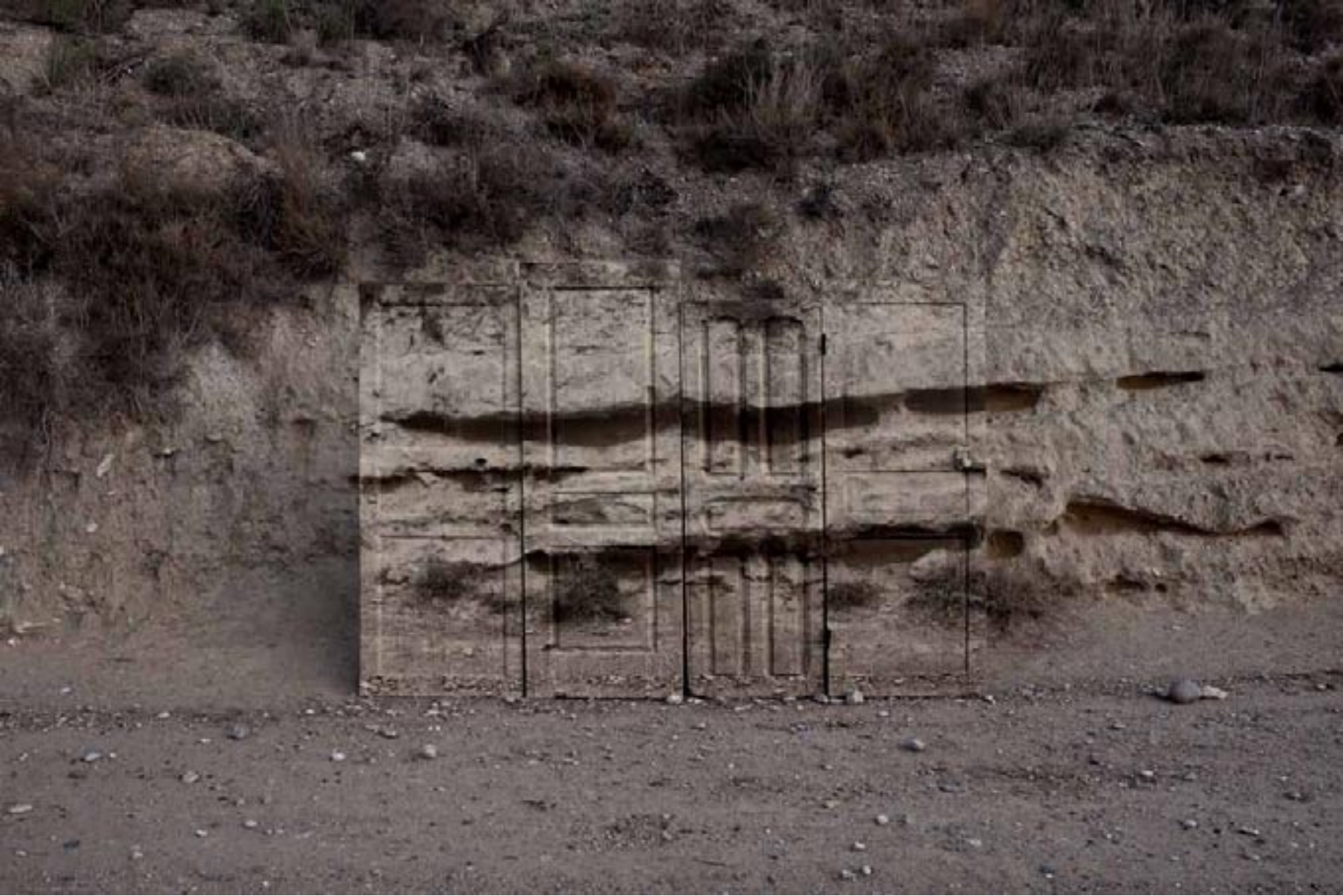
Infranqueable 02. En el límite, 6. 2012 | 150 x 100 cm | Copia fotográfica lambda encapsulada en metacrilato y dibond.