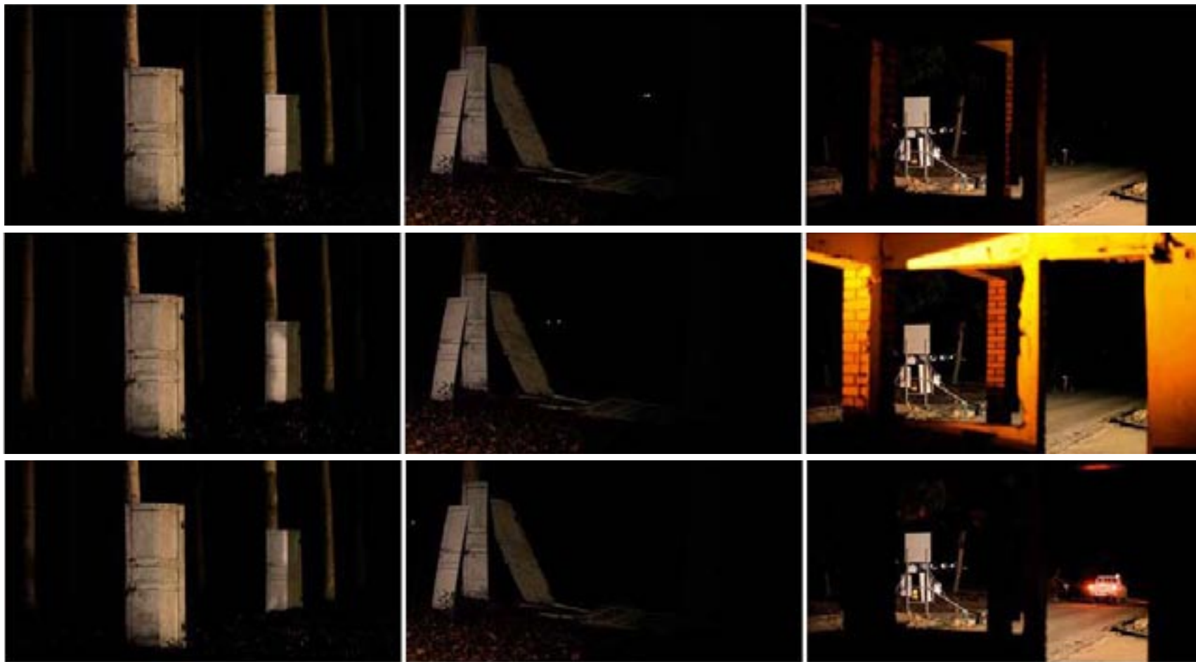
Frontera en la memoria. 2013 | Vídeo | Monocanal. Tres pantallas. Duración: 2' 10" . Ed. 3.