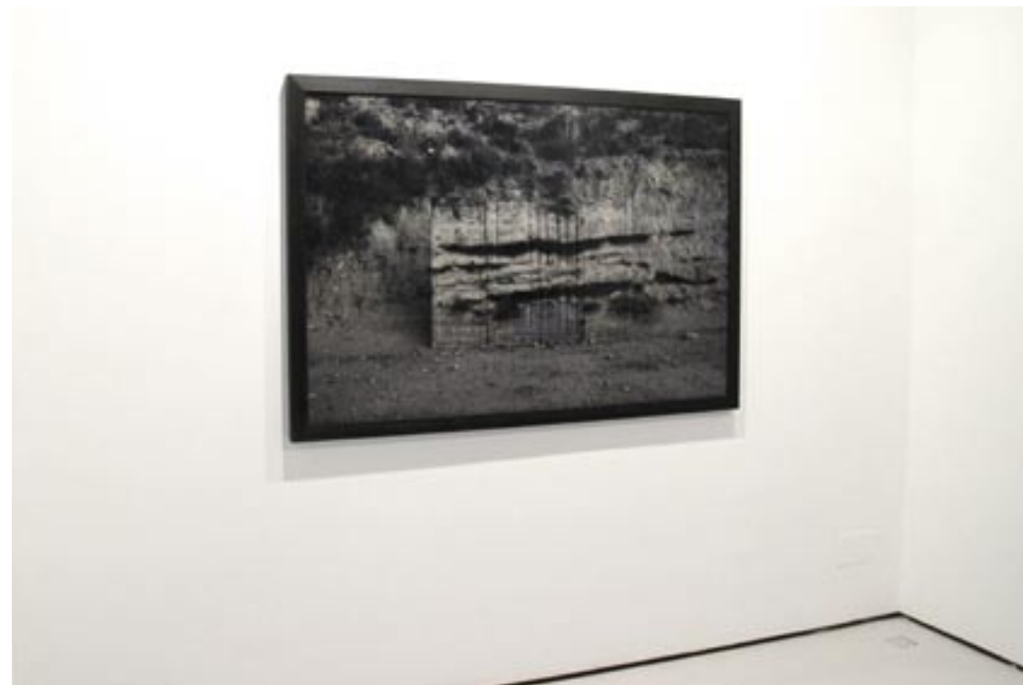
Vista hall Infranqueable 02. En el límite 10. 2013 | 150 x 100 cm | Copia fotográfica lambda encapsulada en metacrilato y dibond.