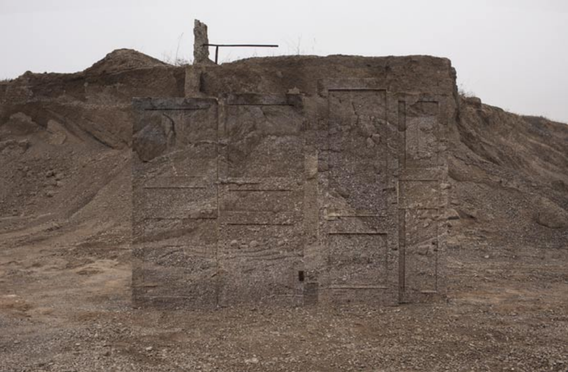
Infranqueable 02. En el límite 12. 2013 | 150 x 100 cm | Copia fotográfica lambda encapsulada en metacrilato y dibond.