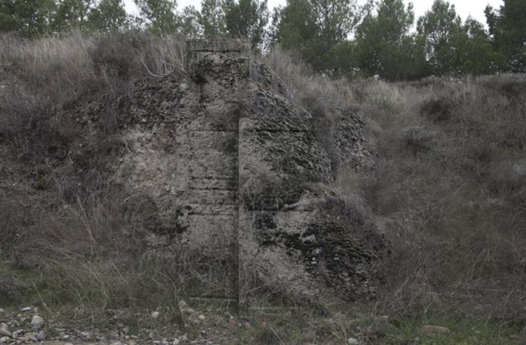
Infranqueable 02. En el límite 8. 2013 | 150 x 100 cm | Copia fotográfica lambda encapsulada en metacrilato y dibond.