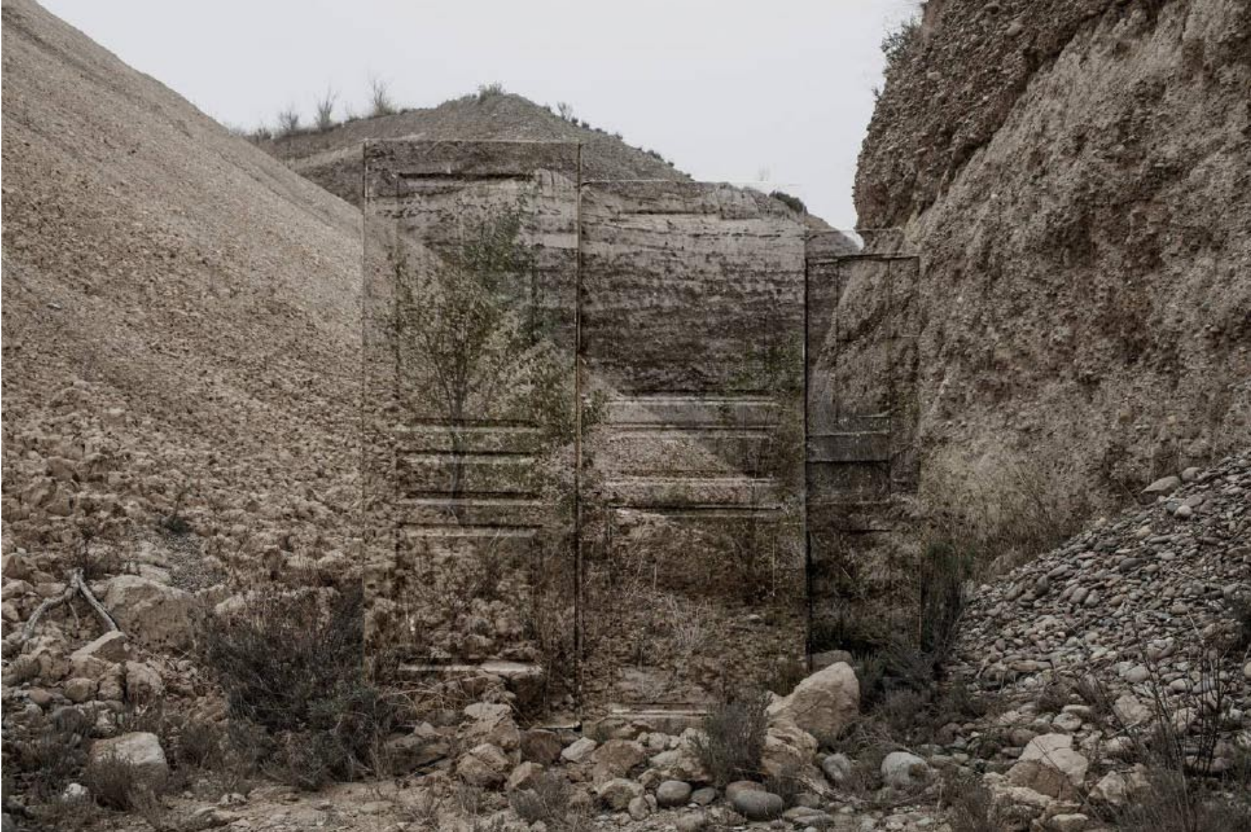
Infranqueable 02. En el límite 11. 2013 | 150 x 100 cm | Copia fotográfica lambda encapsulada en metacrilato y dibond.