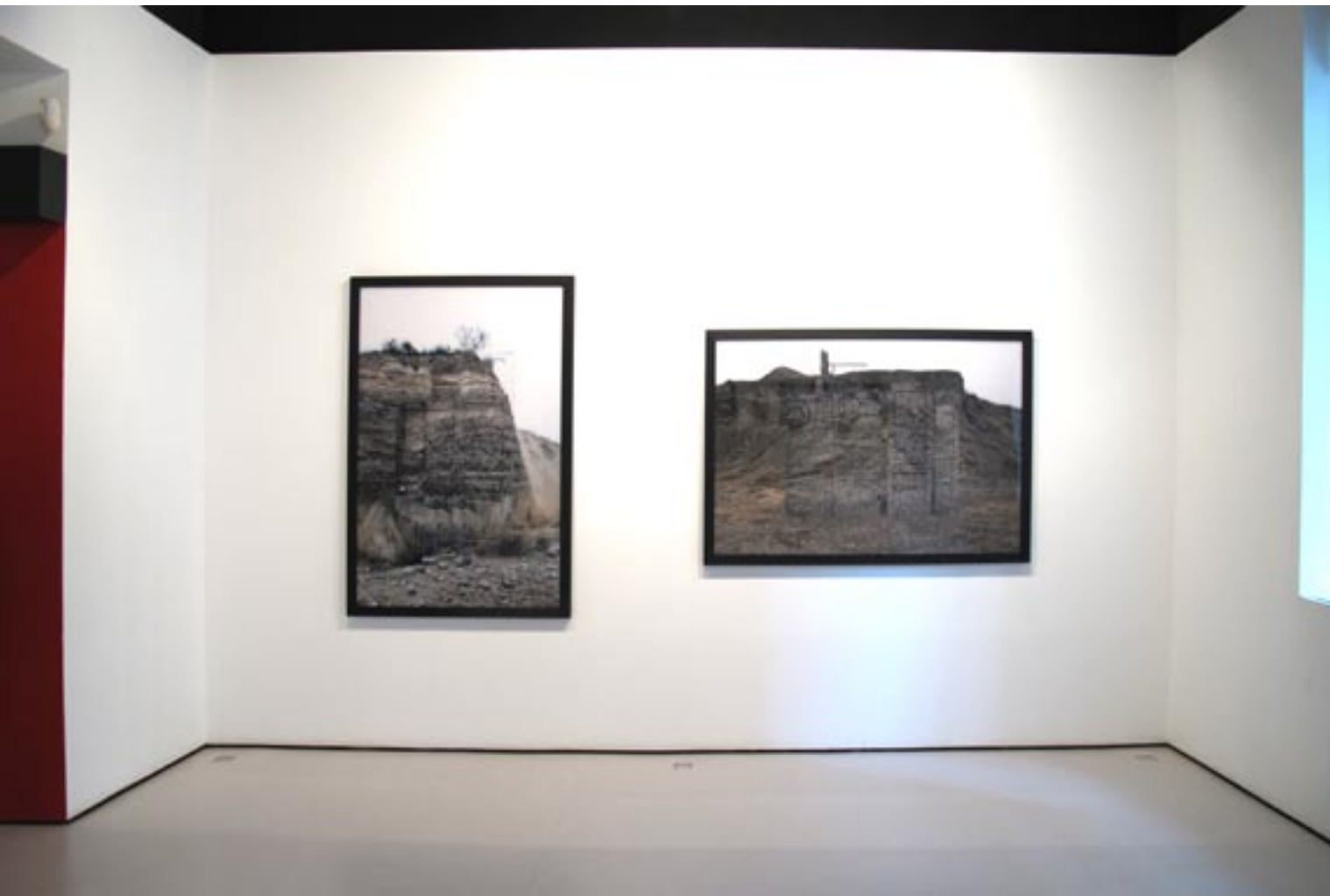
Vista sala I y pasillo.