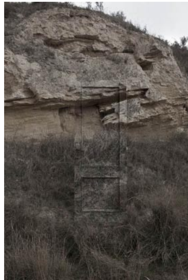
Infranqueable 02. En el límite 3. En el límite 4. En el límite 5. 2012 | 150 x 100 cm | Copia fotográfica lambda encapsulada en metacrilato y dibond.