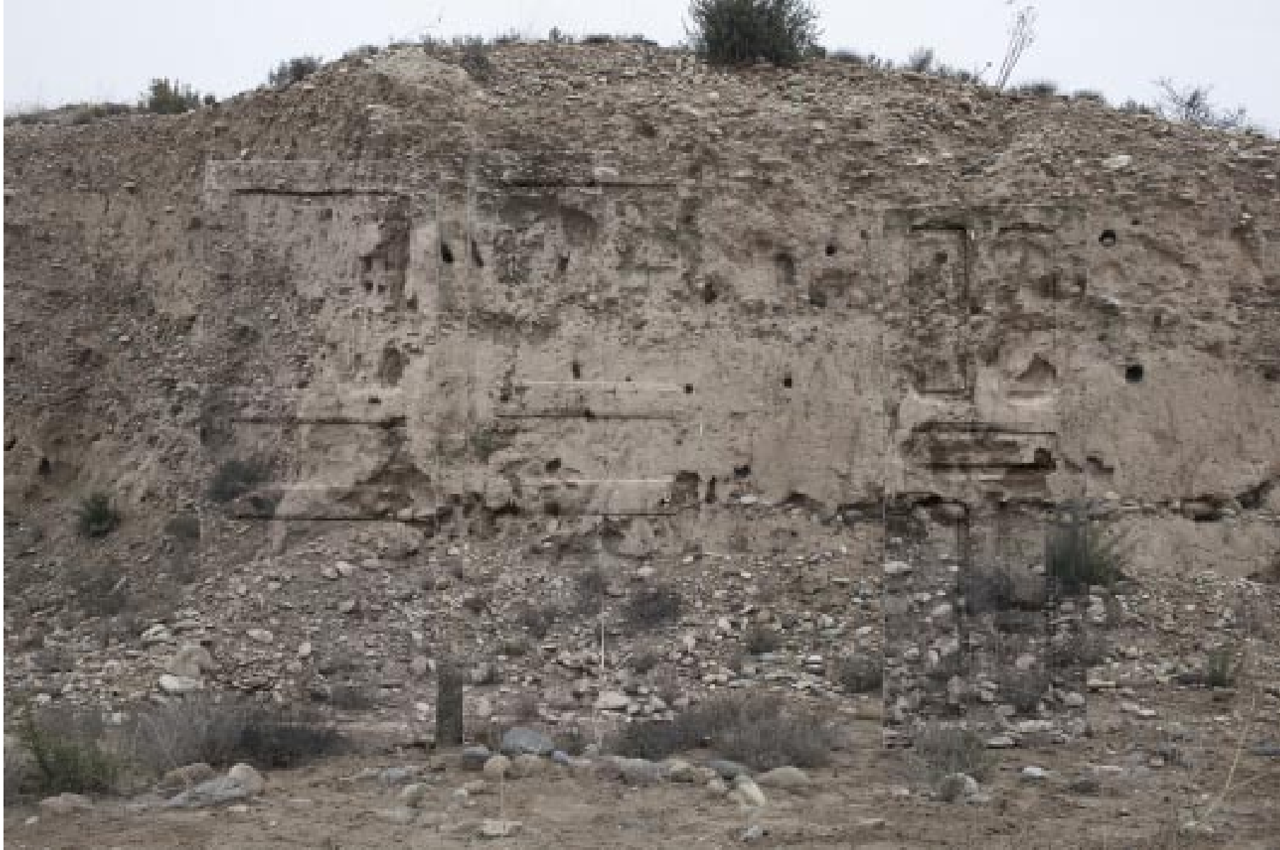
Infranqueable 02. En el límite 13. 2013 | 150 x 100 cm | Copia fotográfica lambda encapsulada en metacrilato y dibond.