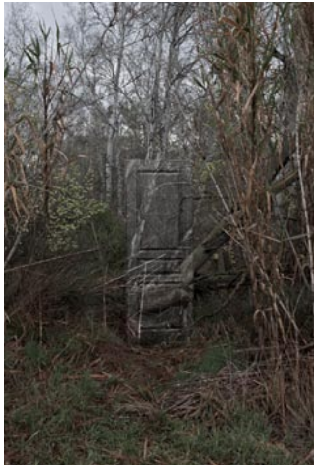
Infranqueable 02. En el límite 1. En el límite 2. 2012 | 150 x 100 cm | Copia fotográfica lambda encapsulada en metacrilato y dibond.