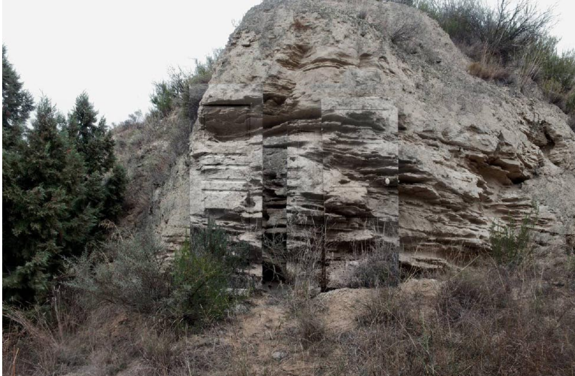
Infranqueable 02. En el límite 7. 2013 | 150 x 100 cm | Copia fotográfica lambda encapsulada en metacrilato y dibond.