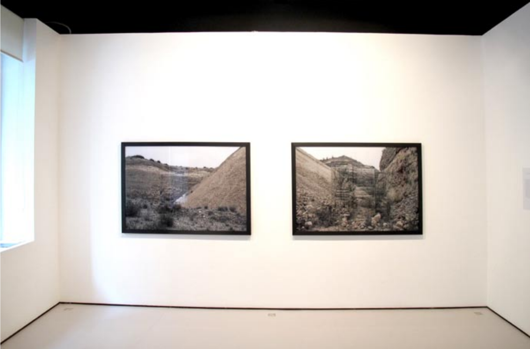
Vista sala I.