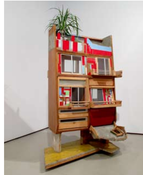
Edificio Rio 42 | 127 x 170 x 80 cm | Ensamblaje/mixta | 2011