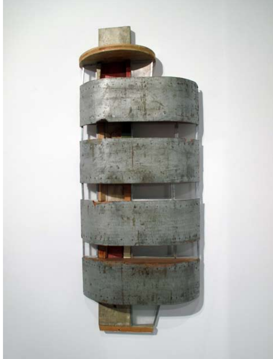
Edificio Copacabana | 41 x 110 x 15 cm | Ensamblaje/mixta | 2011