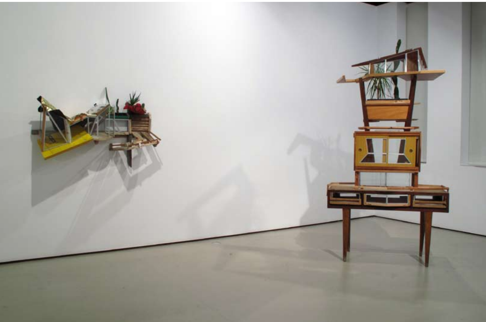
Sala III | Vista frontal