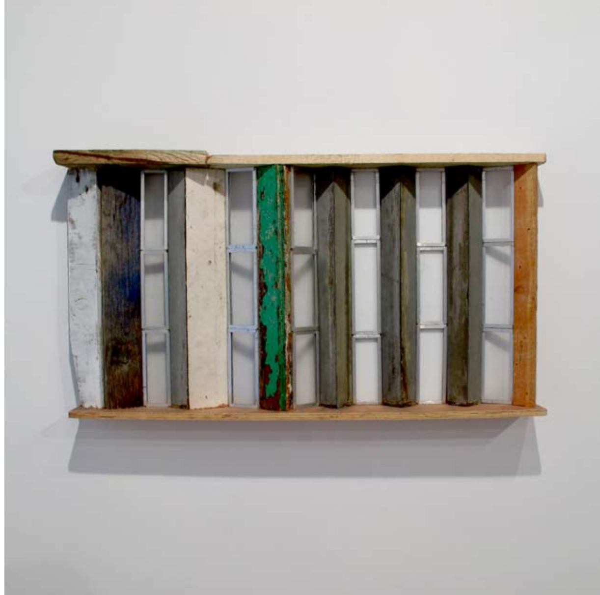
Ventanismo persiano geométrico descriptivo | 11 x 54 x 99 cm | Ensamblaje/mixta | 2012