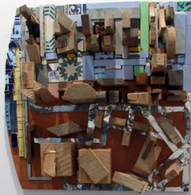
Dos barrios en el desierto poético | 17 x 55 x 57 cm | Ensamblaje/mixta | 2012