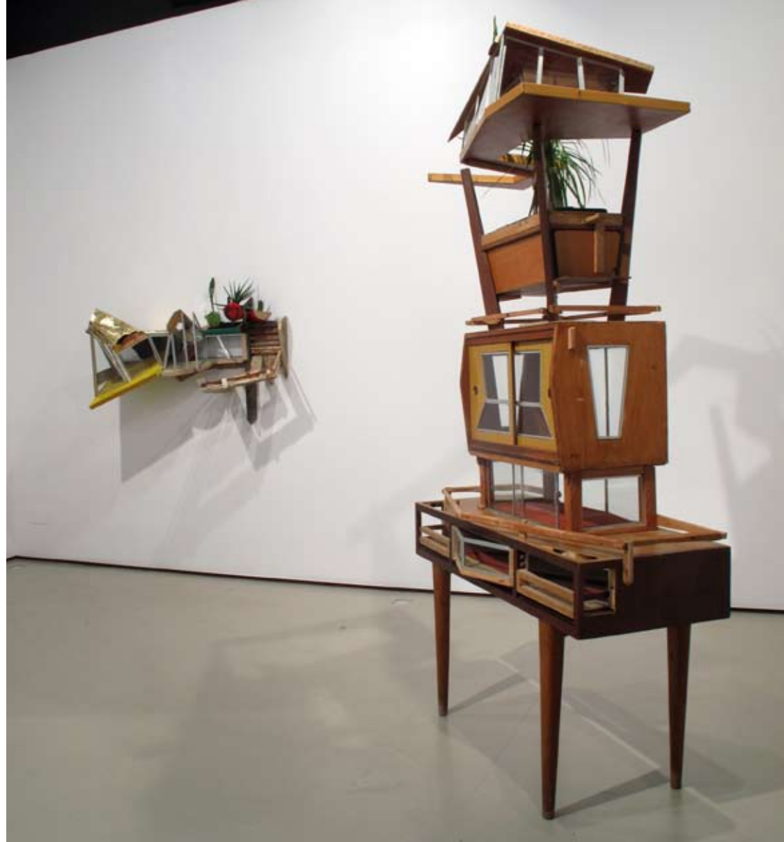
Sala III | Vista lateral