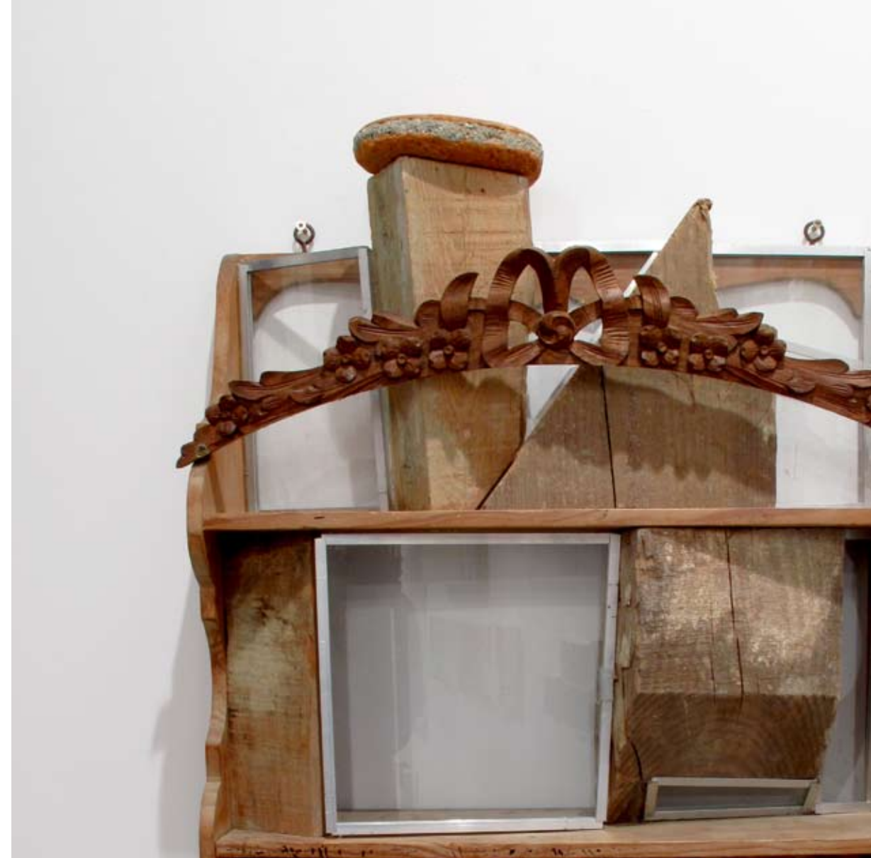
La hamburguesería vintage | 15 x 63 x 50 cm | Ensamblaje/mixta | 2012 | detalle

Hoy en día, en el Ranking mundial de Estilismos Conceptuales, el Ventanismo ocupa la posición 83245, una pena, así que necesito su ayuda, necesito el máximo de definiciones, opiniones, reflexiones... diferentes en relación a mi obra. Puede escribir aquí lo que quieras: