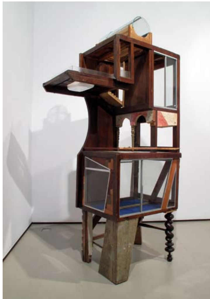
Bilongo | 95 x 173 x 50 cm | Ensamblaje/mixta | 2011