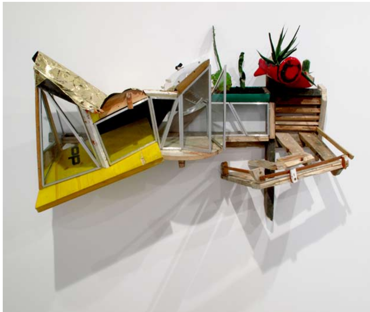
Mouradia Micaelise | 37 x 76 x 127 cm | Ensamblaje/mixta | 2012