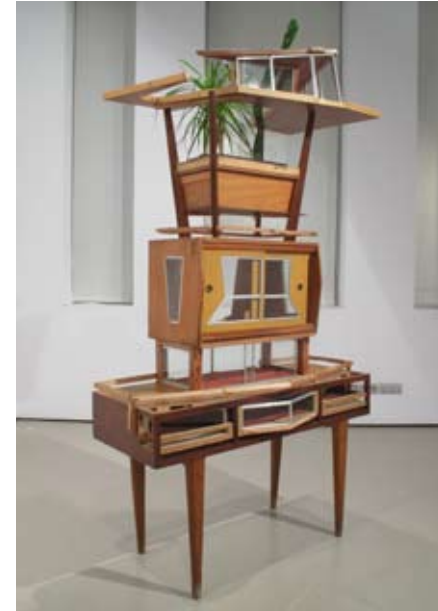
Alto Cutelo | 114 x 198 x 50 cm | Ensamblaje/mixta | 2011