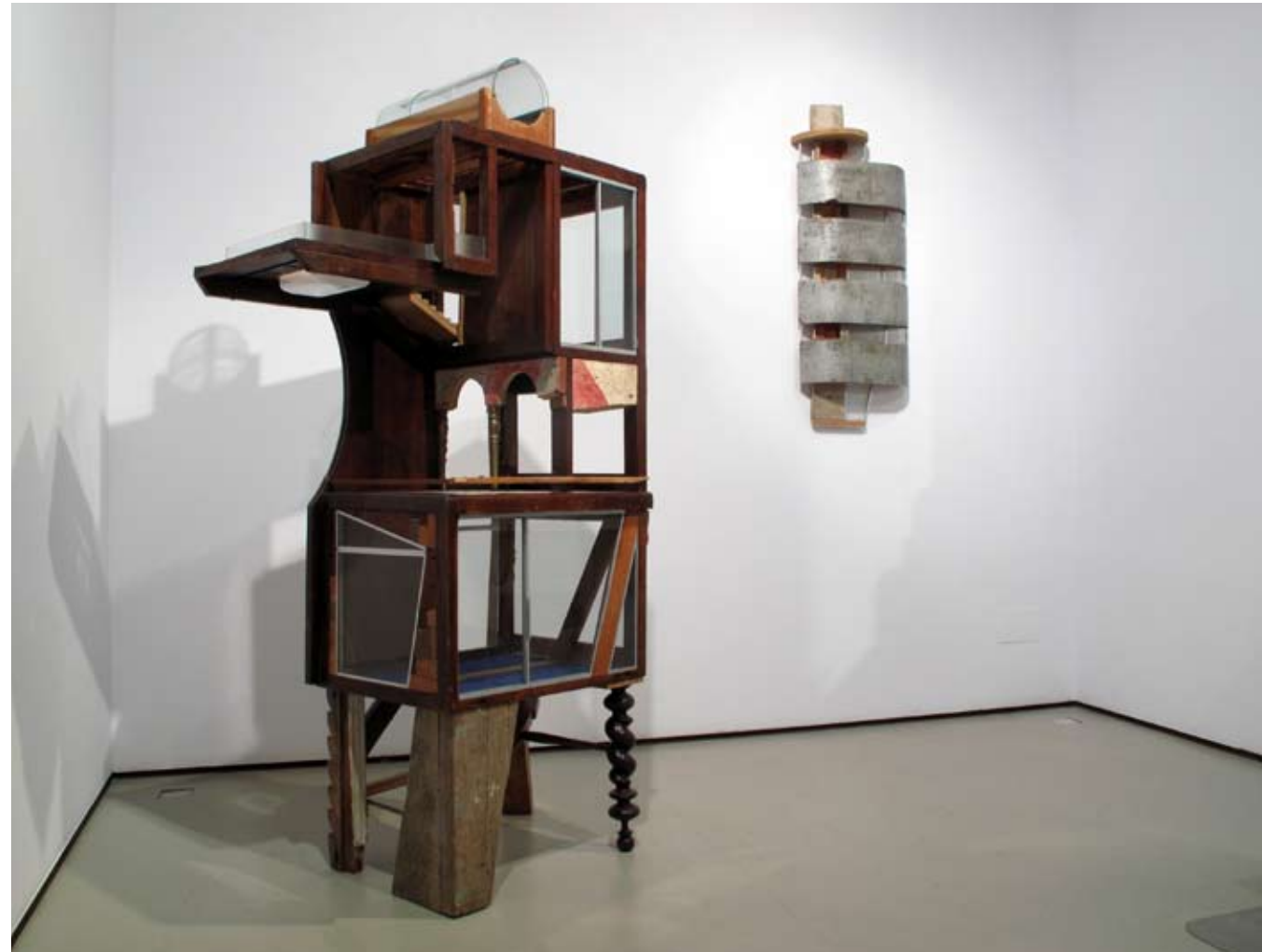
Sala II | Vista frontal