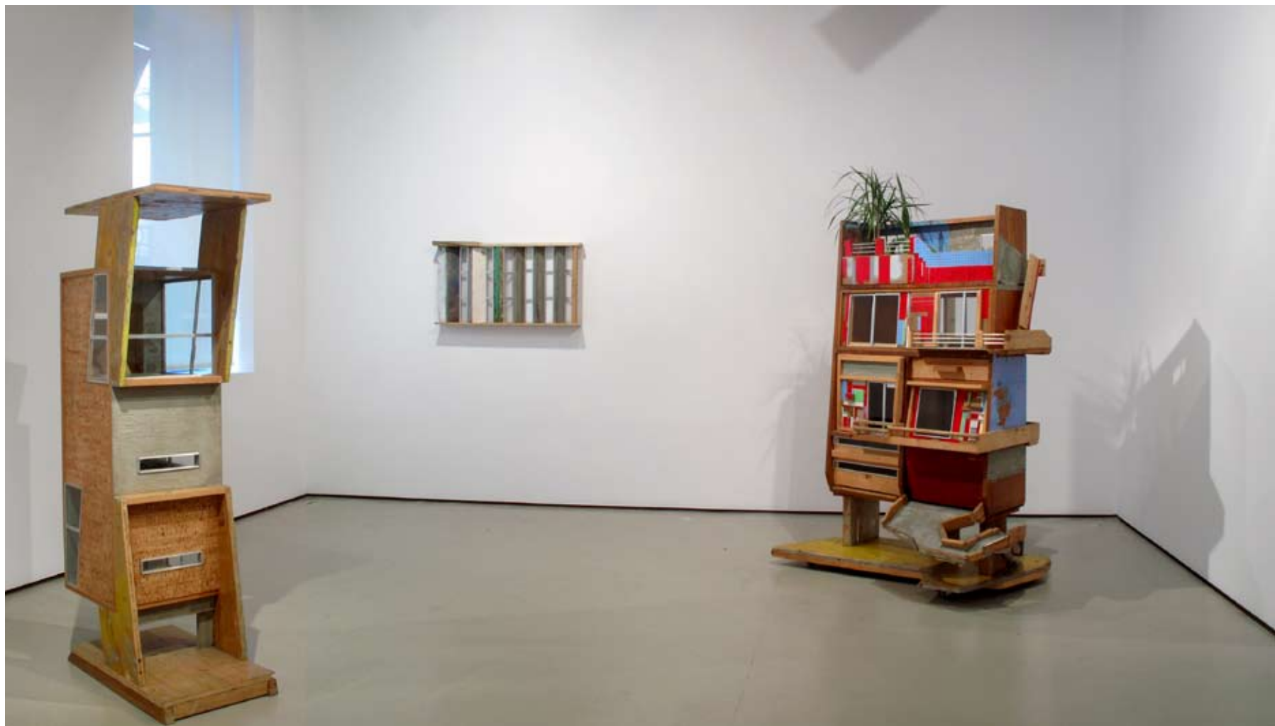
Sala I | Vista frontal