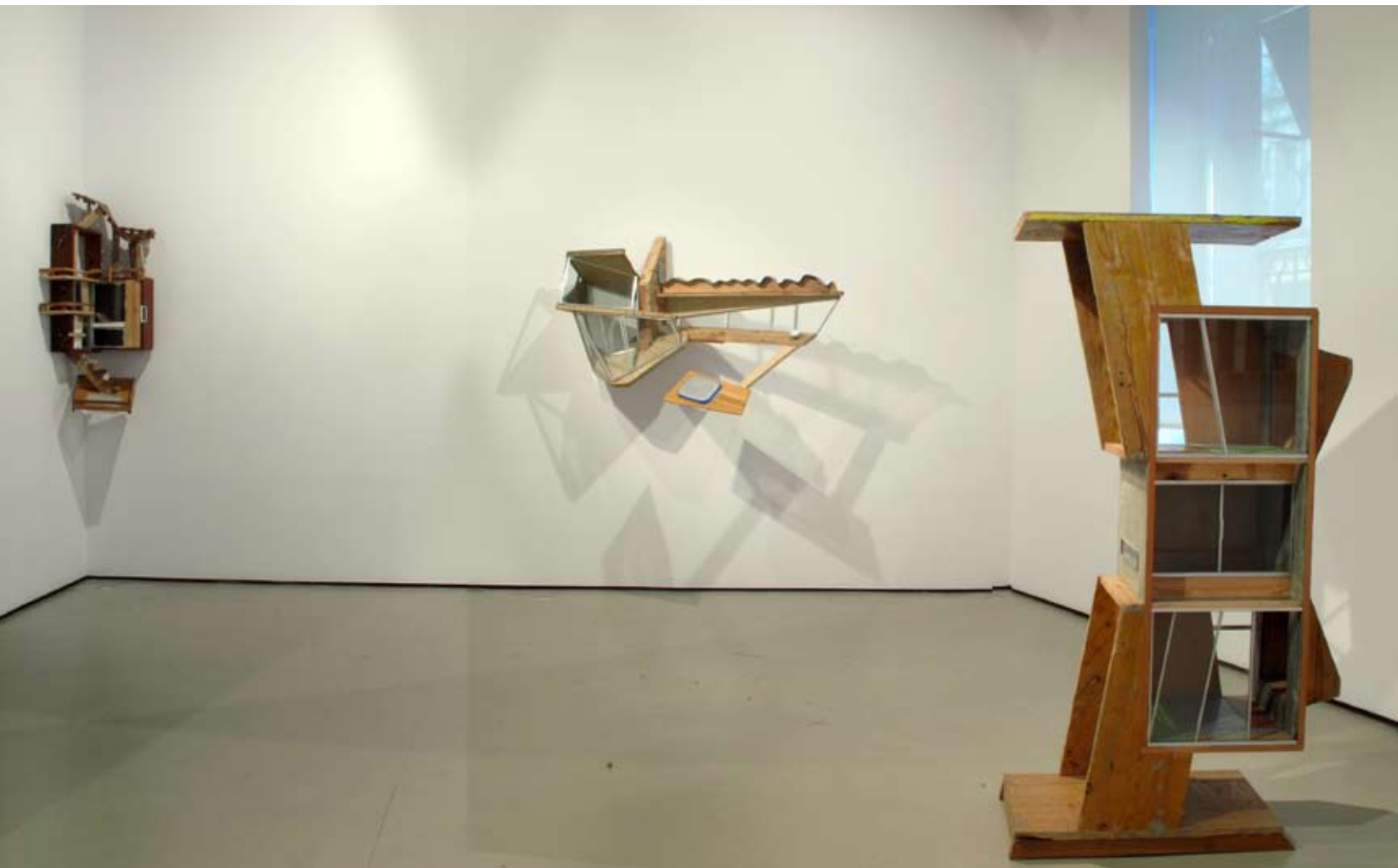
Sala I | Vista posterior