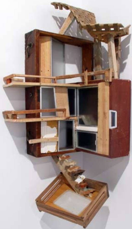
O cantón do sitio Especificúzinho | 53 x 41 x 100 cm | Ensamblaje/mixta | 2012