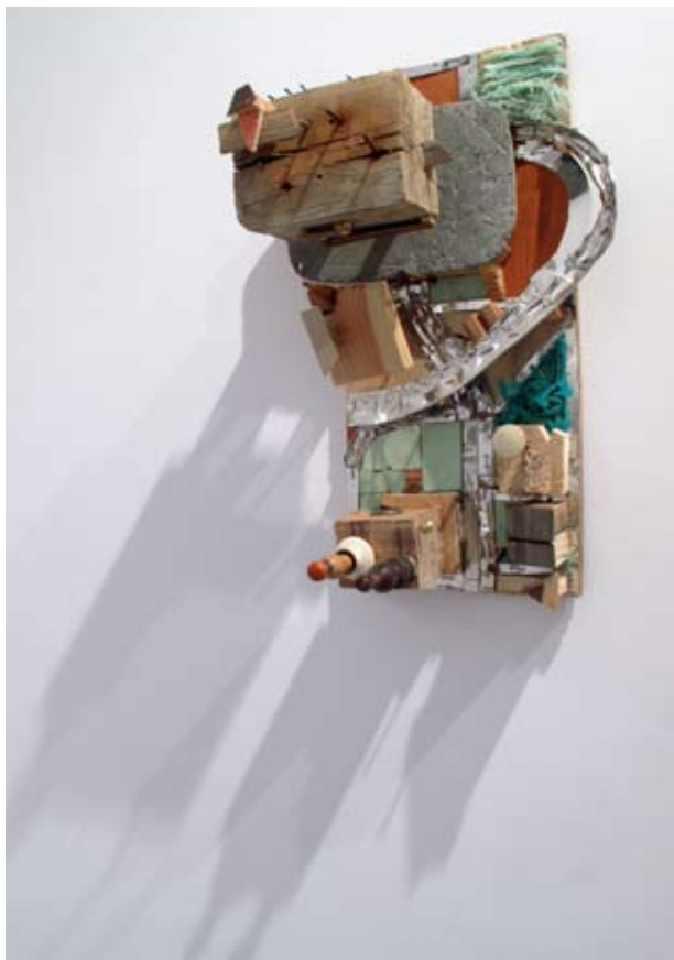
Barrio de pescadores subvencionados por la U.E. | 20 x 29 x 46 cm | Ensamblaje/mixta | 2012