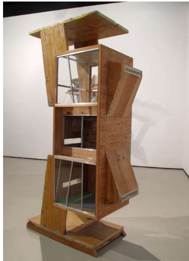
Igitavoari | 53 x 41 x 100 cm | Ensamblaje/mixta | 2012