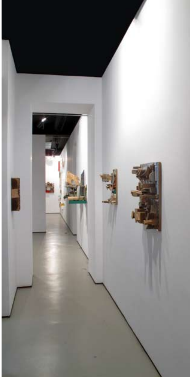
Pasillo I | Vista frontal