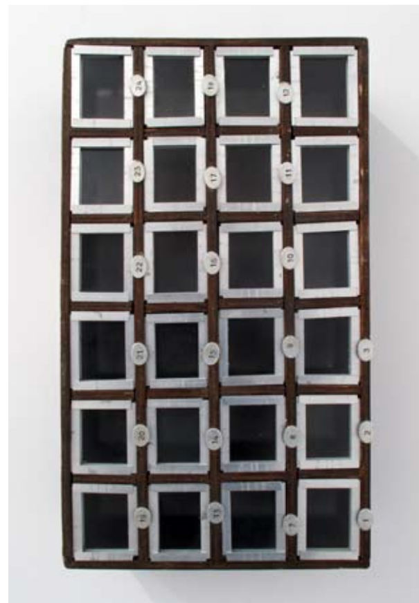
Llave en mano | 25 x 44 x 10 cm | Ensamblaje/mixta | 2012