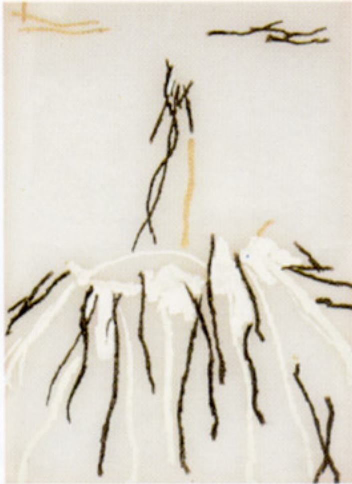
De la serie Rituales de Sanación . Técnica mixta sobre papel vegetal. 50 x 70

¡Oh sol levántate, los átomos danzan! las almas perdidas en éxtasis danzan Cada átomo, feliz o desgraciado, preso está de este son del que nada se puede decir