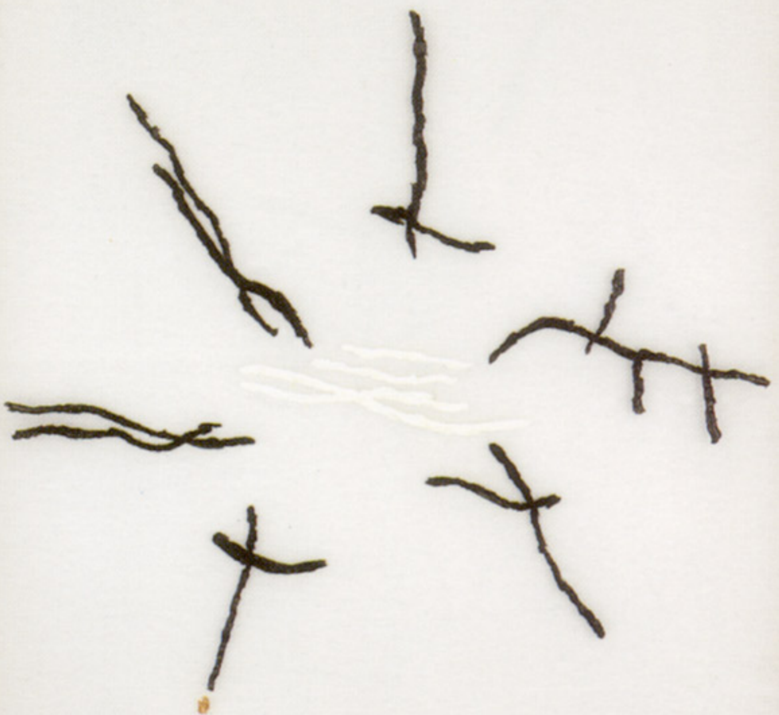
Técnica mixta sobre poliéster. 53 x 74