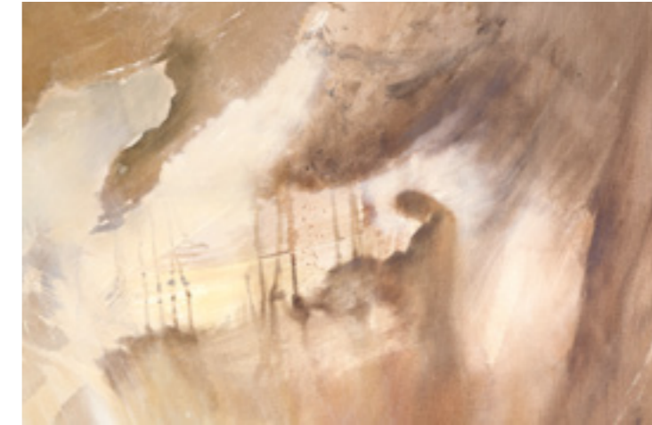
Detaylar | Details