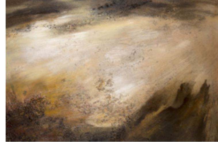
Detaylar | Details