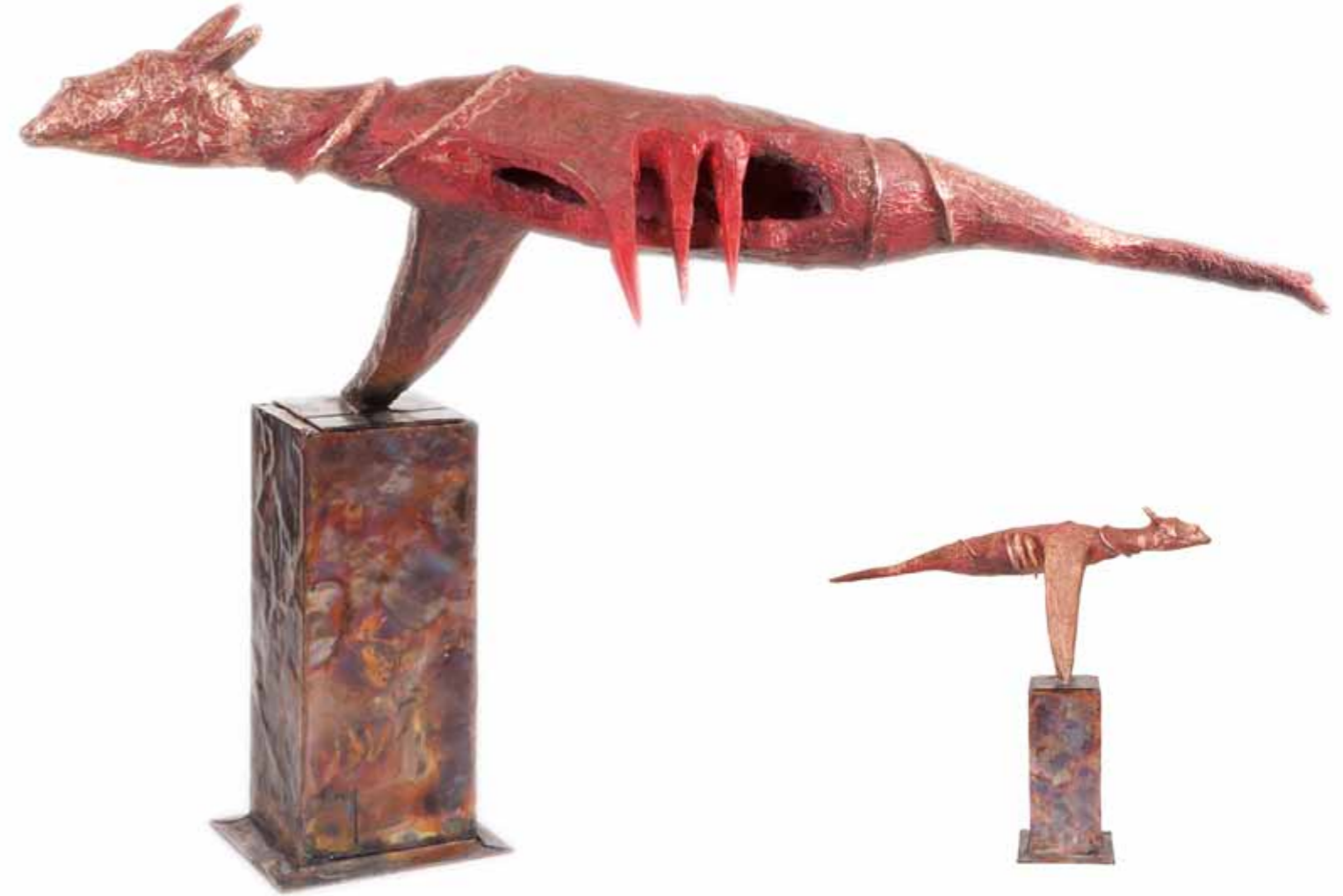
Varlığın Güncesi Diary of Existence

47x24x13 cm Kayıp mum tekniği ile bronz döküm Lost wax bronze casting 2012