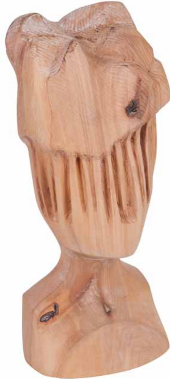
Çalılık Ruhu Brushwood Spirit

2013 Mimar Sinan Fine Arts University, Institute of Social Sciences, Sculpture Department, Master of Arts, İstanbul