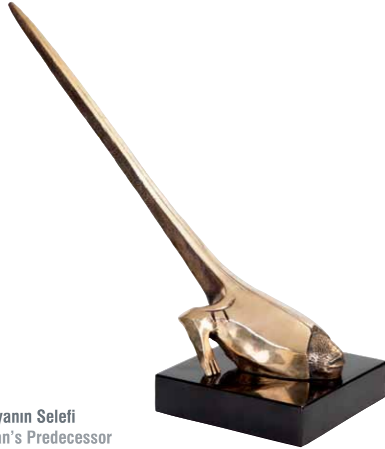
Bir Gardiyanın Selefi A Guardian's Predecessor

2004 Marmara University, Faculty of Fine Arts, Sculpture Department, Bachelor of Arts, Istanbul