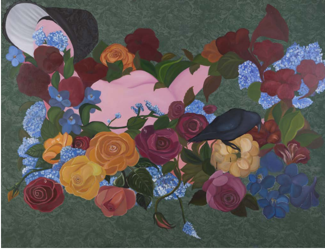
Edgar Allan Poe'nun Düşleri | Dreams of Edgar Allan Poe Tuval üzeri karışık teknik | Mixed media on canvas