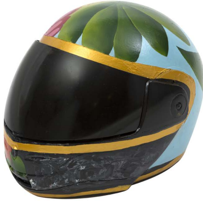
Flora'nın Dünyası | World of Flora Kask üzeri karışık teknik | Mixed media on helmet