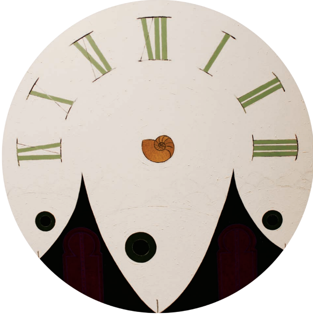
Saati Vakti Geldiđinde | When The Time Comes Tuval zeri karıŐık teknik | Mixed media on canvas