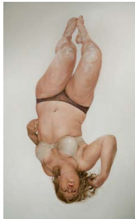
Kristi Ropeleski, White Noise , 2008, huile sur toile, 152 x 213 cm

Art Mûr 5826 rue St-Hubert Montréal Qc H2S 2L7 admin@artmur.com www.artmur.com (514) 933-0711