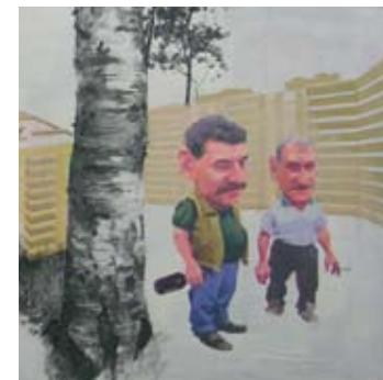
1- Vitaly Medvedovsky, Forest , 2008, huile et fusain sur panneau, 60 x 140 cm 2- Carl Osberg, Hybrid , détail, 2008, médium mixtes sur papier, 210 x 176 cm 3- Marisa Hoicka, Take a Deep Breath , 2008, huile sur toile, 40 x 53 cm 4- Megan Cameron, Untitled , 2008, huile sur toile, 122 x 91 cm 5- Courtney Burke, Two Cabins , 2008, huile sur toile, 76 x 76 cm