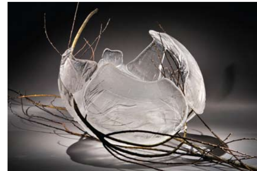
Marie-Catherine Leblond, Plus forte que toi , 2008, 46 x 87 x 52 cm, pâte de verre et branches

Vernissage : samedi le 12 juillet, de 15h à 17h Opening reception: Saturday July 12, 3 to 5 PM