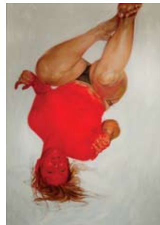
1- Kristi Ropeleski, White Noise , 2008, huile sur toile, 152 x 213 cm 2- Alex Fisher, MR City Planning , 2007, acrylique sur toile, 92 x 76 cm 3- Angela Jordan, Late at Night in a Foreign City , 2007, encre sur papier, 38 x 56 cm 4- Shannon Moynaghan, Organics #1 , 2007, acrylique sur toile, 74 x 74 cm 5- Amy Shackleton, Fuse , détail, acrylique et vernis sur toile, 137 x 155 cm