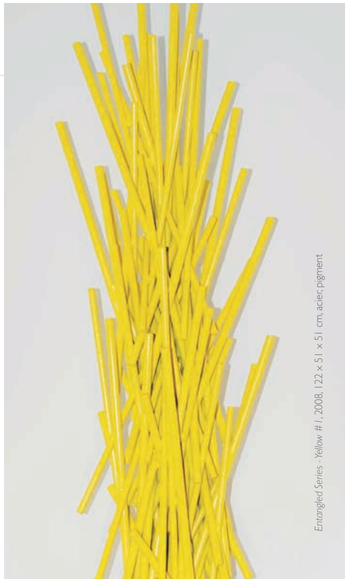
Entangled Series - Yellow #1, 2008, 122 x 51 x 51 cm, acier, pigment

Avec ses nouvelles explorations, l'artiste est à la recherche d'une communication élémentaire et universelle entre les êtres et les milieux dans lesquels ils évoluent. C'est en travaillant les formes et les couleurs dans leurs qualités visuelles immanentes et leur tactilité qu'il se sert de l'art pour transformer les espaces par le biais d'une mutation du regard.