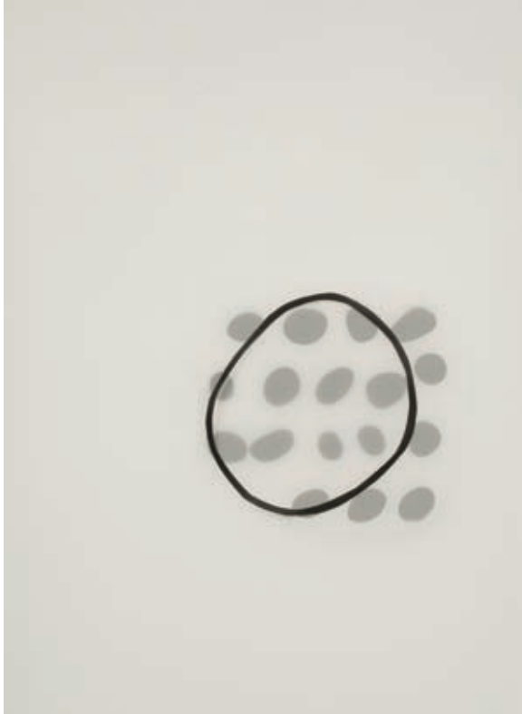
Barbara Todd, Catching Pebbles , 2007, mylar mat, coated paper, collage, 91 x 61 cm

Les œuvres présentées dans cette exposition font partie d'un projet intitulé Stone Days entamé en 2005. Pensé par l'artiste comme un « journal des jours », celui-ci consiste en une collection de 365 dessins et de 365 textes, résultat d'une pratique quotidienne qui combine une sélection de fragments d'écrits ou de bribes de paroles recueillis au fil des années et des agencements de petites pierres trouvées sur la plage. Chaque jour pendant une année, l'artiste créait une organisation différente de cailloux en fonction du texte choisi, tentant de faire émerger de ce processus des qualités de mémoire et de présence. Cette logique d'accumulation et de passage rend compte d'une réflexion sur le temps comme ancrage fondamental du sujet au monde.