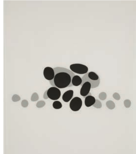
Barbara Todd, Fountain , 2008, mylar mat, papier, collage, 91 x 61 cm

Opening reception: Saturday August 23, 3 to 5 PM