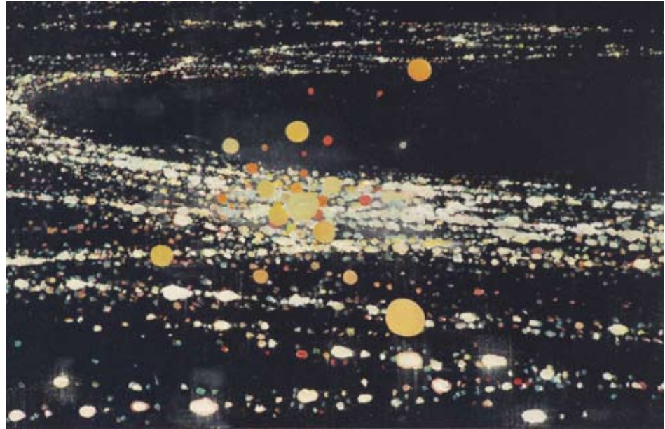
Dennis Ekstedt, Sprawl 19 , 2008, 46 x 61 cm, huile sur toile

For myself, upon viewing I am transported somewhere between my first memories of turning pages dedicated to renditions of the heavens—where the impossibility of the sheer size of a galaxy was ciphered through the accessibility of the book—and the first time I can remember flying, where the world was quickly, and unexpectedly, transformed before my eyes into a sea of configurations and possibility. In short, these paintings provoke a sense of child-like fascination and wonder within my mind, which is something that should never be forgotten within the quickness at which our world operates. There is comfort in the realization that you are one but many, and that your individual perspective operates as a singular ray of light contributing to a larger whole.