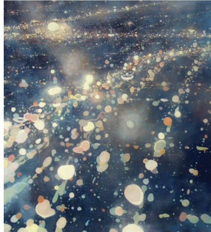
Dennis Ekstedt, Procession 1 , 2008, huile sur toile, 132 x 122 cm

Après tant de pluie, un séjour lumineux est plus que bienvenu.