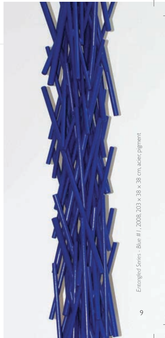
Entangled Series - Blue #1, 2008, 203 x 38 x 38 cm, acier, pigment

La plus récente production de Dark traite de ces enjeux au moyen d'installations de très grands formats. Une « monumentalisation » de son travail est d'ailleurs observée au plan de l'augmentation d'échelle et de l'envergure des constructions créées pour cette exposition. Celle-ci relève du concept de « continuité spatiale », qui se définit par une relation dynamique entre l'objet et son contexte architectural. Par un jeu entre les volumes et les vides, entre la forme, les dimensions, les matériaux et la couleur, l'artiste mobilise l'espace en suscitant chez le spectateur des impressions immédiates, se rapportant à des états physiques et psychologiques primaires.