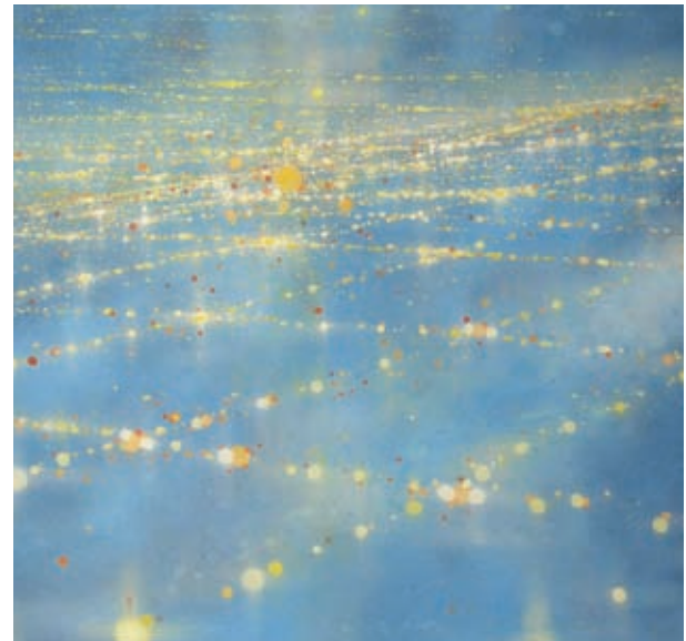
Dennis Ekstedt, Delirium , 2008, huile sur toile, 142 x 132 cm / Sprawl / 17, 2008, 152 x 188 cm, détail