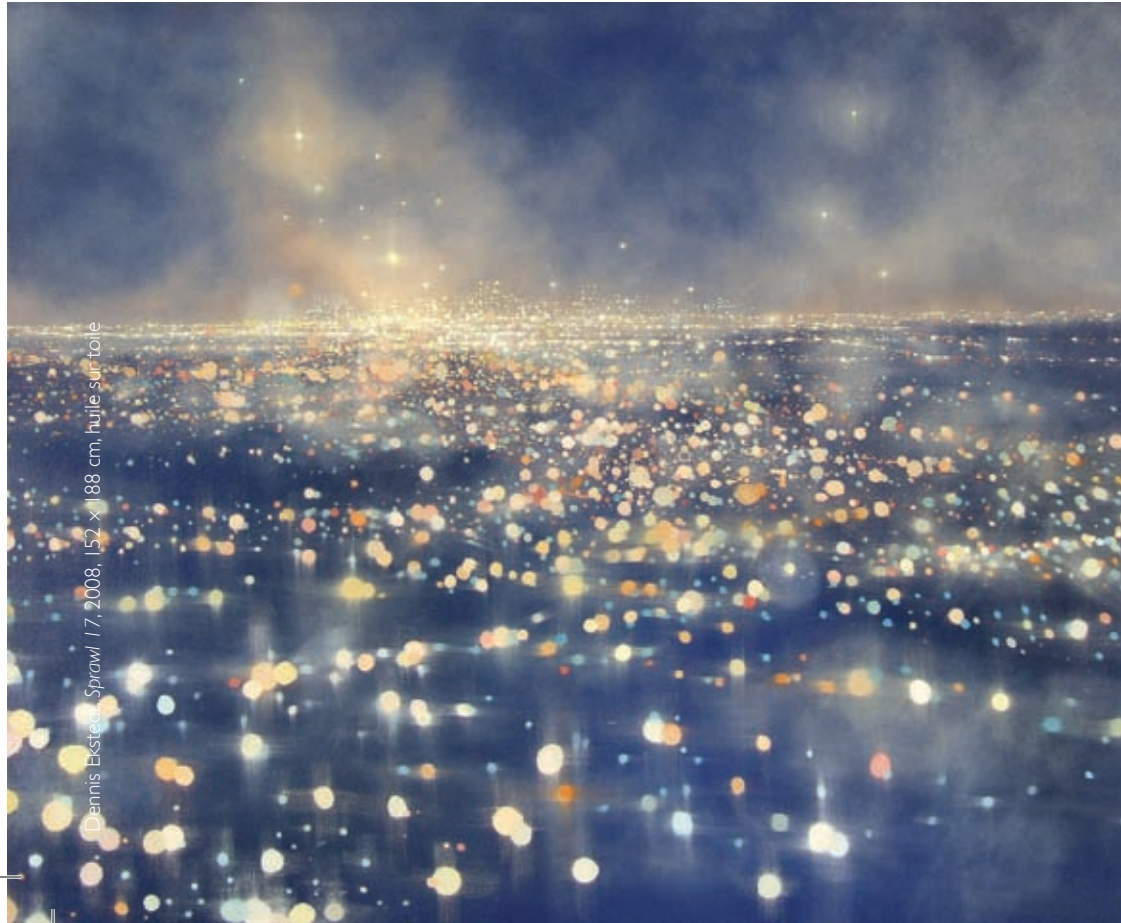
Dennis Ekstedt, Sprawl 17, 2008, 152 x 188 cm, huile sur toile

The recent works of Dennis Ekstedt explode over the tableau. The immersive black backgrounds entail a reasoning that we are somehow contained within an ever widening darkness, expanding our knowledge as sights of illuminated referents swirling in a myriad of configurations. From a proximity of distance to the up-front spectacle, our isolation is personified through individual points that amalgamate to larger entities and celestial bodies, posing questions of our place in a sublime method of abstraction.