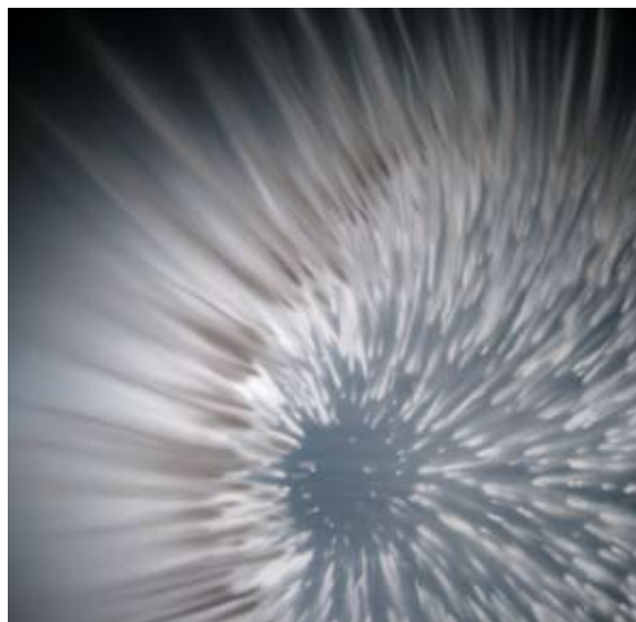
Pulse , 2008, Acrylic on transparent film in display case 29.5 x 21 x 12.5"

Art Mûr 5826 rue St-Hubert Montréal Qc H2S 2L7 artmur@videotron.ca www.artmur.com (514) 933-0711