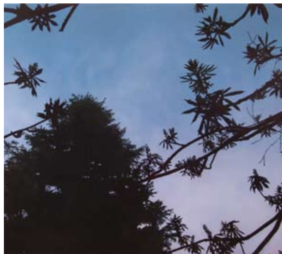
Curfew , 2008, oil on canvas 60 x 72"

Les peintures récentes de Renée Duval nous conduisent justement vers ce point, atteignant un niveau de transcendance des plus rares. Et ce, par des moyens aussi simples que subtiles. Duval s'est intéressée à l'interaction in-temporelle entre les arbres et le ciel. Lorsque j'ai vu pour la première fois ses peintures, j'avoue avoir été surpris par l'impact initial et la résonance sub-séquente d'une combinaison figure-fond à ce point littérale. Leur échelle et leur perspective éminemment physiques, combinée avec l'habileté de l'artiste à manipuler teintes et couleurs, assurent leur dynamisme. En commentant ses œuvres, l'artiste note leur vraisemblance; le réalisme pur, que permet fidélité à la nature et finesse technique, définit très certainement une part essentielle de sa démarche. Si l'art de Duval rappelle presque immédiatement celui d'autres peintres réalistes phénoménologiques, tels Jack Chambers et Antonio Lopez Garcia, il n'est pas sans rappeler les liens unissant ce type de réalisme perceptuel et d'autres pratiques artistiques, tout particulièrement dans son contrôle nuancé la lumière. Devant sa peinture, notre esprit, notre corps et notre regard sont sollicités tout à la fois; l'expérience est semblable à ce que nous pouvons éprouver devant une œuvre de James Turrell ou de Robert Irwin, par exemple.