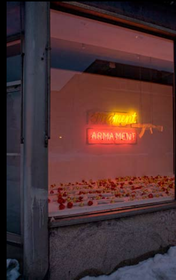
Ornament/Armament , 2007, neon, glass, plaster, decorative ornaments, variable dimensions