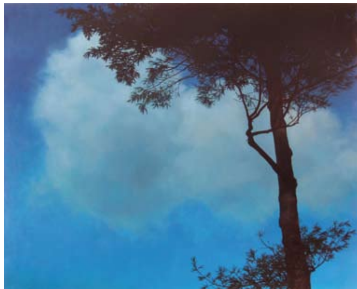
Transmission , 2008, oil on canvas, 60 x 72"