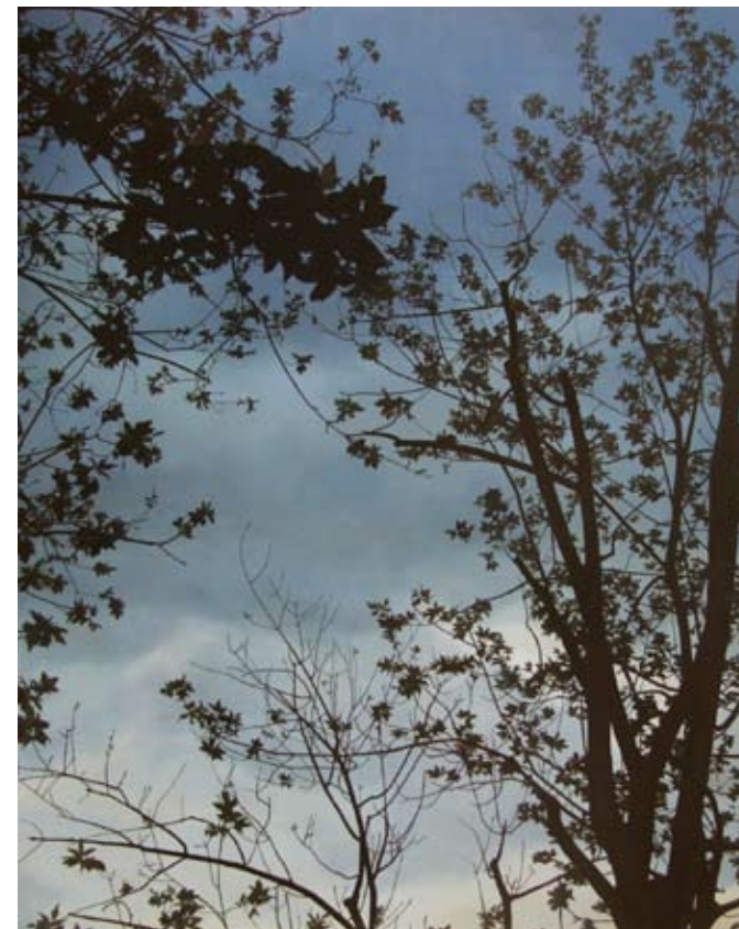
Ever , 2008, oil on canvas 66 x 84"