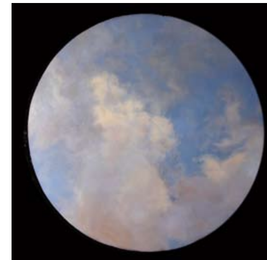
Philoscope , 2008, oil on canvas 66 x 68"