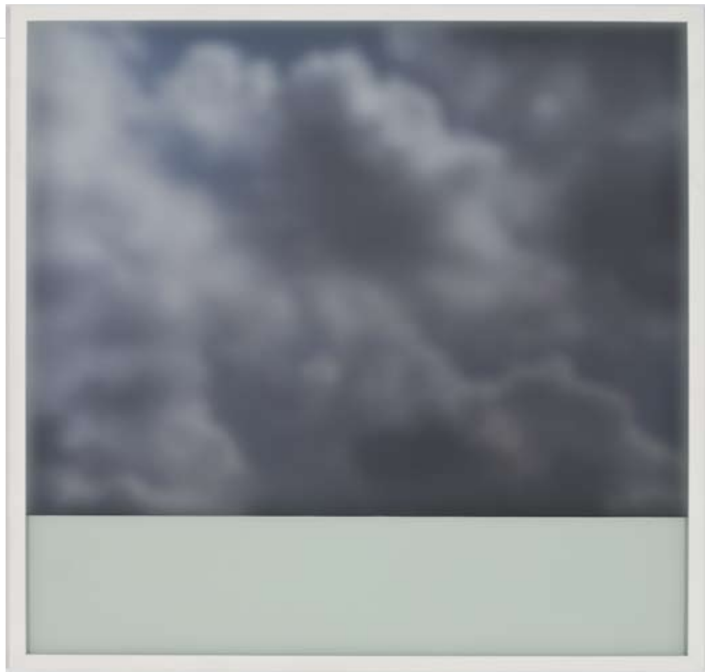
(Depth of) field I , 2008 tirage numérique sur papier photographique, émail et verre givré 76 x 80 cm

It is within the locality of the dream where we are at once sentient of ourselves within a multitude of reflections. The momentary awareness of self reveals transitions between those subliming resonances of reality and our want of an unbiased infinite. The sky and water may beckon us, yet we do not fully comprehend why or how we could be within both at once, or better, everywhere within everything at once, to perhaps know the presence of omniscience.