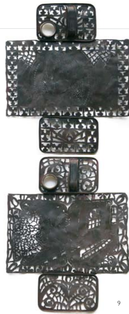
Moral Mush, Judgement Jingle, 2007 Bidons d'essence découpés au plasma, 44 x 34.5 cm ch.

2002 Art Gallery of Nova Scotia, Fabricate , Halifax, Nova Scotia, Canada.