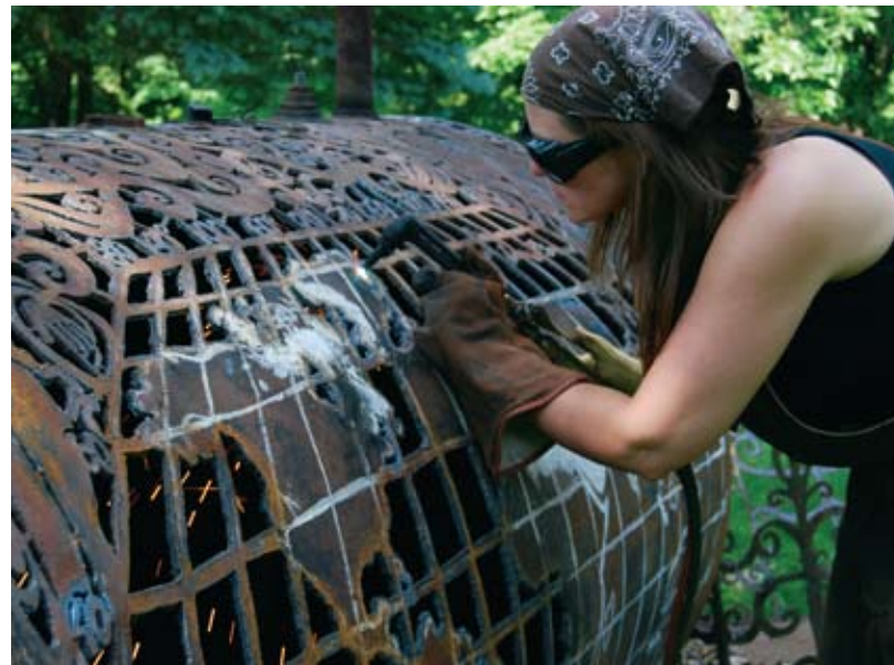
Oil Tank Map of the World , 2007, réservoir d'huile oxydécoupé, 152 x 122 cm (idem, page de gauche)

Avec la série Sweet Crude , des barils de pétrole éventrés se trouvent au mur et sont transfigurés en cartes géographiques, arborant des détails et des motifs étrangers à leur nature. Les oppositions s'y mêlent : cartographie et