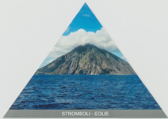
STROMBOLI - EOLIE