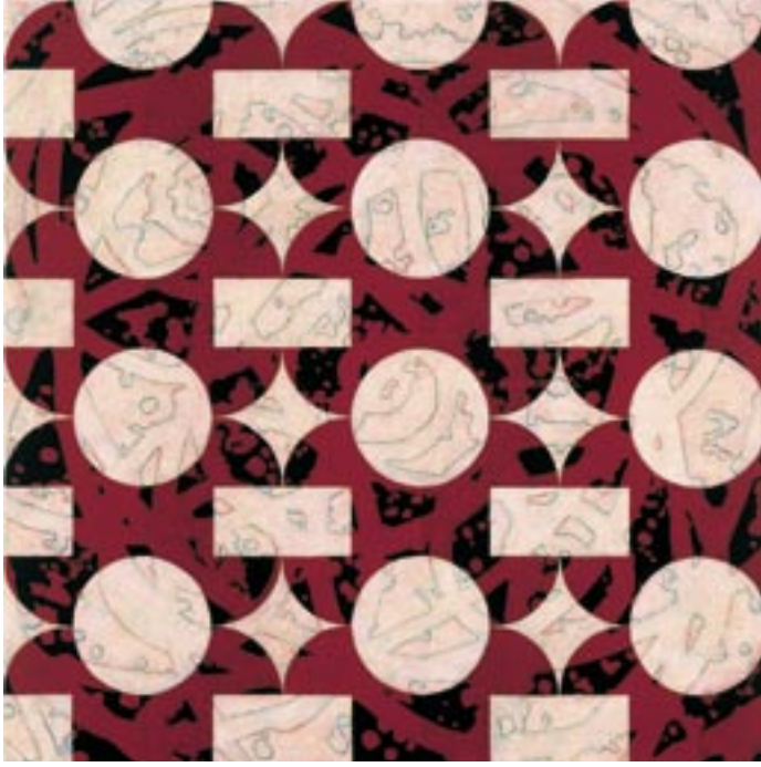
Stacked in Time, 2002 Oil, acrylic and alkyd on canvas, 33 x 33 in.

مكدسة في الموعد، 2002 ألوان زيتية، واكليك، وفلر شبه القلوي alkyd على قماش الرسم الزيتي، 83, 8 × 83, 8 سم