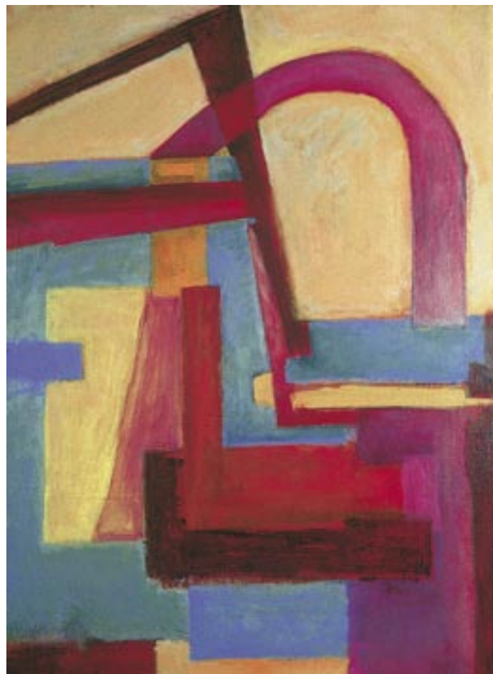
Contemplating the Mediterranean, 2005 Acrylic on canvas, 36 x 26 in.

حرارة، 2005 ألوان الأكريليك على قماش الرسم الزيتي، 4، 91، 66 سم