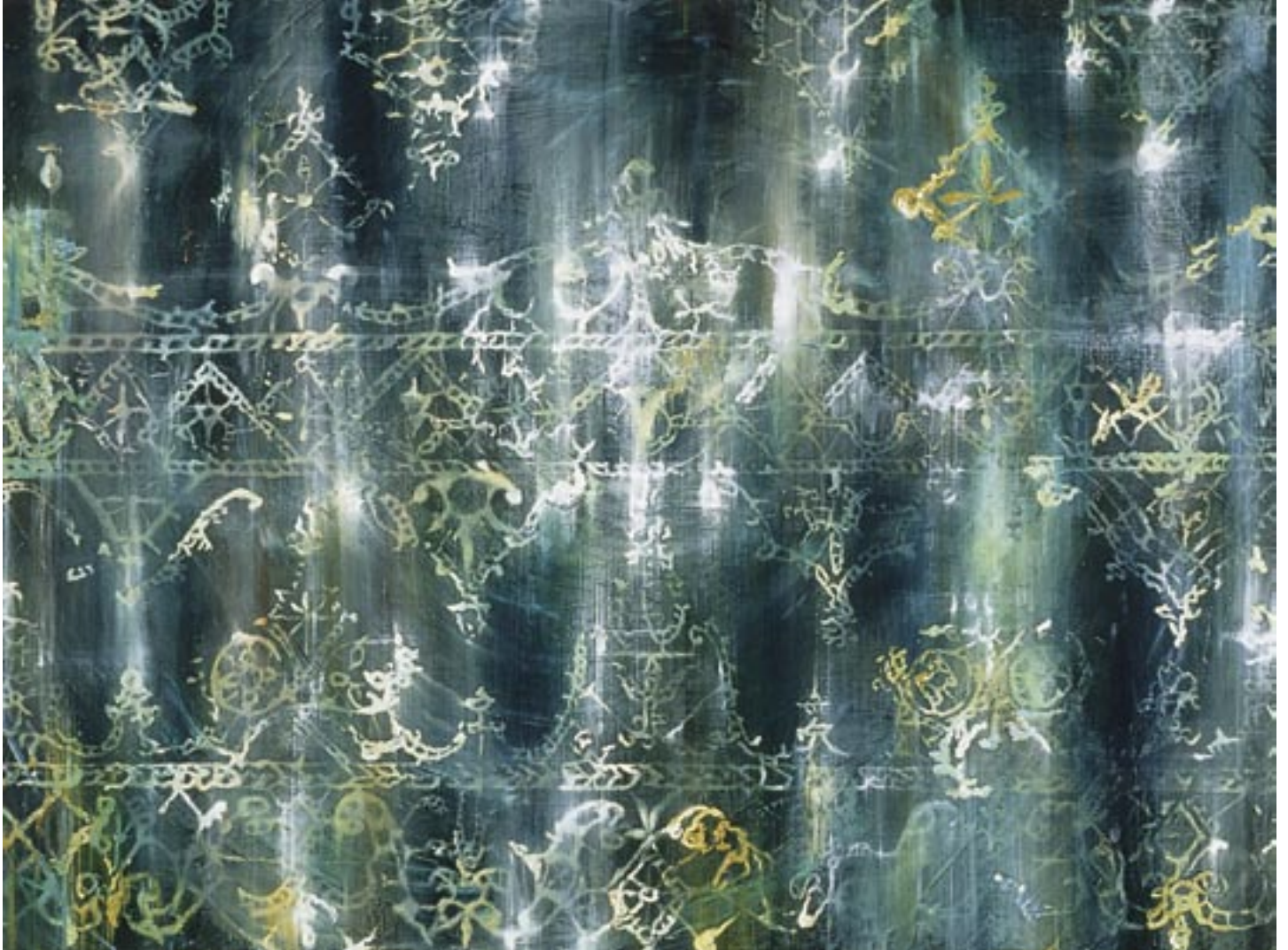
Fugue 16 , 1994

Oil on canvas, 54 x 72 in.