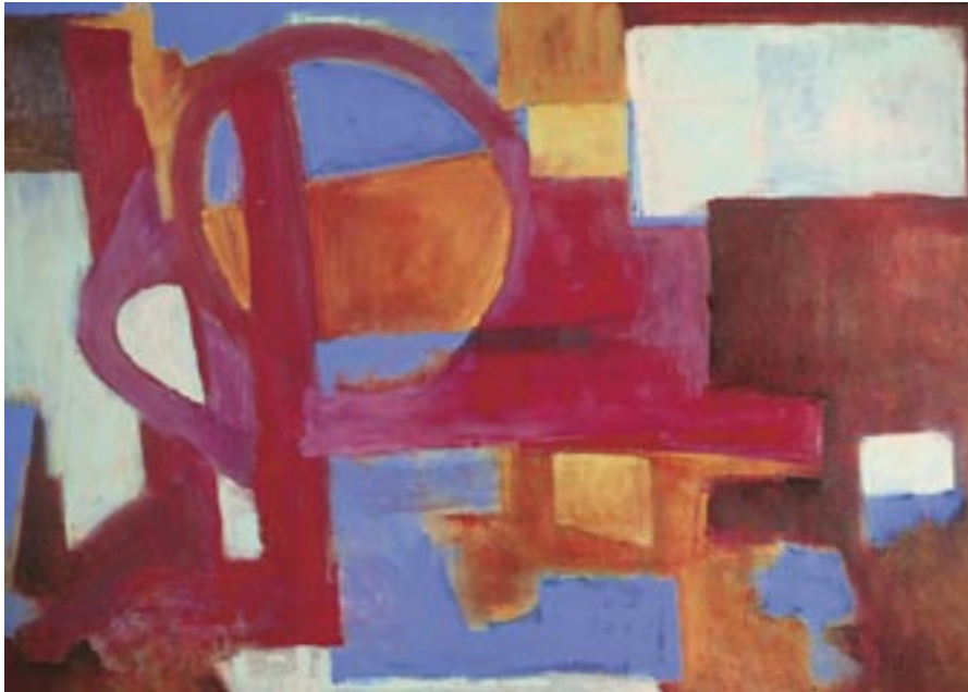
Red Redondo , 2005