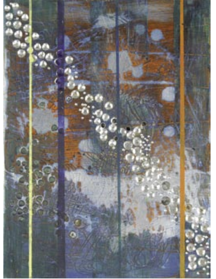
Strata 64, 2006

أكريلك وشمع على لوحة ألومنيوم، 3، 20 × 15 سم بموافقة الفنانة، سيلفر سبرينغ، ميريلاند