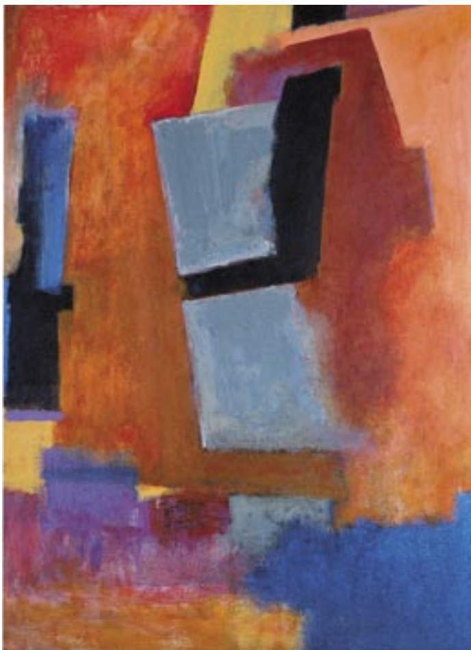
Heat, 2005 Acrylic on canvas, 36 x 26 in. Courtesy of the artist, Elmhurst, New York

حرارة، 2005 ألوان الأكريليك على قماش الرسم الزيتي، 4، 91، 66 سم بموافقة الفنان، إيلمهيرست، نيويورك