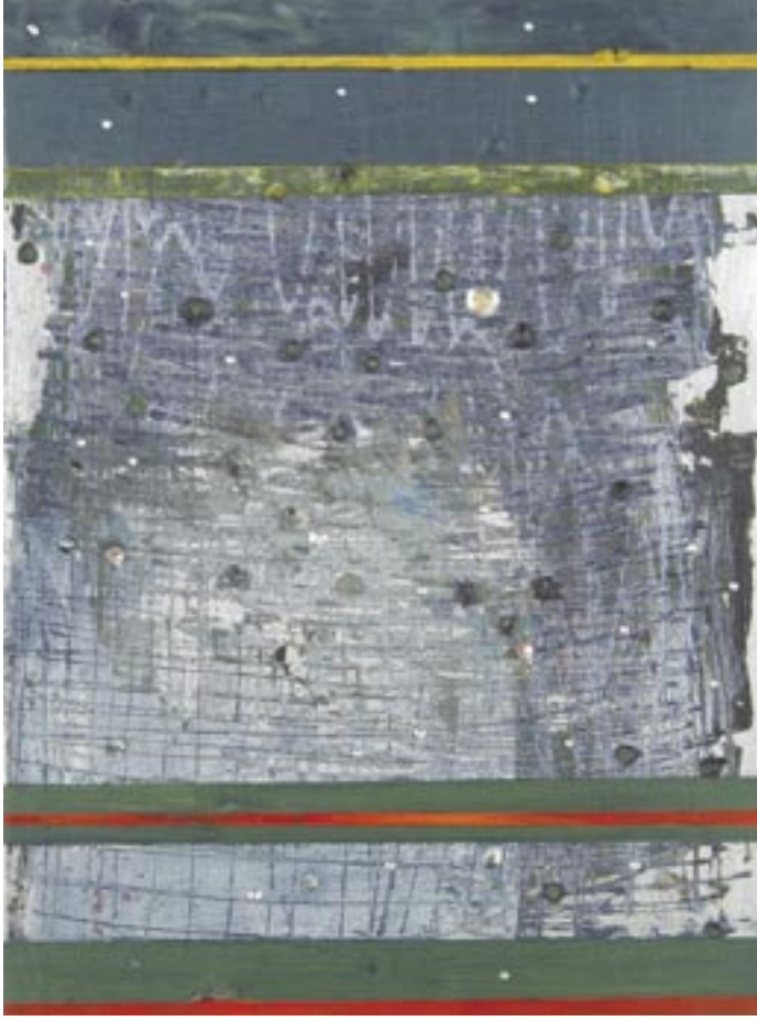
Strata 61, 2006

Acrylic and wax on aluminum panel, 8 x 6 in.