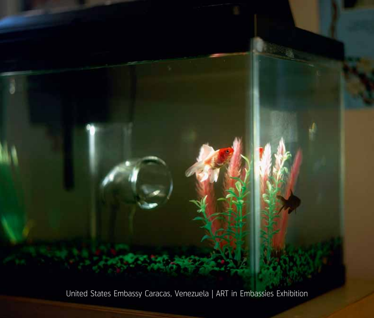
United States Embassy Caracas, Venezuela | ART in Embassies Exhibition