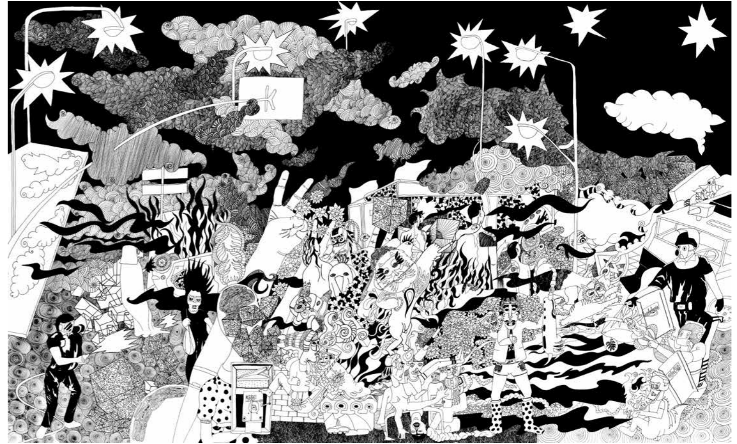
"Her Yer 1/1", 145x90 cm. Kağıt üzerine çini mürekkebi. 2014 "Every Where 1/1", 145x90 cm. Indian ink on paper. 2014