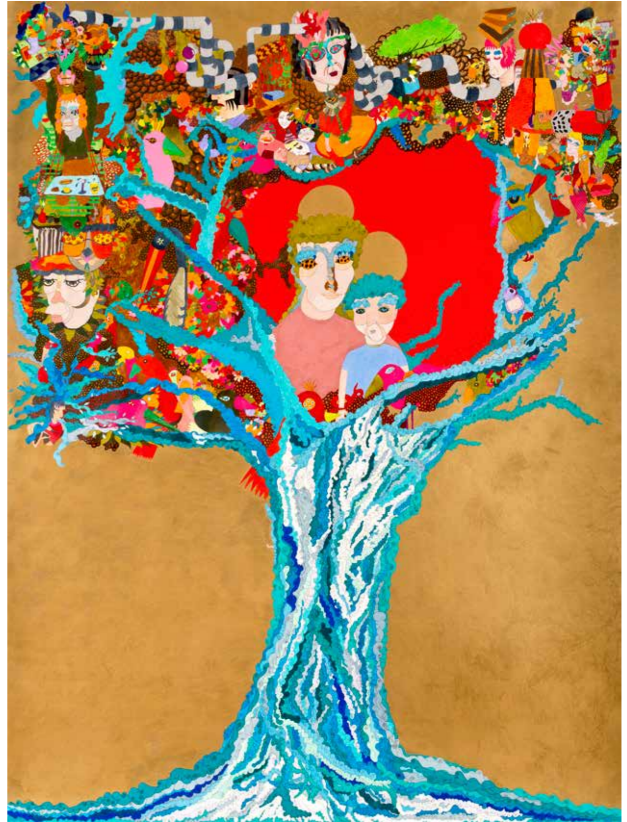
"Ağaç". 147 x 191 cm. Kağıt üzerine kuru boya, kalem. 2013 "The Tree". 147 x 191 cm. Dry paint on paper. 2013