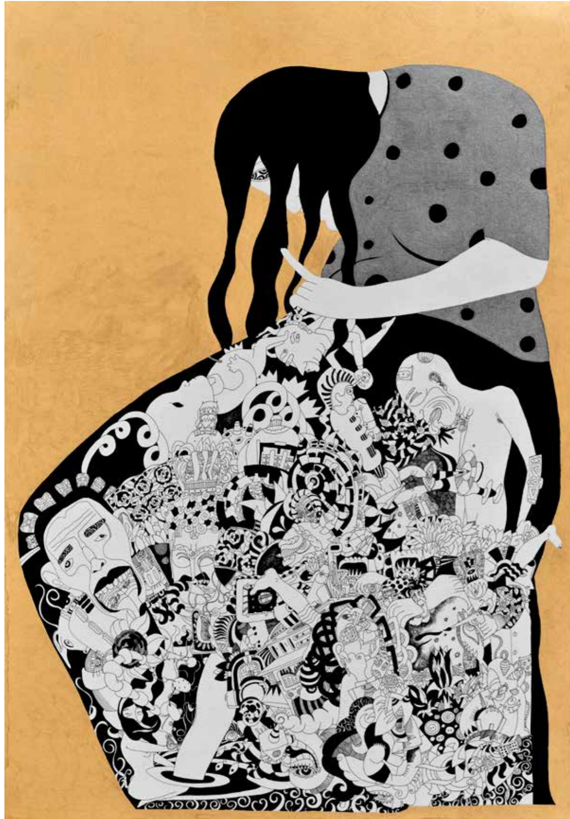
"Hamile", 70 x 10 cm. Kağıt üzerine çini mürekkebi. 2014 "Pregnant", 70 x 10 cm. Indian ink on paper. 2014