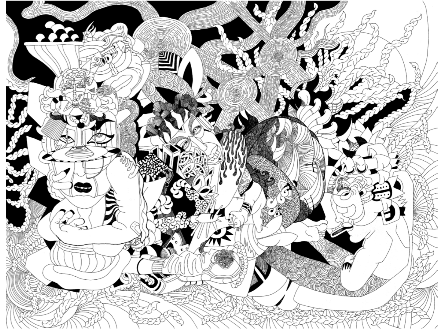
'Terzi', 255 x 150 cm. Kağıt üzerine akrilik kalem. 2014 'Tailor', 255 x 150 cm. Acrylic pen on paper. 2014