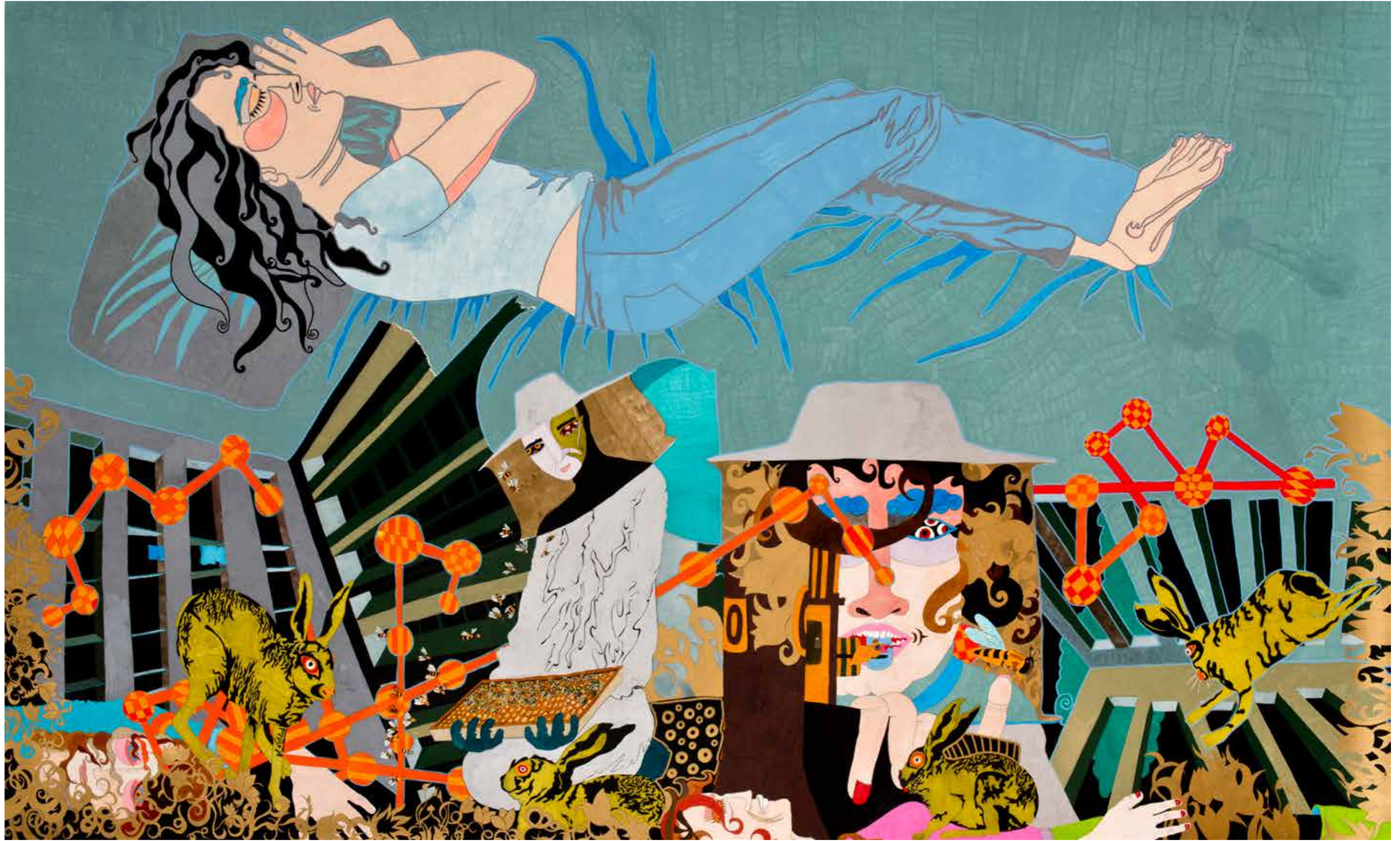
"Tasadüf". 255 x 150 cm. Kağıt üzerine akrilik kalem. 2013 "Coincidence". 255 x 150 cm. Acrylic pen on paper. 2013