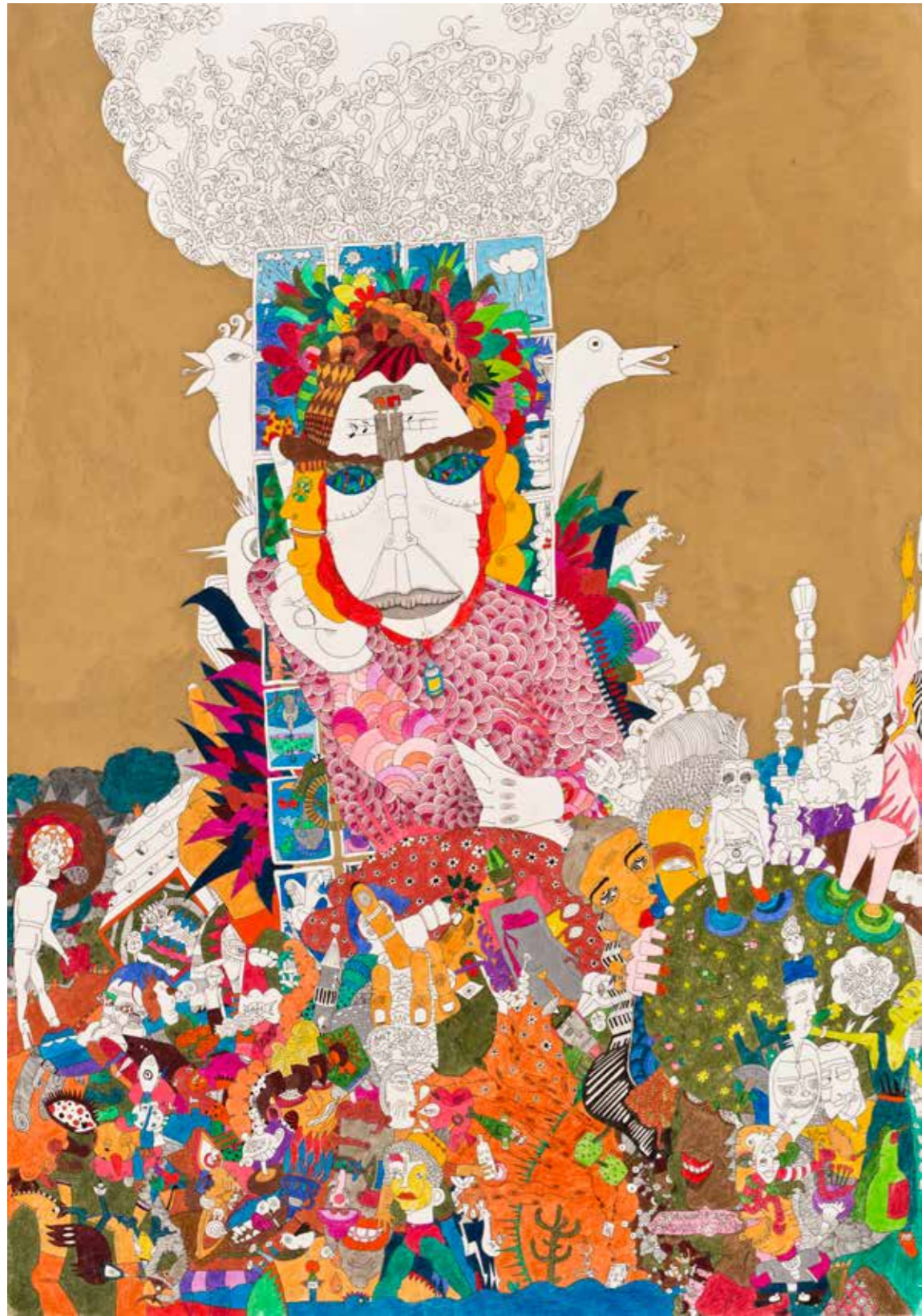
"Cadı". 70 x 100 cm. Kağıt üzerine kuru boya. 2011 "The Witch". 70 x 100 cm. Dry paint on paper. 2011