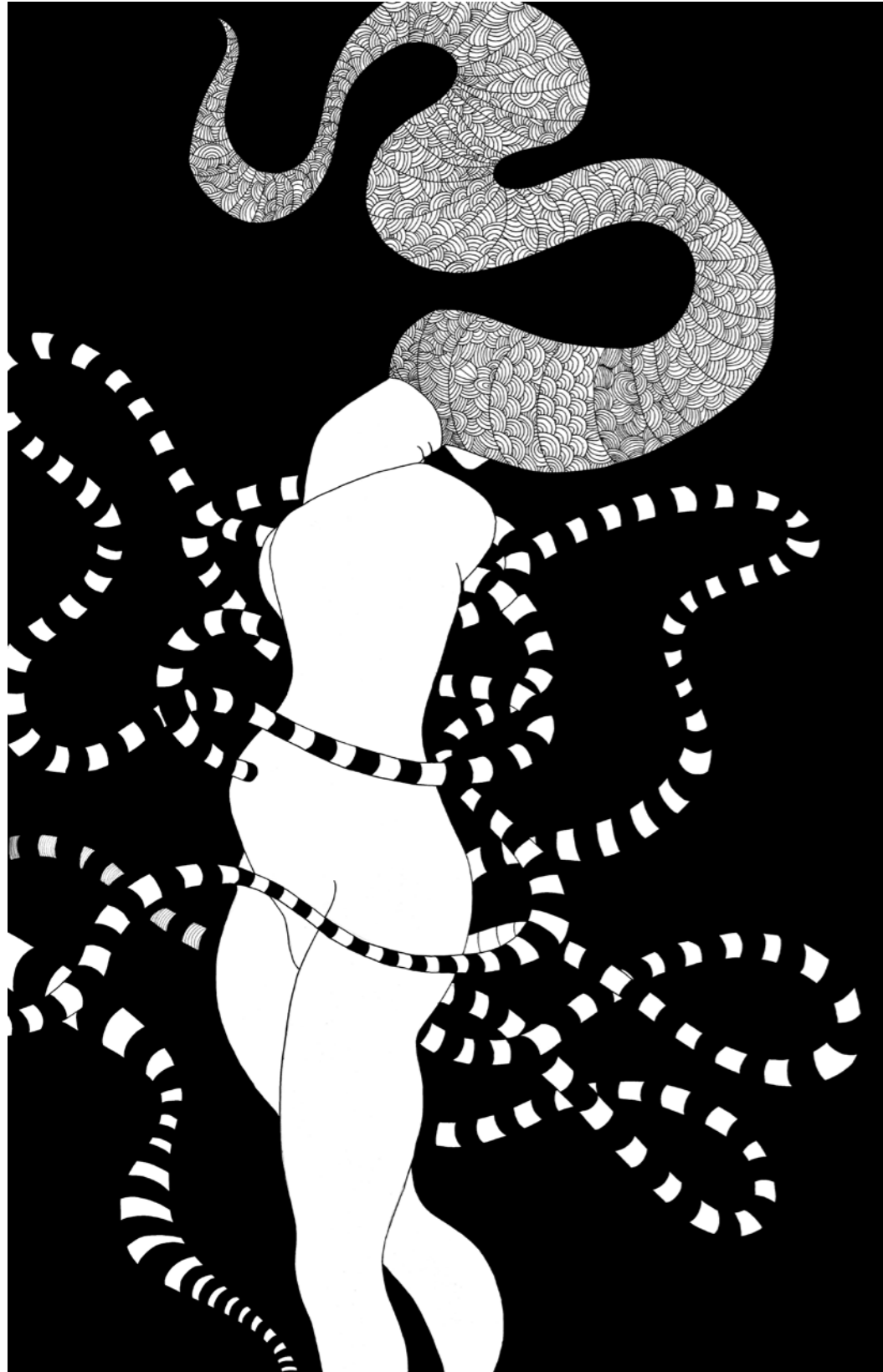
"Sarmal". 135 x 88 cm. Kağıt üzerine çini mürekkebi. 2014 "Scroll". 135 x 88 cm. Indian ink on paper. 2014