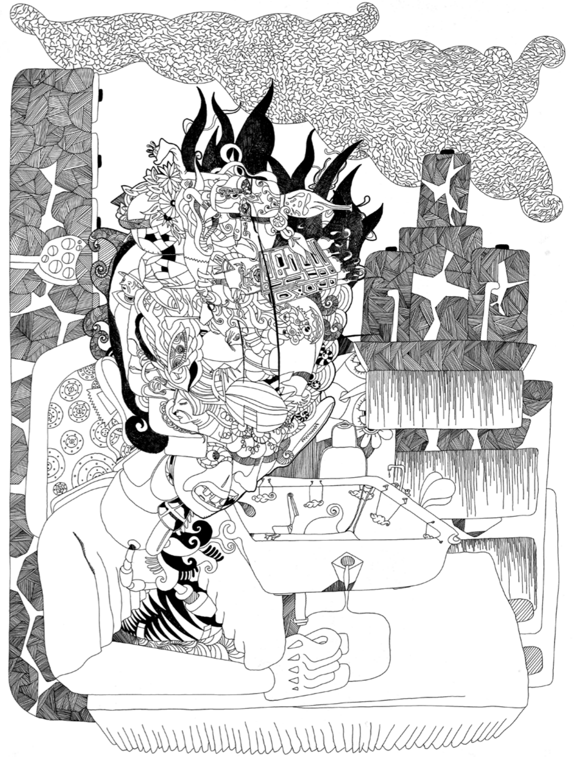
"Portre". 65 x 50 cm. Kağıt üzerine çini mürekkebi. 2014 "Portrait". 65 x 50 cm. Indian ink on paper. 2014