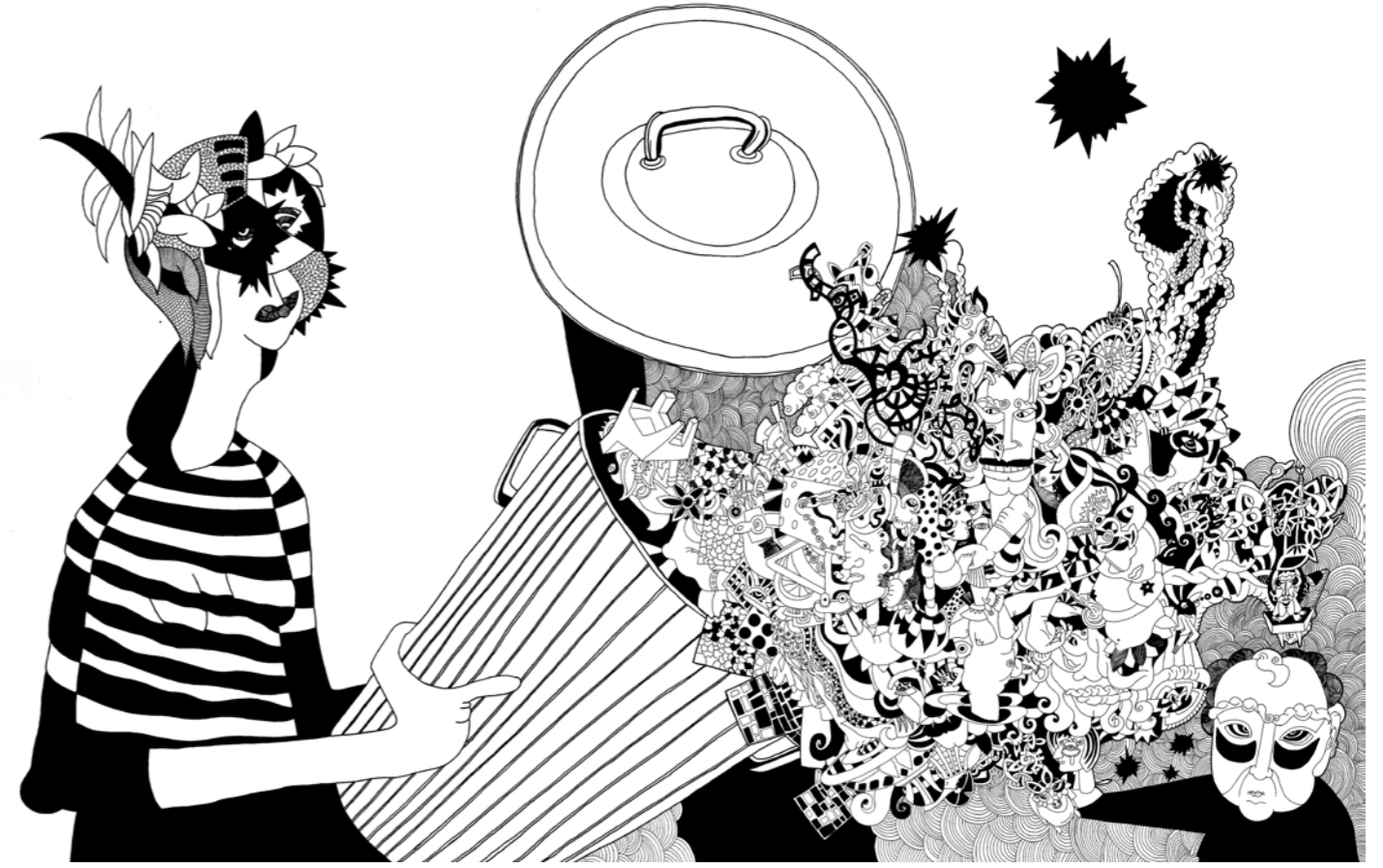
"Çöpünü Döken Kadın". 134 x 90 cm. Kağıt üzerine çini mürekkebi. 2014 "Woman Pouring Her Rubbish". 134 x 90 cm. Indian ink on paper. 2014