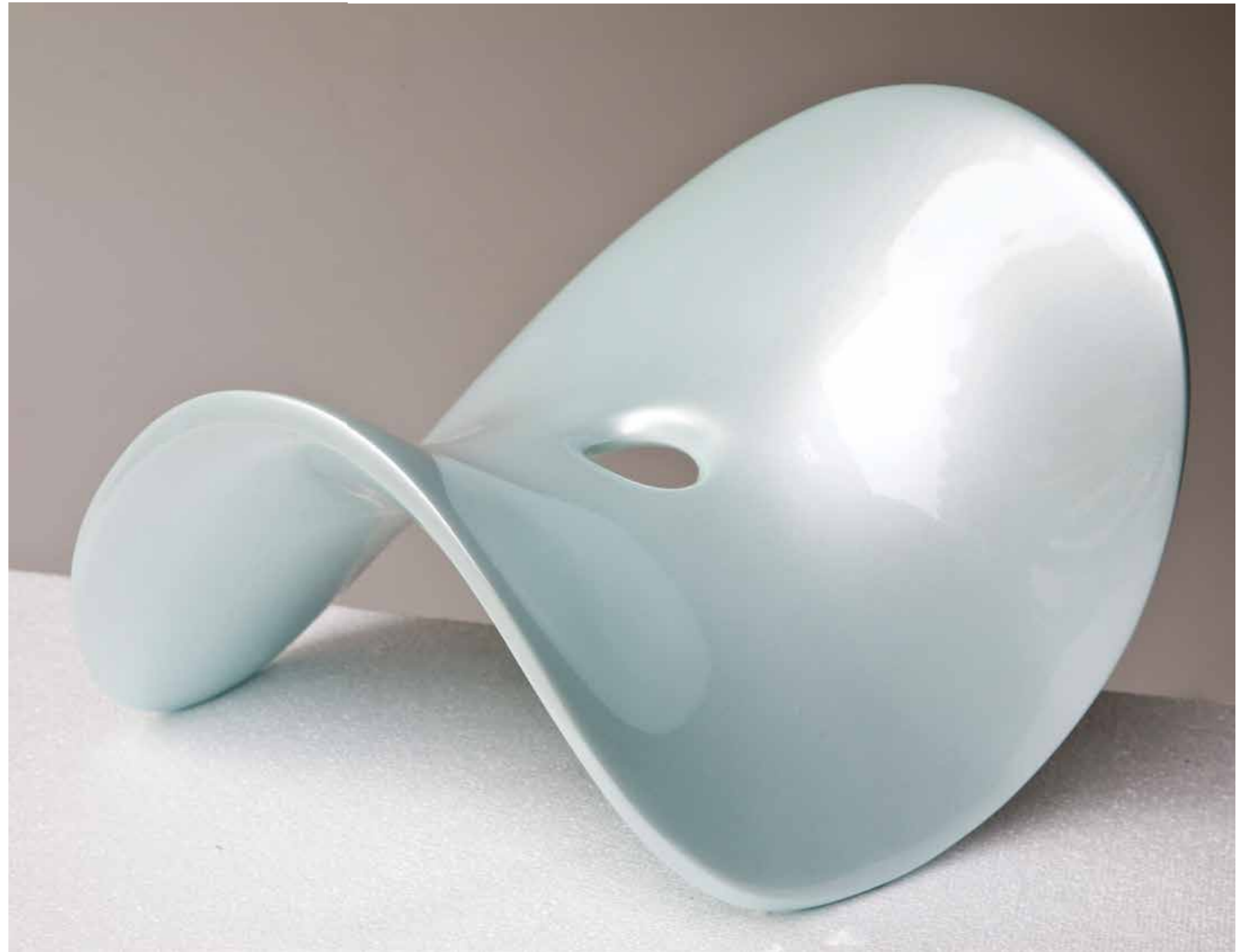
"Huzur" 40x40x30cm. Polyester. 2012 "Tranquility" 40x40x30cm. Polyester. 2012