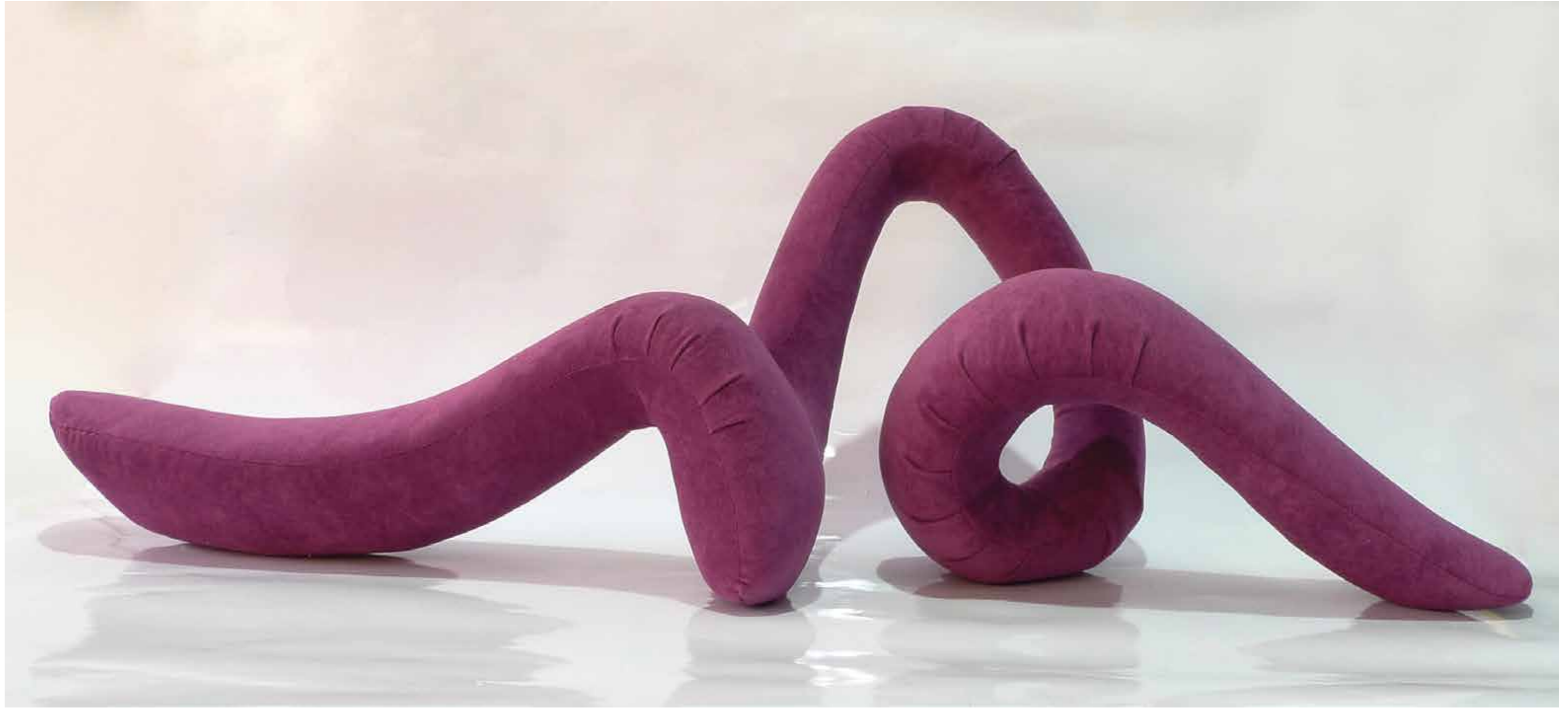
"Neşe" 115x37x40cm. Sünger ve Kumaş. 2012 "Joy" 115x37x40cm. Sponge and Fabric. 2012