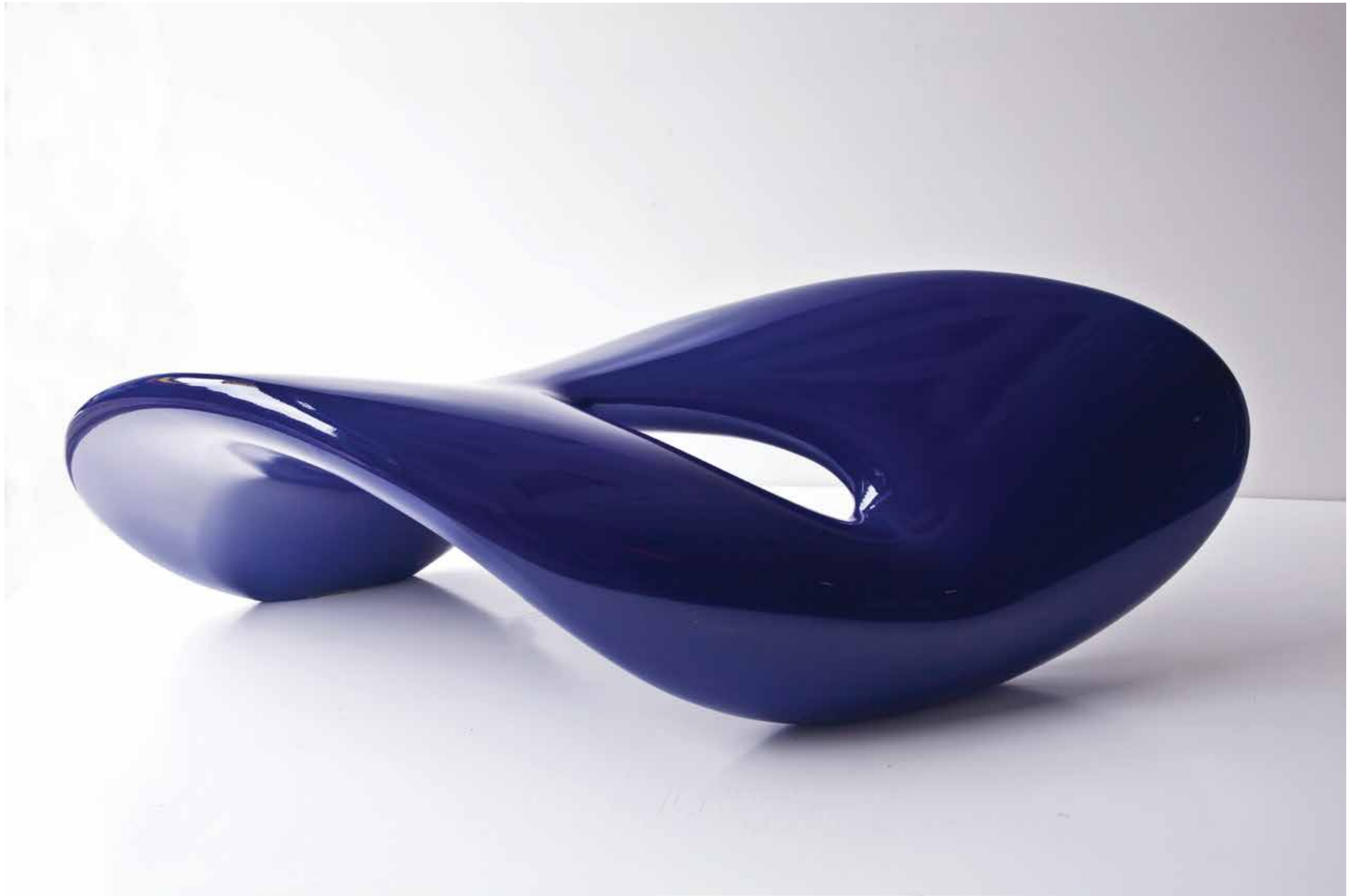
"Bulut" 160x80x50cm. Polyester. 2012 "Cloud" 160x80x50cm. Polyester. 2012