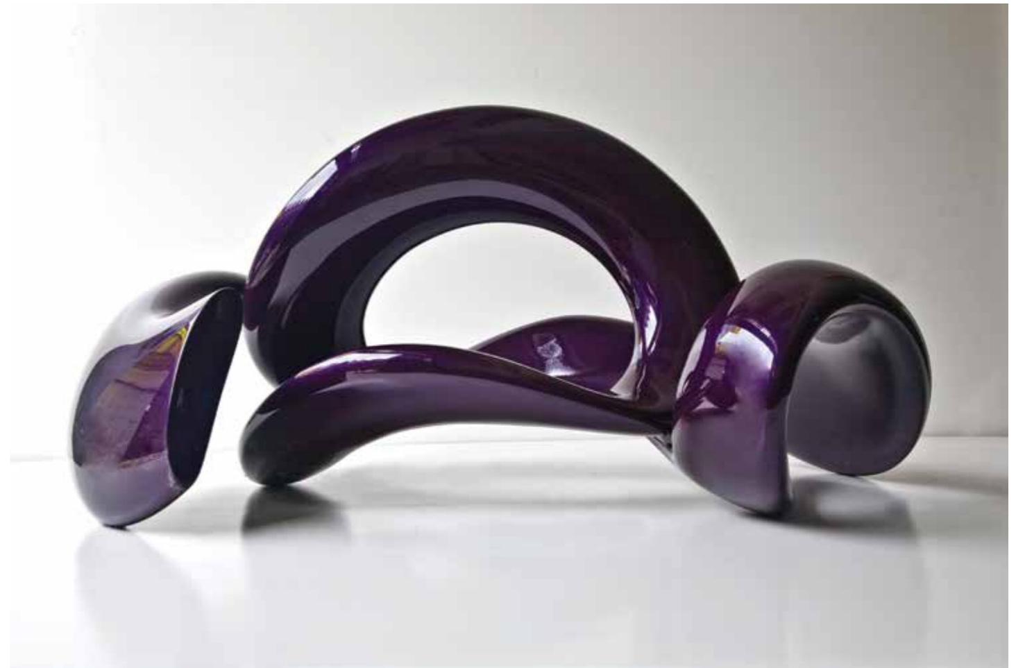
"Zen" 130x85x60cm. Polyester. 2012 "Zen" 130x85x60cm. Polyester. 2012