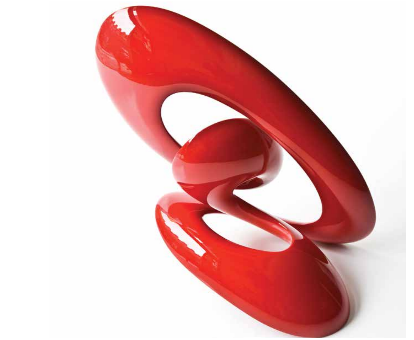
"İsimsiz" 65x30x25cm. Polyester. 2012 "Unfilled" 65x30x25cm. Polyester. 2012