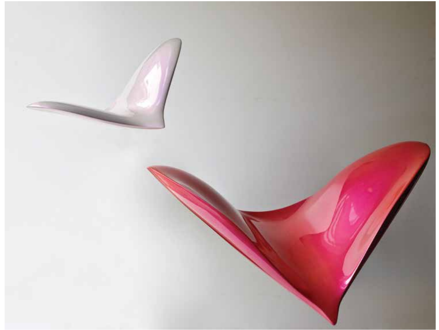
"Özgürlük" 77x70x67cm. Polyester. 2012 "Freedom" 77x70x67cm. Polyester. 2012