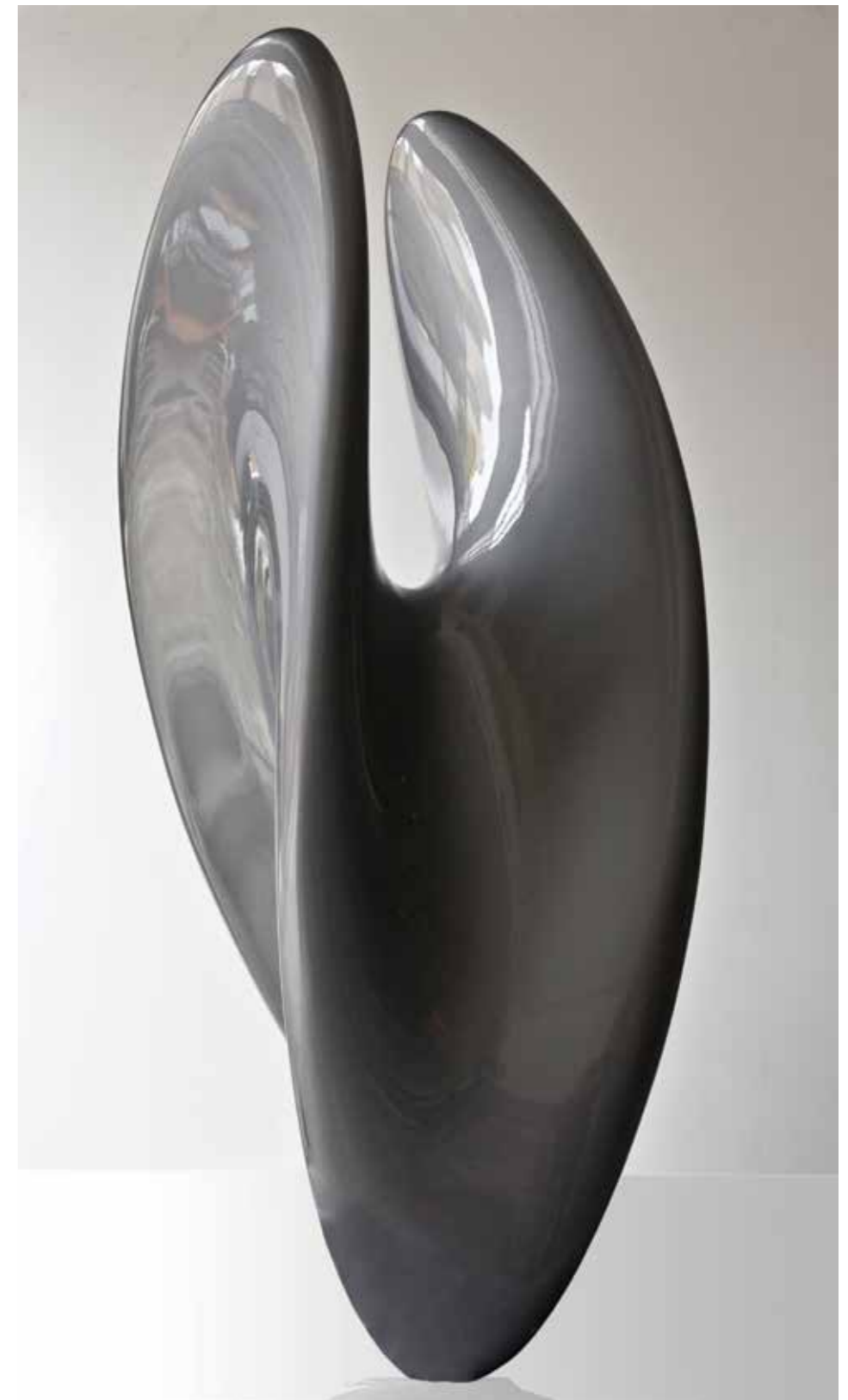
"Güven" 130x55x55cm. Polyester. 2012 "Confidence" 130x55x55cm. Polyester. 2012