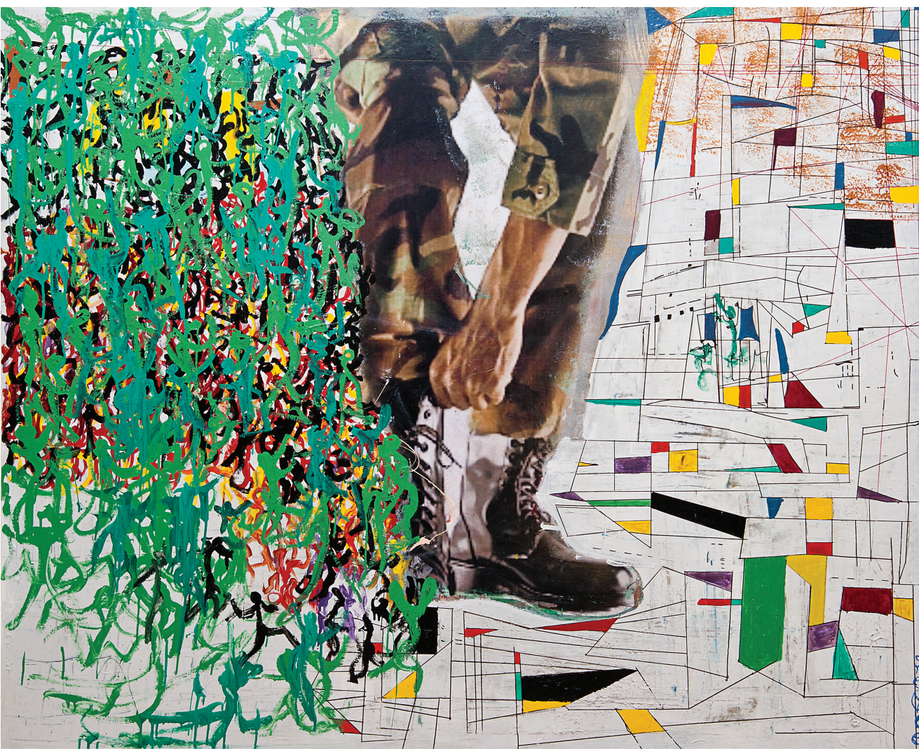
İsimsiz / Untitled , Tuval Üzerine Karışık Teknik / Mixed Media On Canvas , 147 x 180 cm, 2013