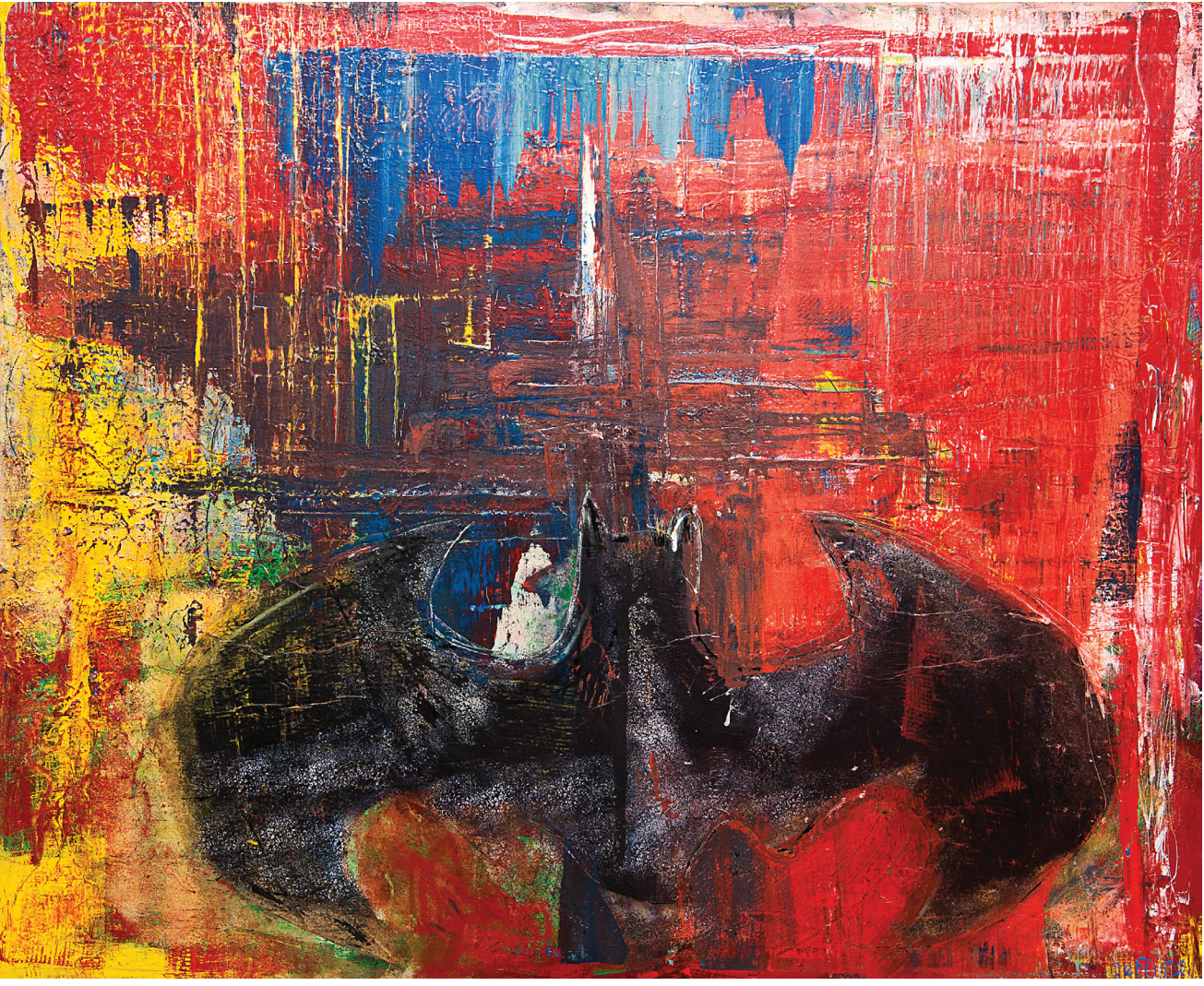
İsmihsiz / Untitled , Tuval Üzerine Karışık Teknik / Mixed Media On Canvas , 147 x 180 cm, 2013