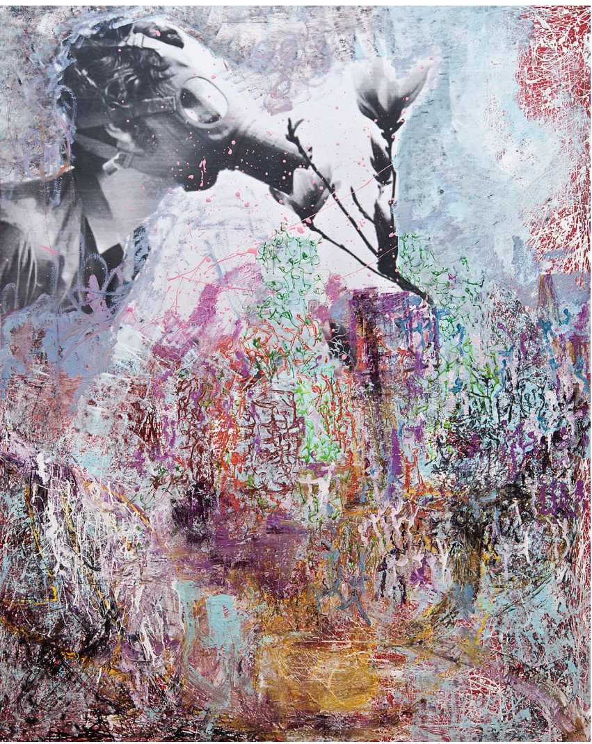
İsimsiz / Untitled , Tuval Üzerine Karışık Teknik / Mixed Media On Canvas , 148 x 180 cm, 2013