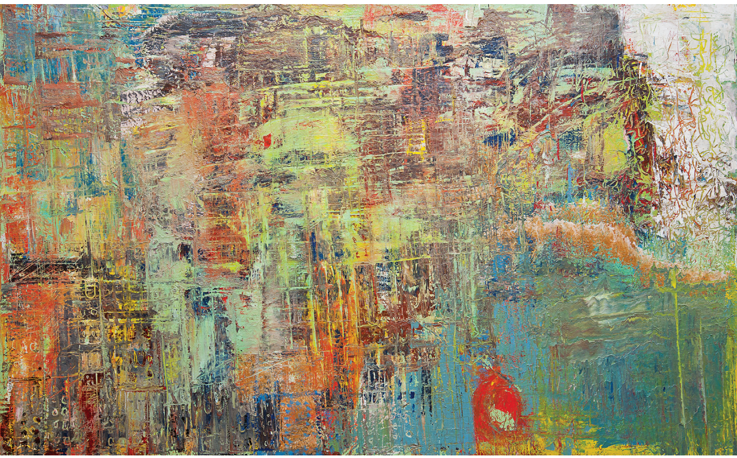
İsimsiz / Untitled , Tuval Üzerine Karışık Teknik / Mixed Media On Canvas , 125 x 200 cm, 2013