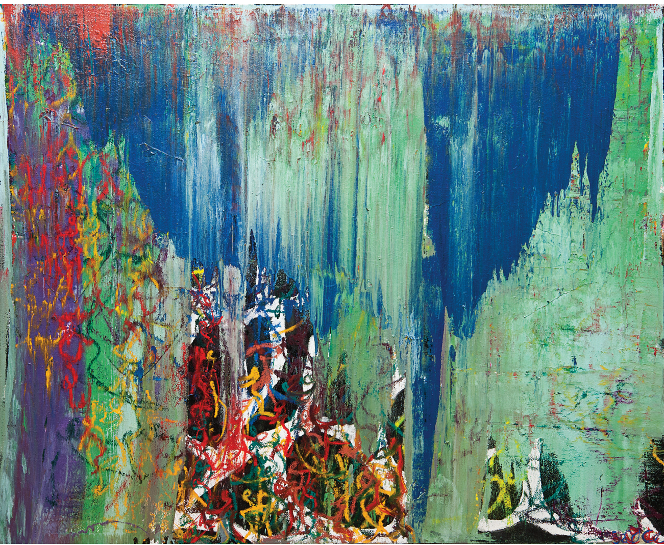
İsimsiz / Untitled , Tuval Üzerine Karışık Teknik / Mixed Media On Canvas , 148 x 180 cm, 2013