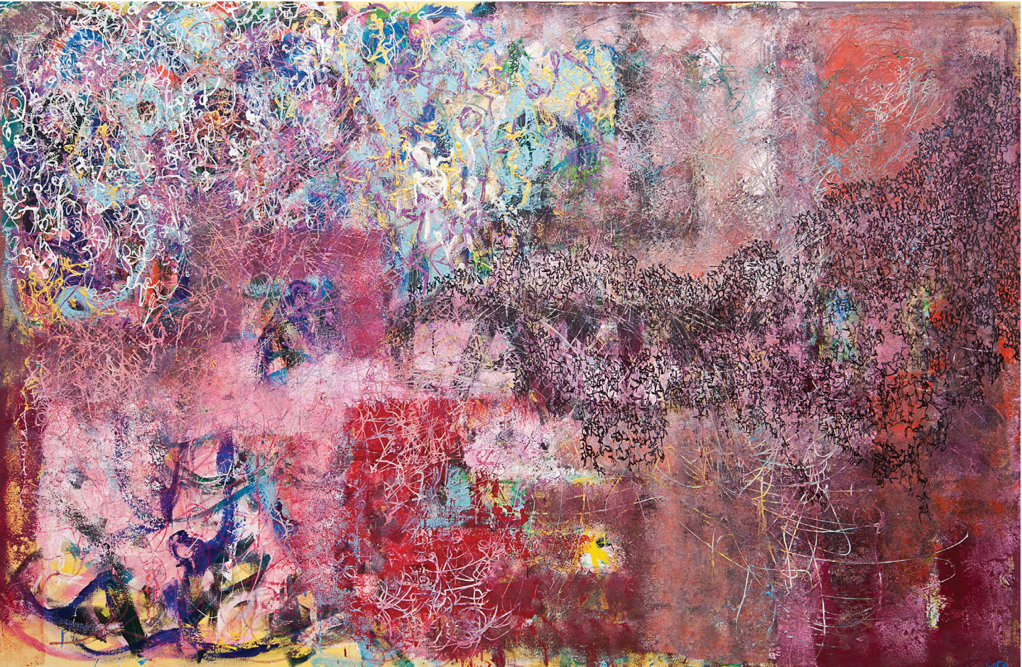
İsimsiz / Untitled , Tuval Üzerine Karışık Teknik / Mixed Media On Canvas , 148 x 210 cm, 2013