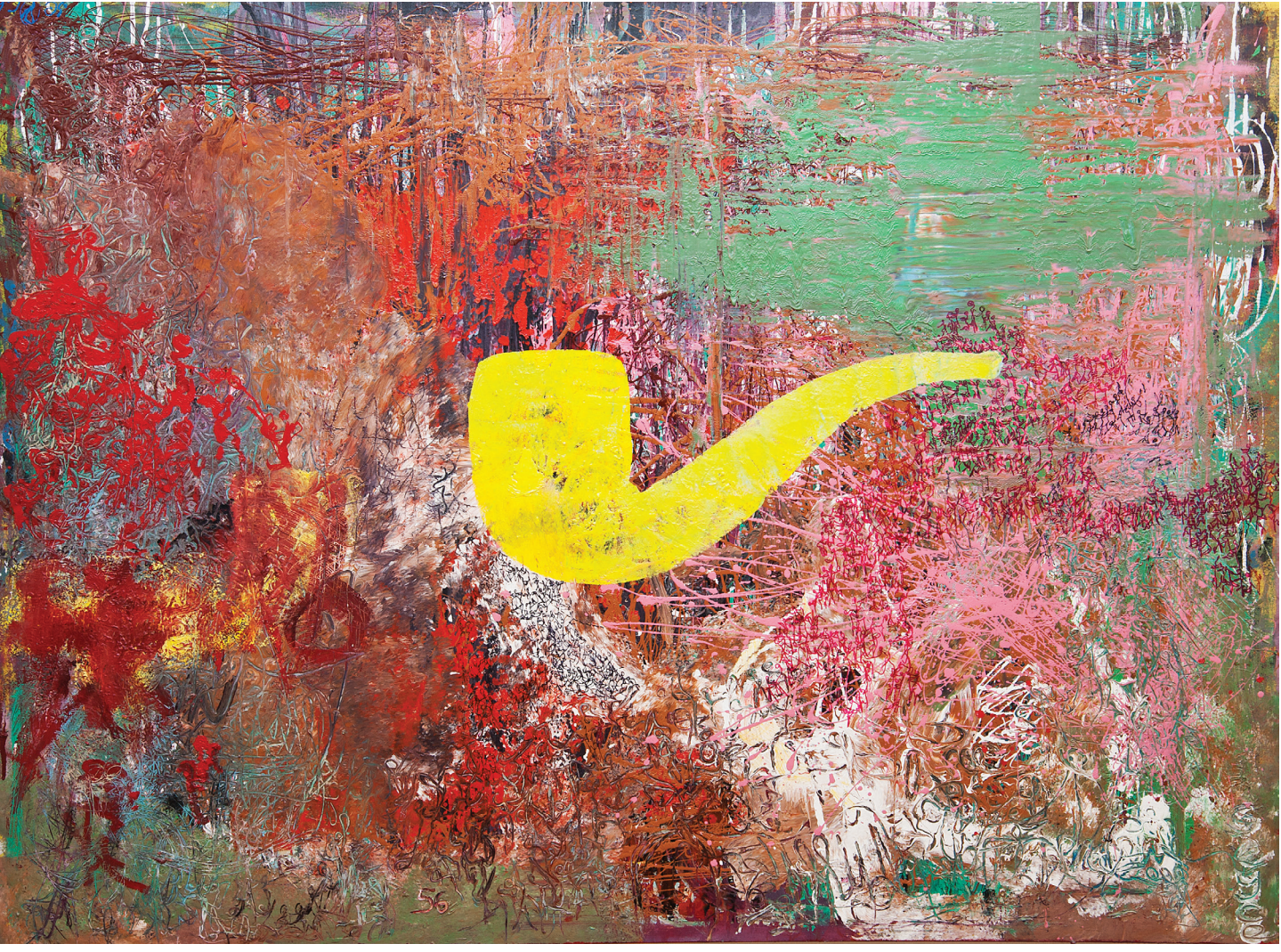
İsimsiz / Untitled , Tuval Üzerine Karışık Teknik / Mixed Media On Canvas , 148 x 192 cm, 2013