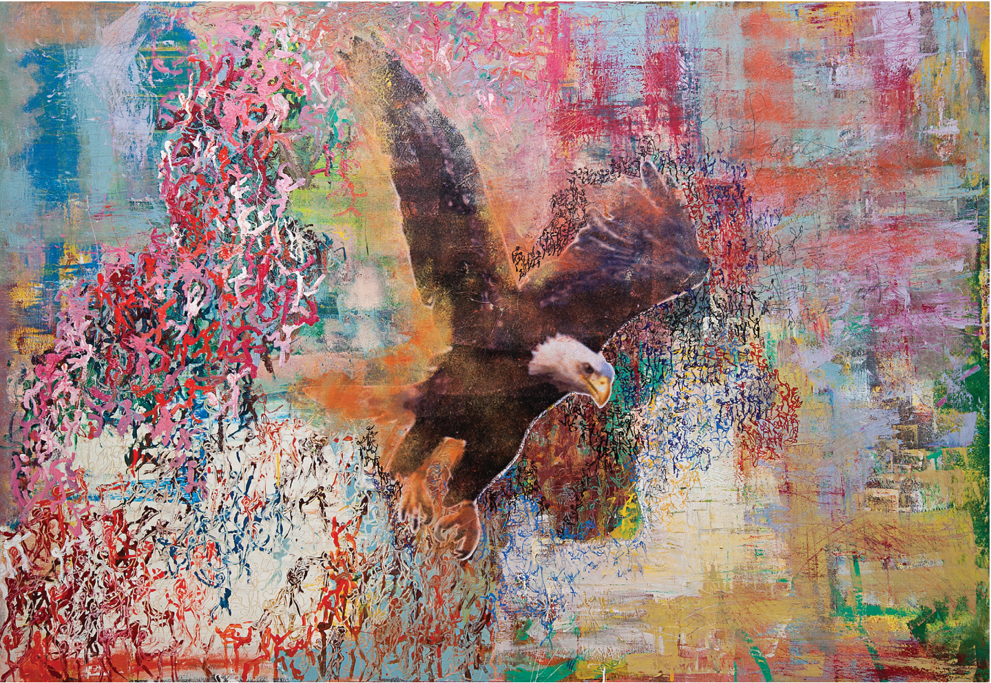
İsimsiz / Untitled , Tuval Üzerine Karşık Teknik / Mixed Media On Canvas , 148 x 210 cm, 2013