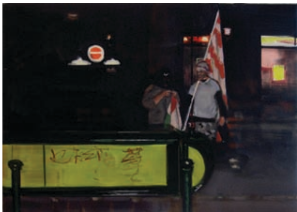
Mindennap56 / Everyday56, 2009