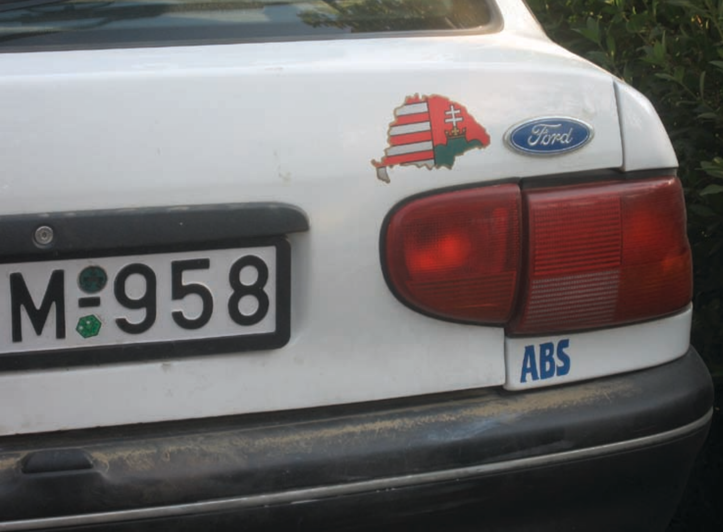
Nagymagyarországos matrica személyautón. / „Great Hungary” decal on a car in 2008.