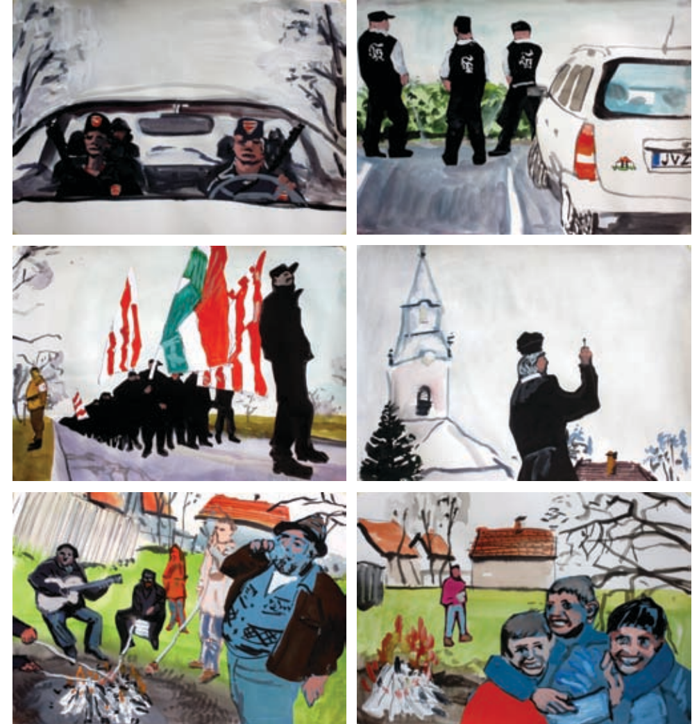
Hóhatár / Snow line, 2008