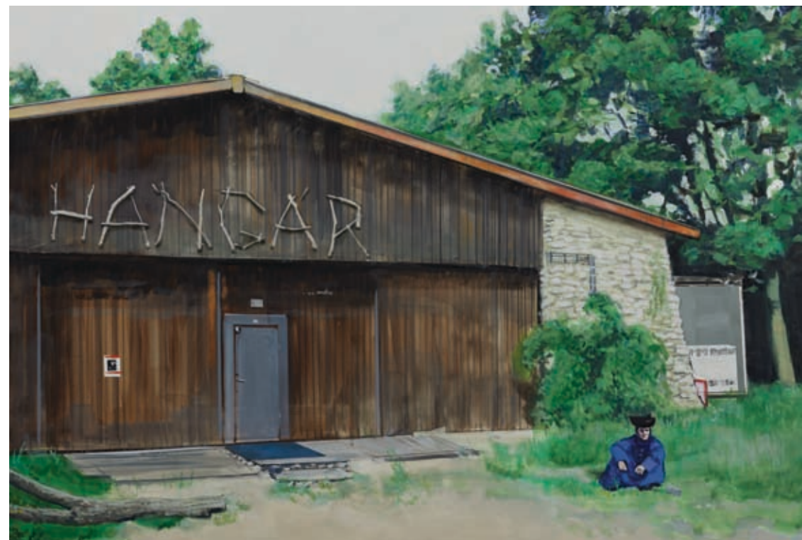
Kukorica, szója, beton / Corn, soy, concrete, 2008