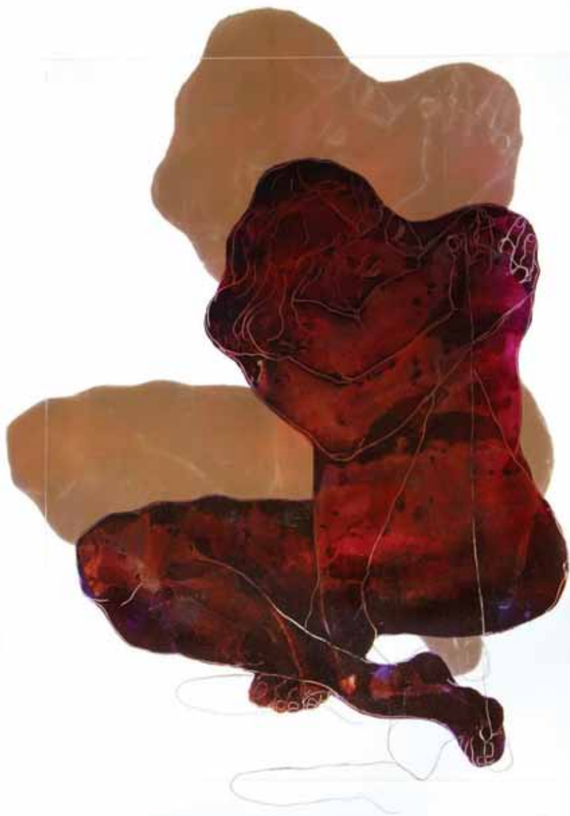
Untitled Oil on Plexi Glass / 90 x 60 cm