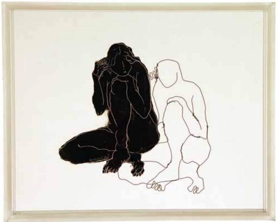
Untitled Wire and Oil on Plexi Glass / 40 x 50 cm