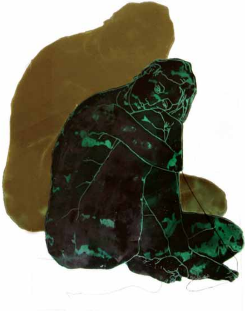
Untitled Oil on Plexi Glass / 90 x 60 cm