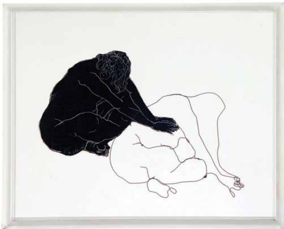
Untitled Wire and Oil on Plexi Glass / 40 x 50 cm