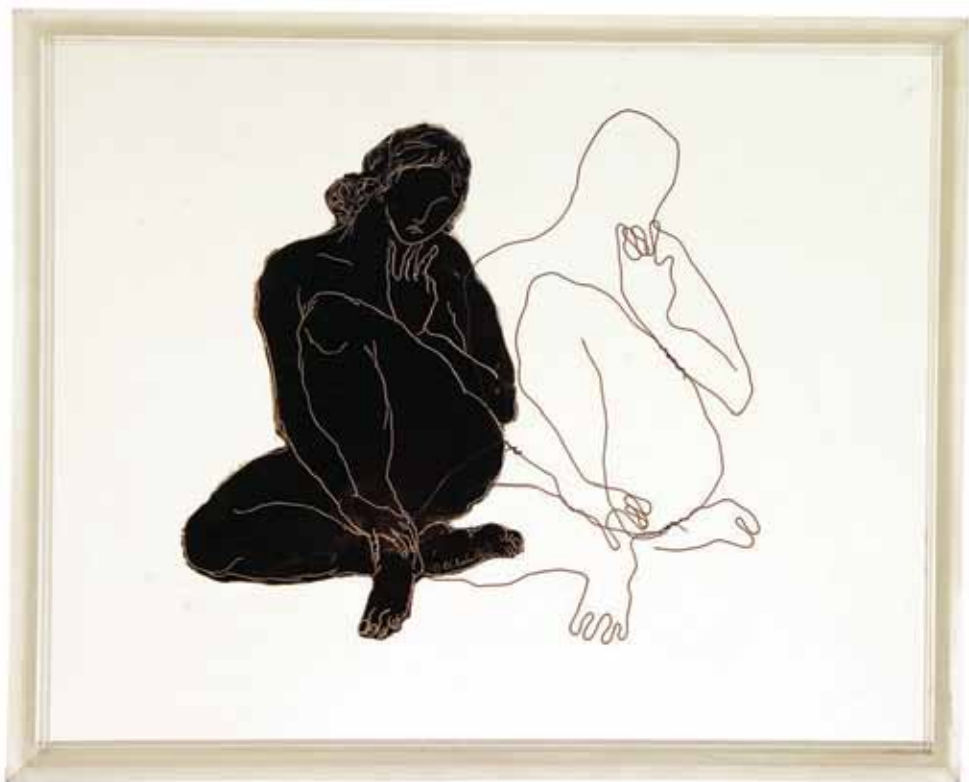
Untitled Wire and Oil on Plexi Glass / 40 x 50 cm

بدون عنوان سیم فلزی و رنگ و روغن روی پلکسی گلاس / ۴۰ × ۵۰ سانتی متر