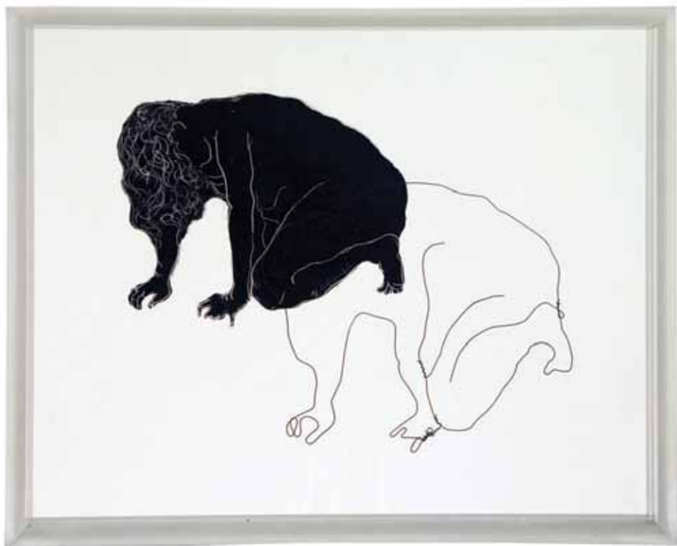
Untitled Wire and Oil on Plexi Glass / 40 x 50 cm