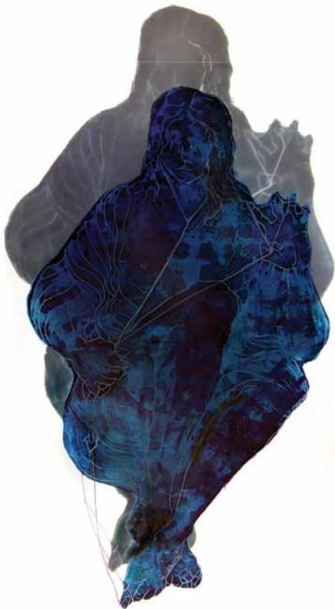
Untitled Oil on Plexi Glass / 90 x 60 cm

بدون عنوان رنگ و روغن روی پلکسی گلاس / ۹۰ × ۶۰ سانتی متر