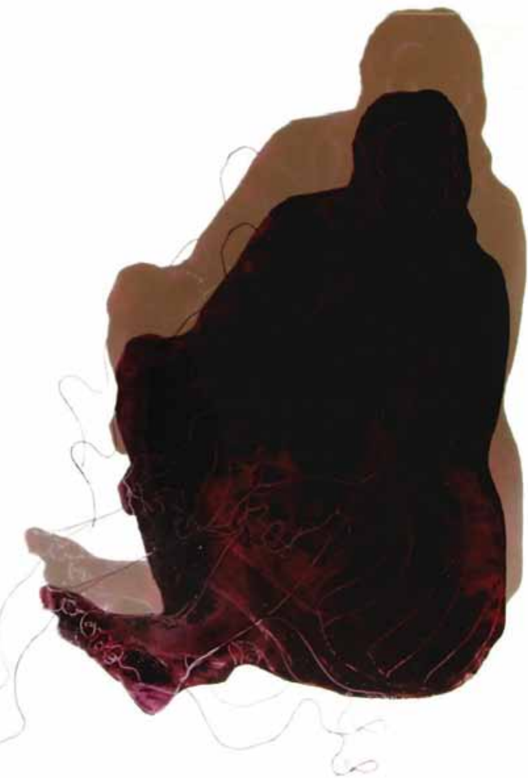
بدون عنوان رنگ و روغن روی پلکسی گلاس / ۱۲۰ × ۹۰ سانتی متر