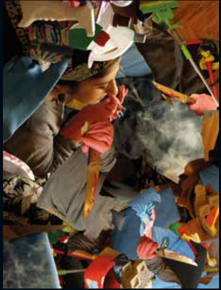
2009, Kesmek Üzerine 2 / On Cutting 2, 122 x 95 cm, ışıklı kutu / light box