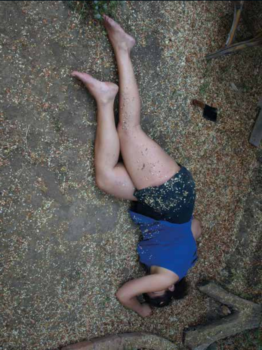
2013, Verde / On the Ground, 100 x 75 cm, fotograf / photograph