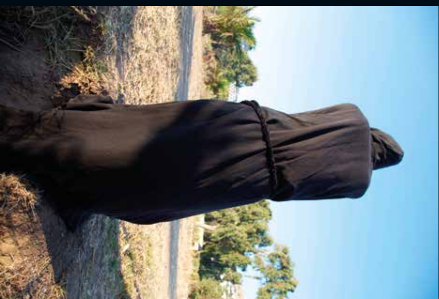
2013, Azrail 3 / Grim Reaper, 86 x 130 cm, fotograf / photograph