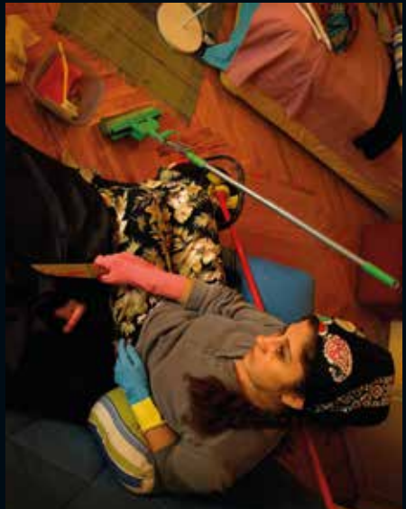
2009, Kesmek Üzerine 3 / On Cutting 3, 122 x 95 cm, ışıklı kutu / light box