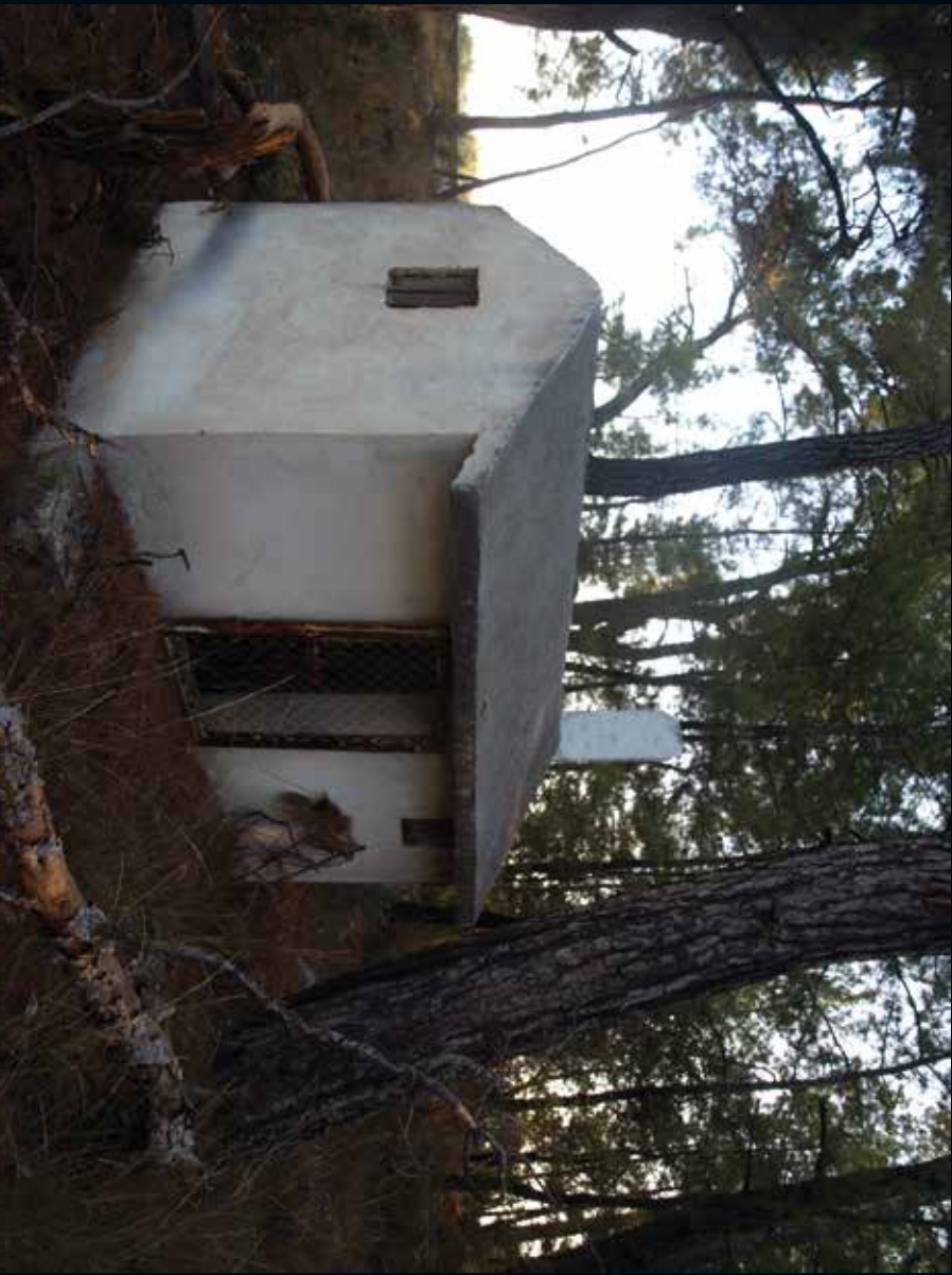
2013, Mezar / Ey, Grave / Home, 60x45 cm., fotograf / photograph