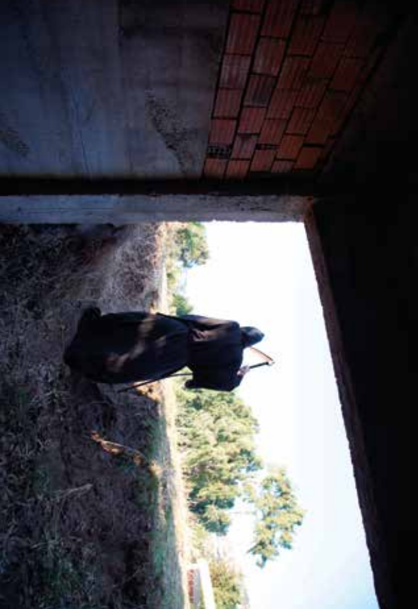
2013, Azraail 4 / Grim Reaper, 86 x 130 cm, fotograf / photograph