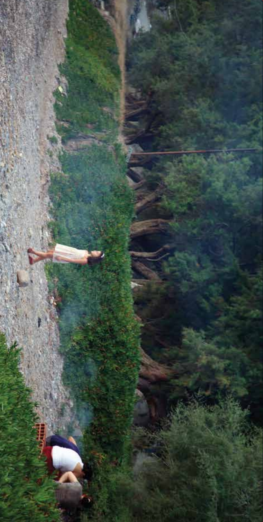
2013, Adim / To Take a Step, 150 x 78 cm, fotograf / photograph