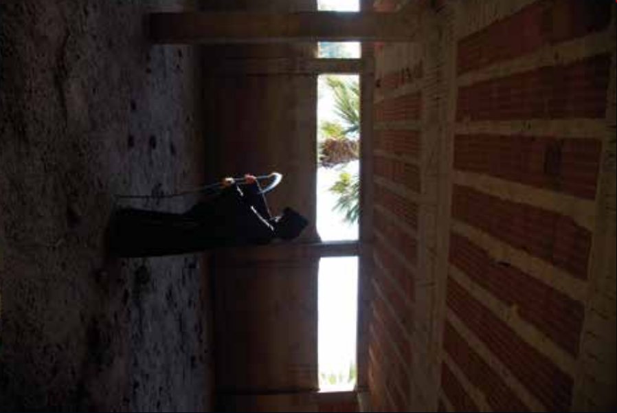
2013, Azrail 2 / Grim Reaper, 86 x 130 cm, fotograf / photograph