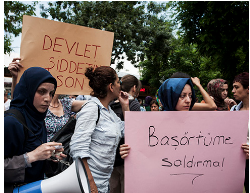
NARPHOTOS HATIRDA KALAN REMAINING MEMORIES [Detay, sf.39 Detail, p.39]

Remaining Memories compiles photographs by the collective NarPhotos, the members of which try to attend all the significant activist events and capture moments of celebration, demonstration, and resistance in order to construct a visual collective memory. On the one hand, we see heavily loaded images concerning current events and debates mainly in Turkey. But on the other hand, the images become ordinary, if not banal, due to the omnipresence of similarly charged and depressing events elsewhere. Deviating from their usual practice of documenting politically loaded images on a wall or screen, NarPhotos install an archive room for the compiled photographs, to give the audience a space to go through them carefully, read the narrations and the information provided about each image.