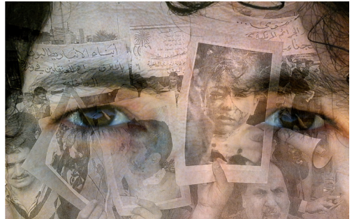
LORIE NOVAK RASTGELE MÜDAHALE RANDOM INTERFERENCE [Detay, sf.41 Detail, p.41]

Random Interference by Lorie Novak draws from her 15-year collection of approximately 5,500 New York Times news sections as well as photographs grabbed from the Internet. The images are not any different from the images that we are confronted with every day in many other newspapers, which makes looking at the work simultaneously difficult and almost annoyingly familiar. Novak uses a computer based randomizing system to generate pairs of images. In that way she twists the urge to turn away from the images, and asks the viewer to construct connections between events. This makes one realise in a deeper sense that even if the violent events are not directly related to each other, they are still correlated in deeper, underlying logics. The main witnesses to the events shown in the newspapers are the journalists who report the events and capture the image. As readers, we are secondary witnesses to the event, which is multiply mediated. Novak takes a position between the audience and the media images, introducing one more, deliberate effect of alienation, while reminding us of the overwhelming and enduring nature of violence. During the course of the exhibition, Novak will be adding images to a sequence drawn from news sources in Turkey as well as significant world events from the international media.