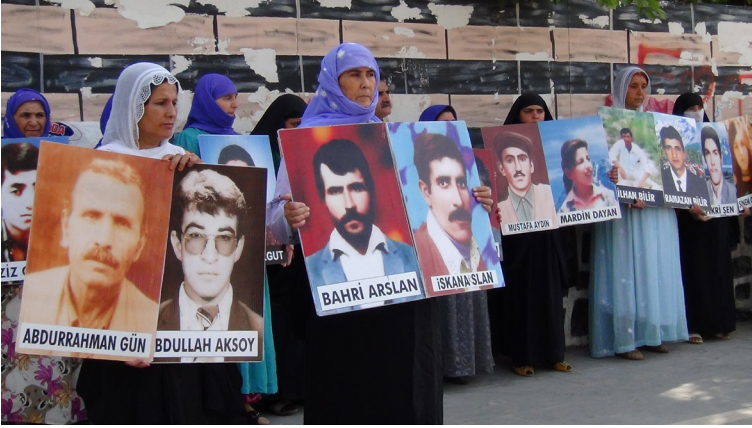
HAKİKAT ADALET HAFIZA MERKEZİ TRUTH JUSTICE MEMORY CENTER FOTOĞRAFI KALDIRMAK HOLDING UP THE PHOTOGRAPH [Detay, sf.33 Detail, p.33]

koyuyor. Zorla kaybettirilmiş kişilerin susturulmuş geçmişini aktaran iş, kararlı mücadelelerine kolektif bir güç halinde devam ederek her Cumartesi bir araya toplanan, kayıp sevdiklerinin çerçevesi fotoğraflarını havaya kaldıran ve akıbetlerini soruşturarak politik talepler dile getiren kayıp yakınlarının deneyimlerini temel alıyor.