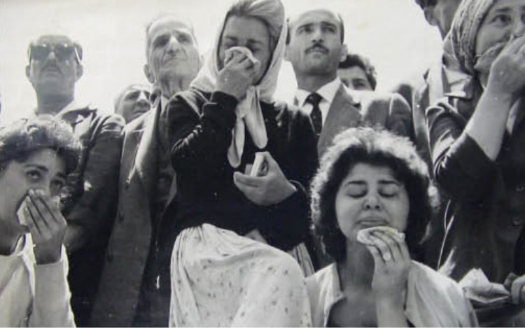
GÜLSÜN KARAMUSTAFA MEYDANIN BELLEĞİ MEMORY OF A SQUARE [Detay, sf. 35 Detail, p.35]

such an approach, and with a platform that will outlive the physical installation at DEPO during the exhibition, the artist aims to expose the mutual complexity of [visual] storytelling and of the dynamic [re]writing of history. The work underlines the power of images and the new meaning they gain [through specific arrangements] in the creation of a visual narrative, emphasizing the subjectivity of the process by which we create our own memory of a given subject matter, and the role the media, also through [photo] journalism, plays in this creation.