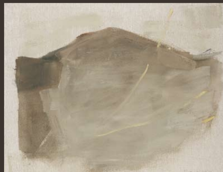
PETER KRAWAGNA 1937 Berg, 2008, Öl/Lw. 114 x 146 cm, sign. u. dat.