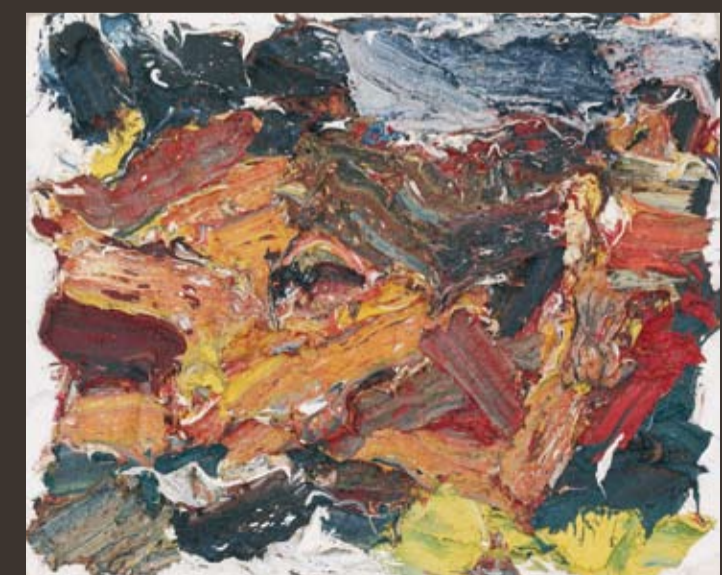
FRANZ GRABMAYR 1927 Sonnige Felswand, 2007, Öl/Lw., 67 x 82 cm, rücks. sign. u. dat. Abb. in: Grabmayr/80.Geburtstag