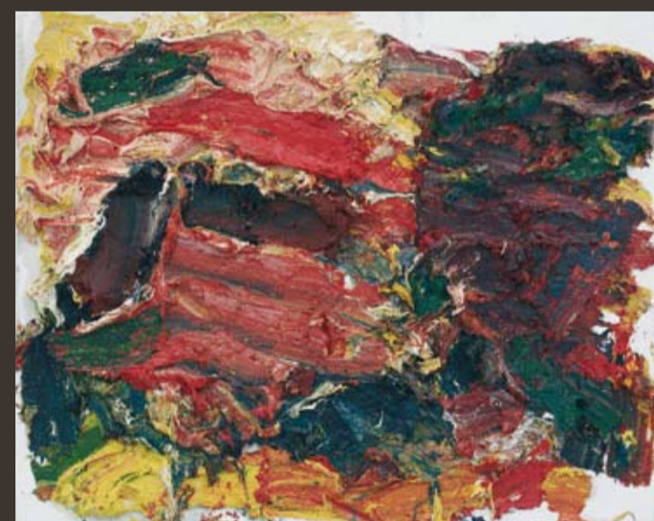
FRANZ GRABMAYR 1927 Sonnige Felswand, 2007, Öl/Lw., 66,5 x 81,5 cm, rücks. sign. u. dat. Abb. in: Grabmayr/80.Geburtstag