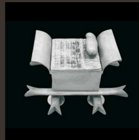
BRUNO GIRONCOLI 1936 Emil, 2007, Aluminiumguss, 95 x 87 x 54 cm, 7/10, punziert, WV SE 44