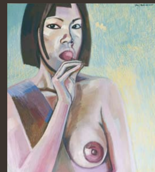
FRANZ YANG-MOČNIK 1951 Yang Han, 2005, Öl/Lw., 200 x 170 cm sign. u. dat.