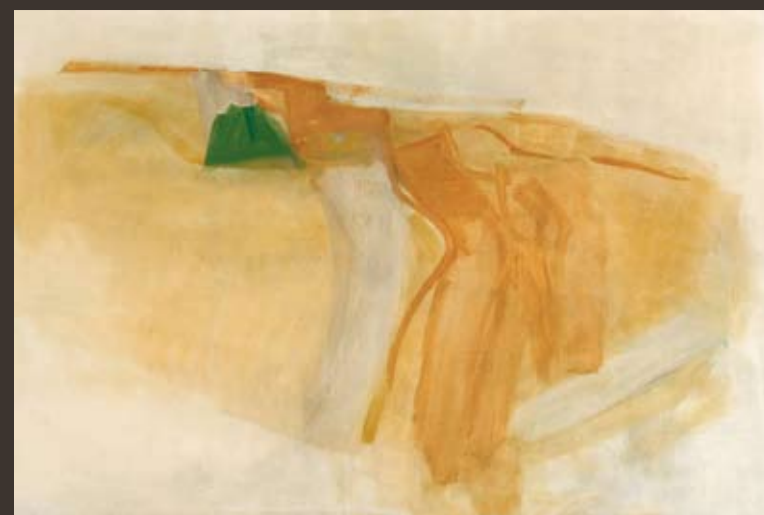
PETER KRAWAGNA 1937 Ohne Titel, 2002, Öl/Lw. 195 x 292 cm, sign. u. dat.