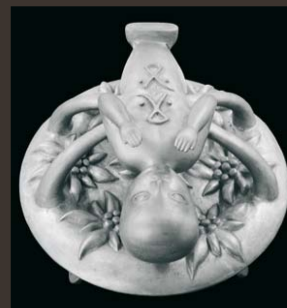
BRUNO GIRONCOLI 1936 Baby auf Edelweiß, 2007, Aluminiumguss Ø78 x 47 cm, 1/10, punziert, WV SE45