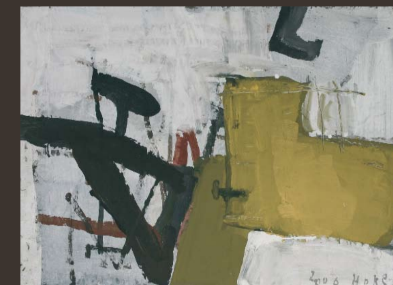
GISELBERT HOKE 1927 Palettenbild 22, 2006, Acryl/Zellulose 64 x 86 cm, sign. u. dat.