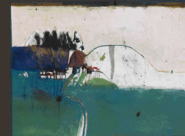
GISELBERT HOKE 1927 Loneriaco 2, 9/4/86, Gouache/Papier 51 x 66 cm, sign., bet. u. dat.