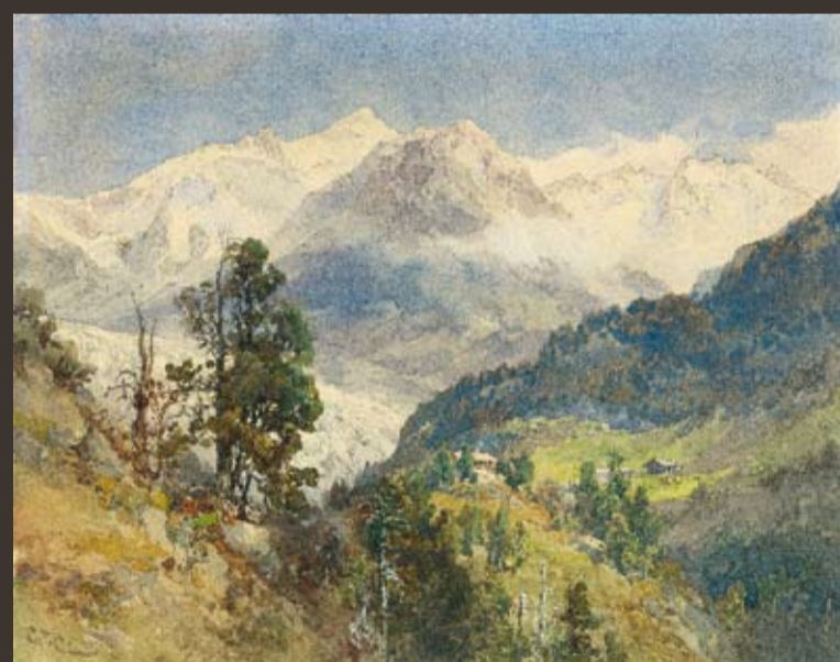
EDWARD THEODORE COMPTON 1849 - 1921 Blick ins Gepatschtal, Aquarell, 24 x 30 cm, sign. Abb. in: Compton/Brandes Seite 109