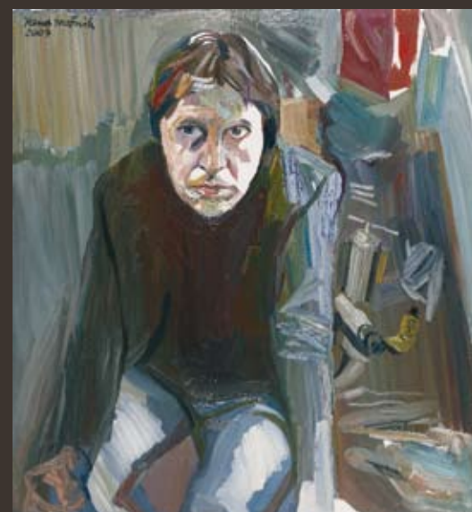
FRANZ YANG-MOČNIK 1951 Selbstportrait, 2007, Öl/Platte, 89 x 82 cm, sign. u. dat.