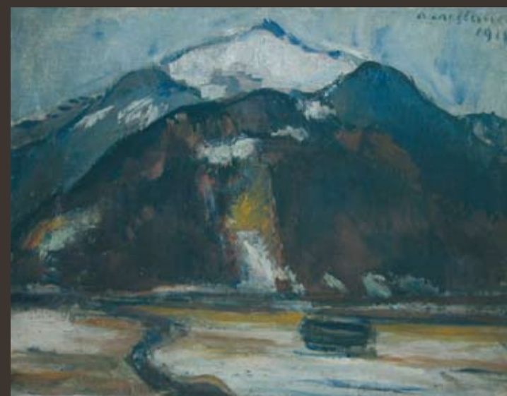
ANTON FAISTAUER 1887 - 1930 Berge im Pinzgau, 1918, Öl/Lw. 52 x 66,5 cm, sign. u. dat.