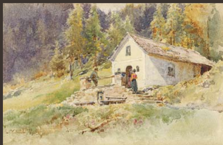
EDWARD THEODORE COMPTON 1849 - 1921 Briccius-Kapelle (Heiligenblut), Aquarell, 20 x 31 cm, sign. Abb. in: Compton/Brandes Seite 271