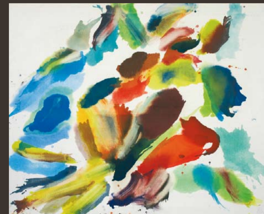
WOLFGANG HOLLEGHA 1929 Ohne Titel, 2007, Öl/Lw. 200 x 235 cm, sign.