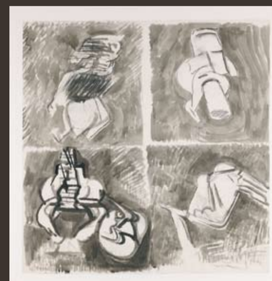
MARIA LASSNIG 1919 New York City, 1979, Kohle u. Gouache 110 x 106,5 cm, sign. u. dat.