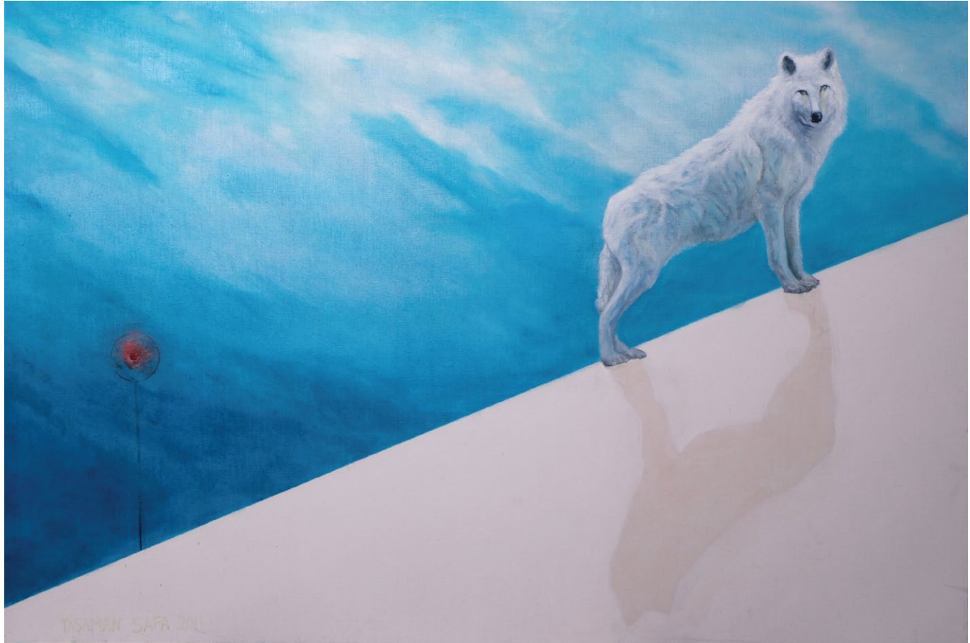
Yasaman Safa / Last Wolf / 2011 / oil on canvas / 120x180 cm