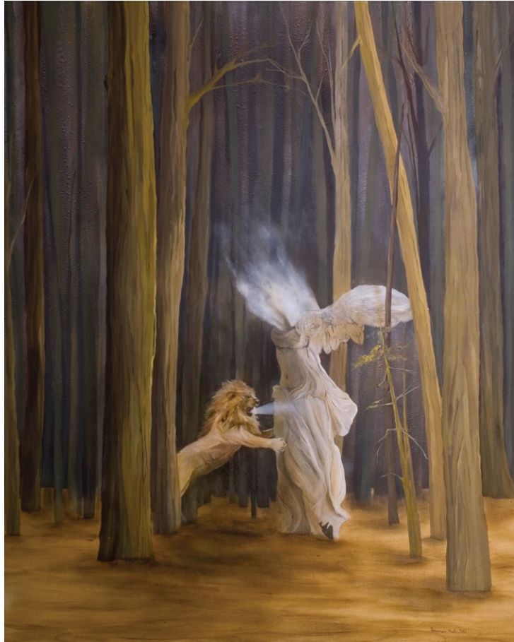
Yasaman Safa / Lion and Statue / 2012 / oil on canvas / 200X150 cm