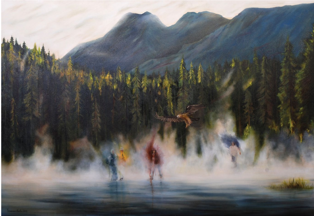
Yasaman Safa / Crossing The Lake / 2012 / oil on canvas / 140x190 cm