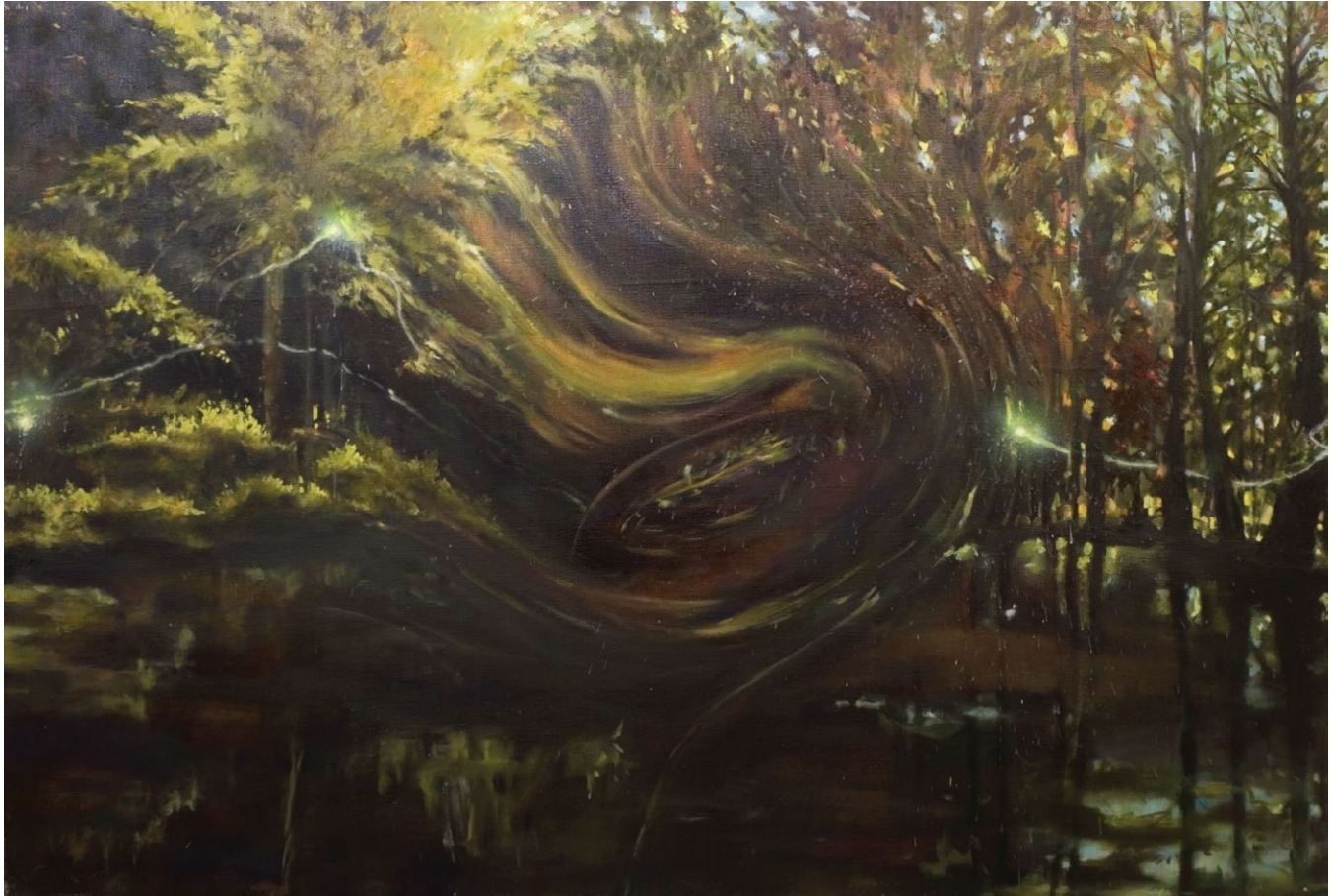
Yasaman Safa / The Middle Of Jungle / 2011 / oil on canvas / 120x180 cm