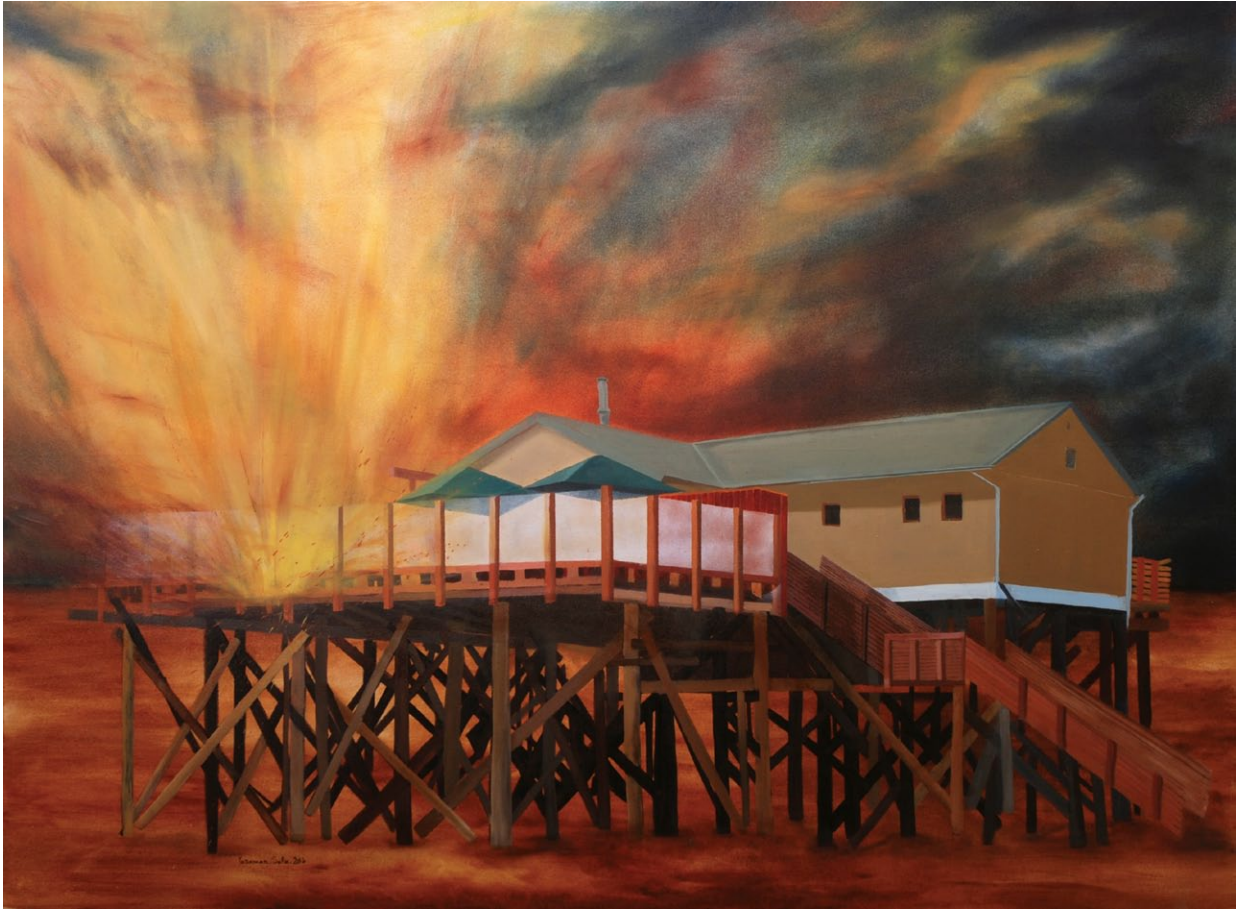
Yasaman Safa / Summer Sunset / 2013 / oil on canvas / 140x190 cm