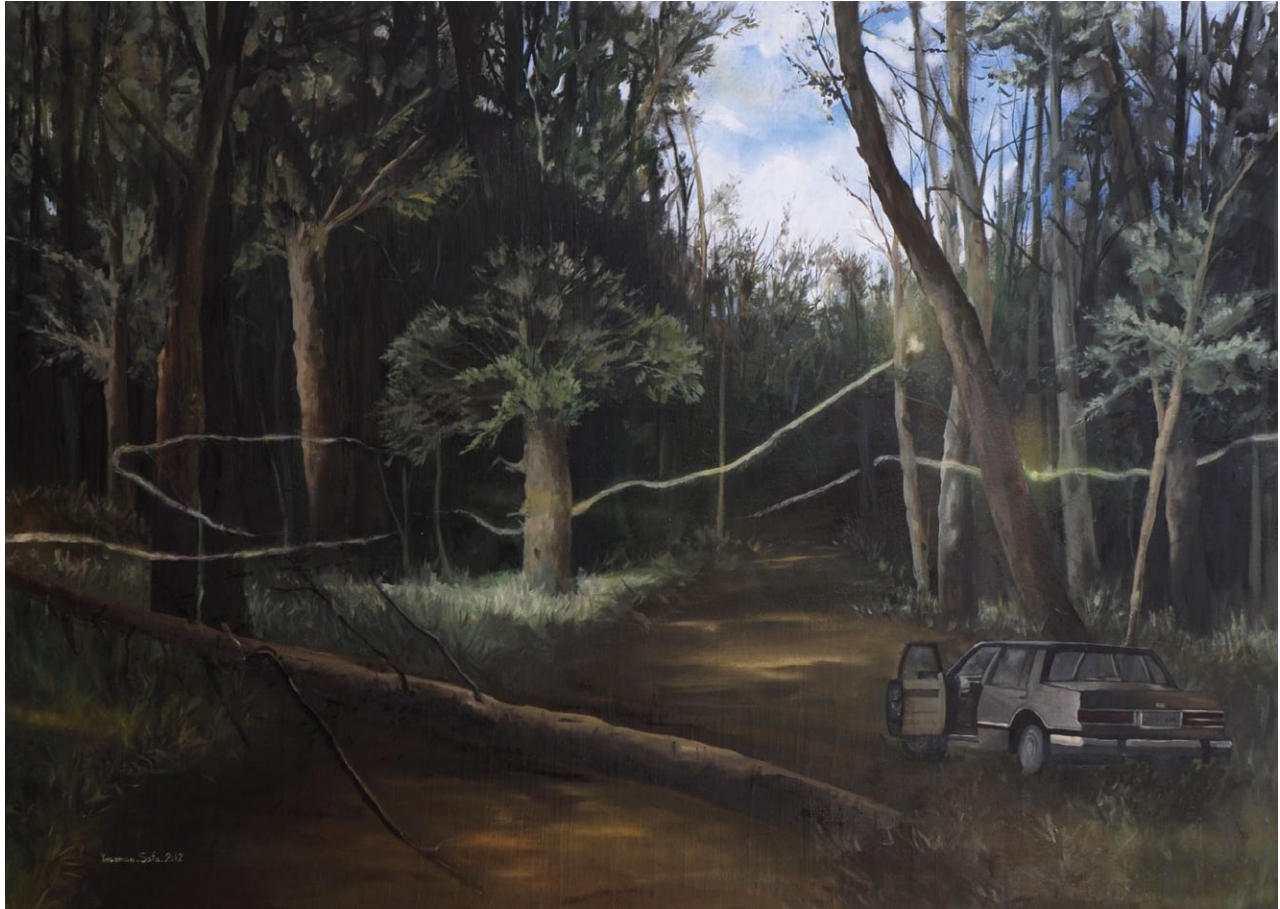
Yasaman Safa / Before The First Date / 2012 / oil on canvas / 100x150 cm