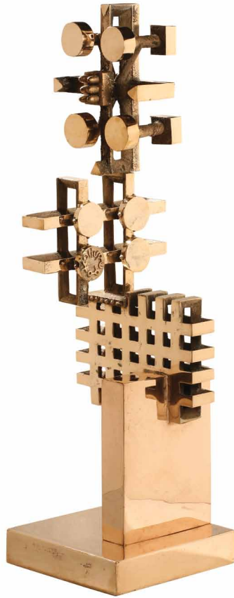
Ali Mousavizadeh / "Freedom" / bronze / 25x25x85 cm / 2011