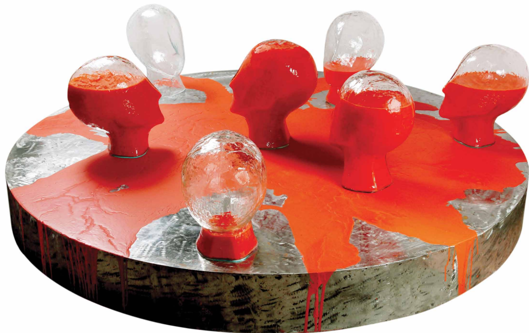
Sara Saghari / "Untitled" / mixed media / 150x150x15 cm / 2012