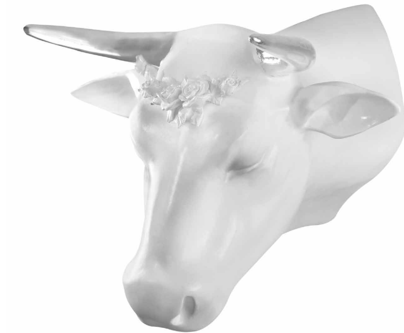
Raheleh Nouravar / "Untitled" / fiberglass / 80x75x60 cm / 2012