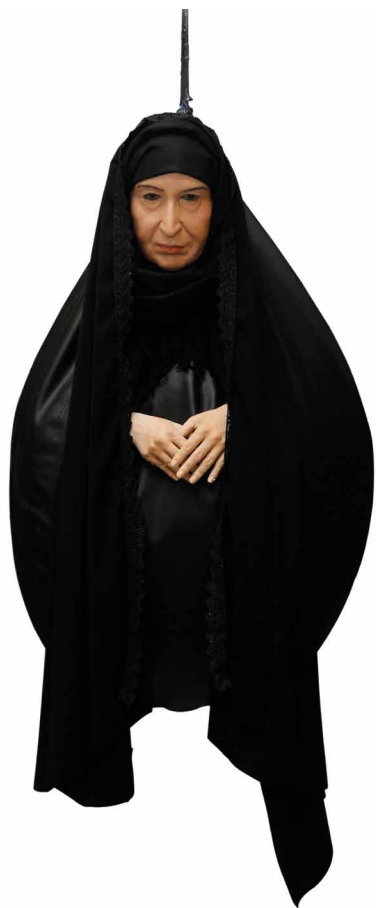
Negar Naderipour / AMAL / mixed media / 100X110X110 cm / 2012