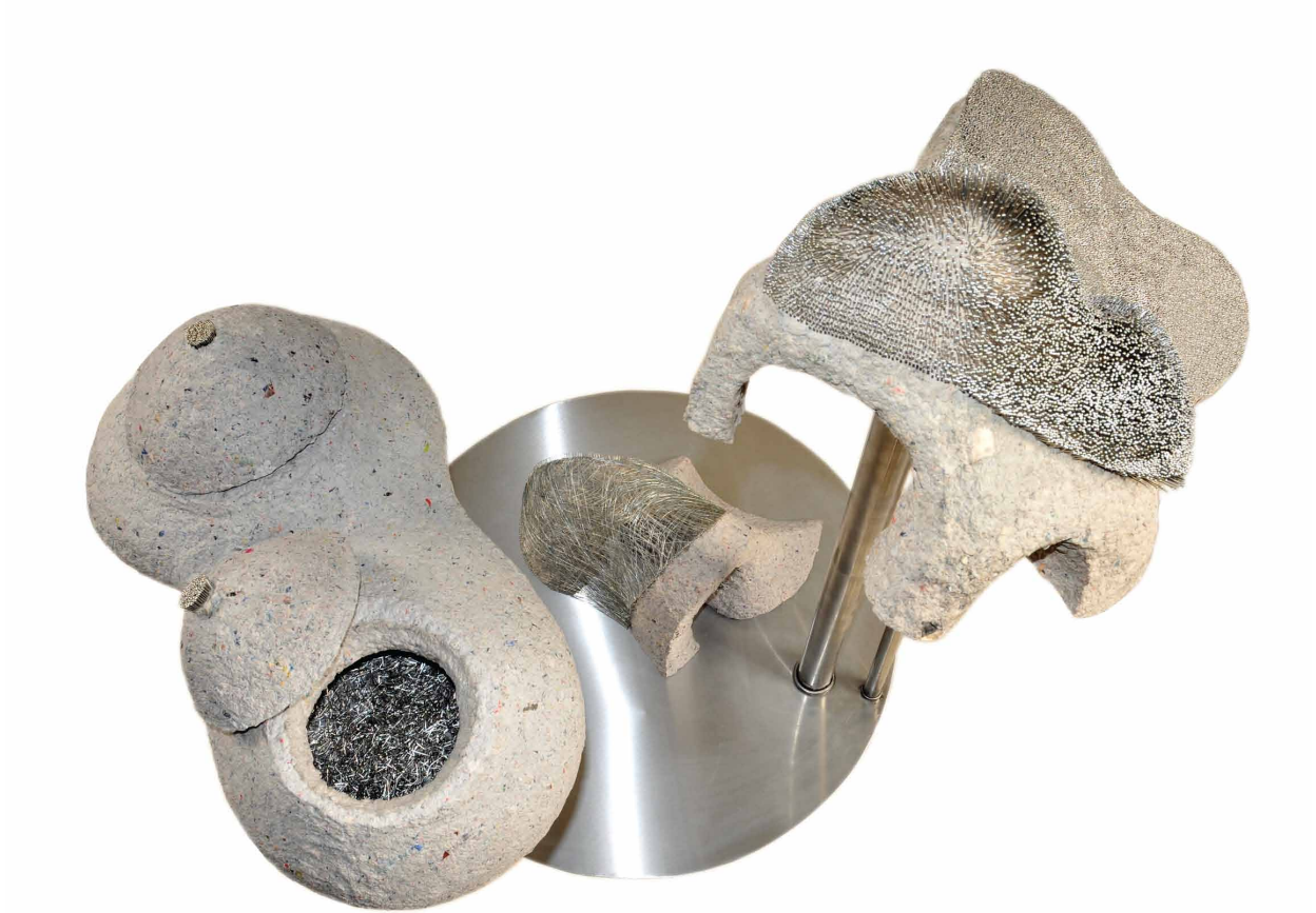
Soheila Ildar / "Untitled" / mixed media / 120x120x80 cm / 2012