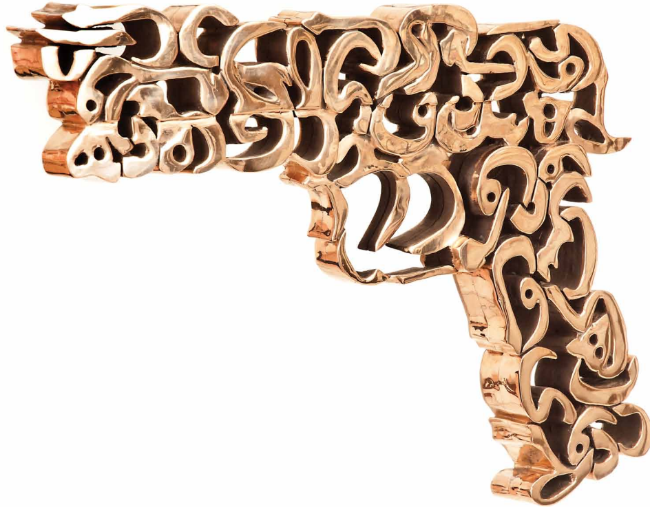
Farnaz Rabieijah / "The Golden Gun" / bronze / editions of three + AP / 26.5x39x3.5 cm / 2012