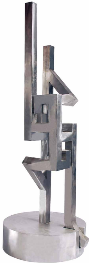
Mahmoud Zargar / "... " / iron / 22x22x140 cm / 2011