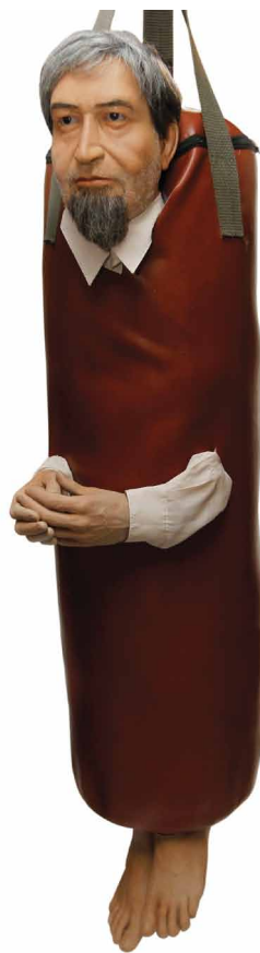
AKSOL AMAL / mixed media / 130X50X50 cm / 2012