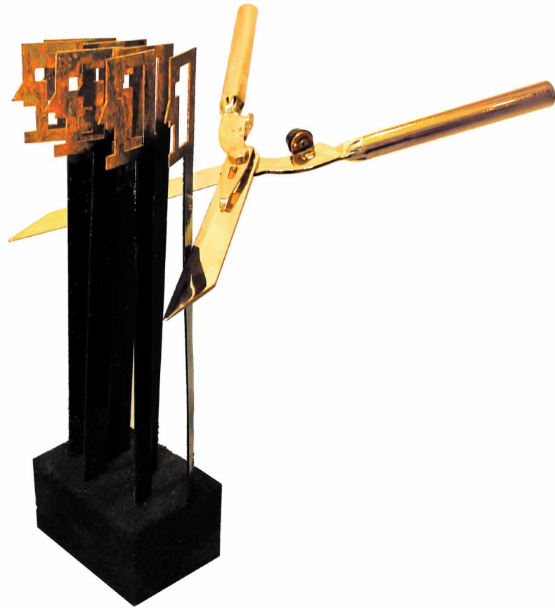
Farish Alborzkouh / "The Arab Spring" / iron / 48x40x12 cm / 2012