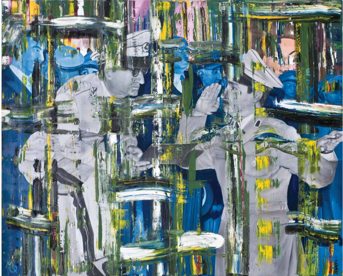
Myriam Quiel / "Neverendingstory(5)" / oil on canvas / 162x200 cm / 2012