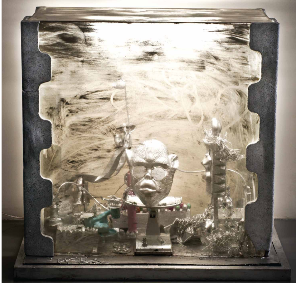
Myriam Quiel / "Back to the Future(4)" / mixed media / 85x90x60 cm / 2012