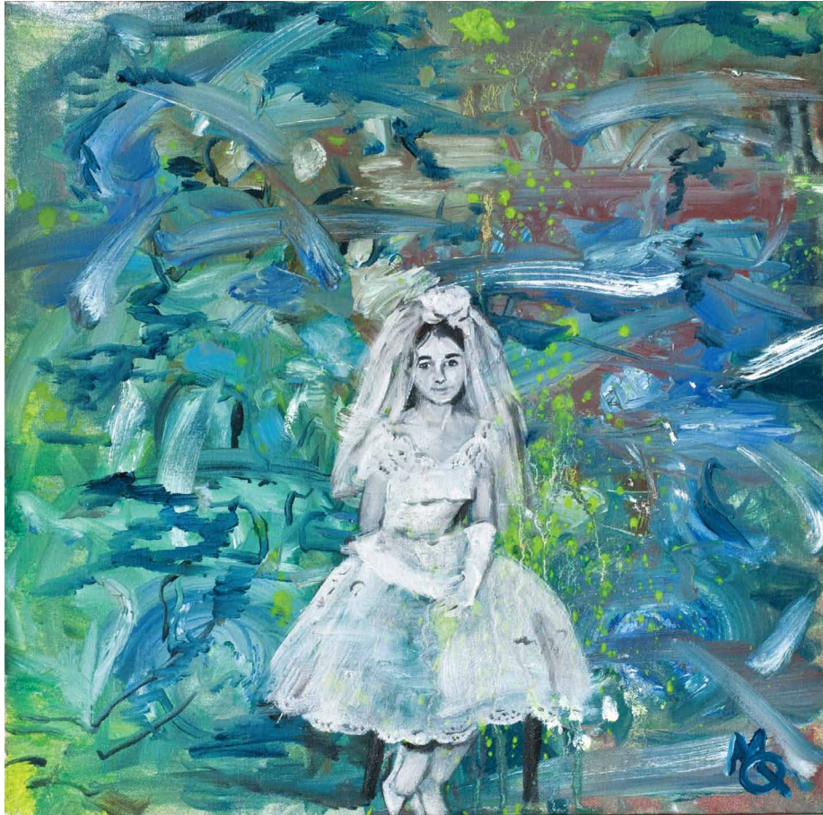
Myriam Quiel / "Bride(1)" / oil on canvas / 30x30 cm / 2012