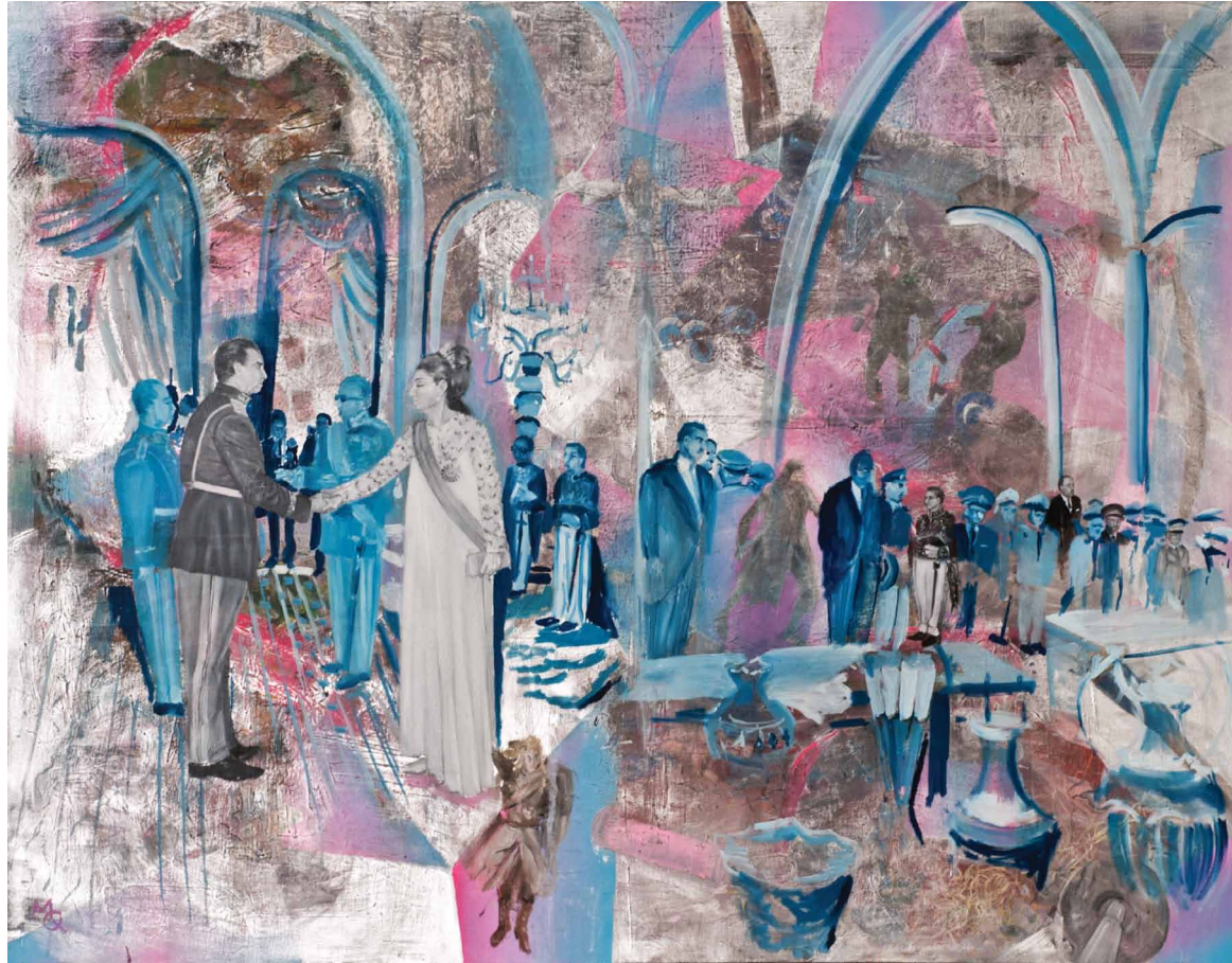
Myriam Quiel / "Neverendingstory(4)" / oil on canvas / 114x146 cm / 2012