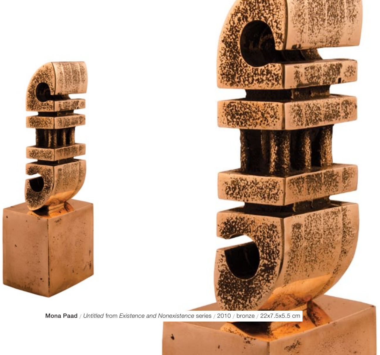
Mona Paad / Untitled from Existence and Nonexistence series / 2010 / bronze / 22x7.5x5.5 cm