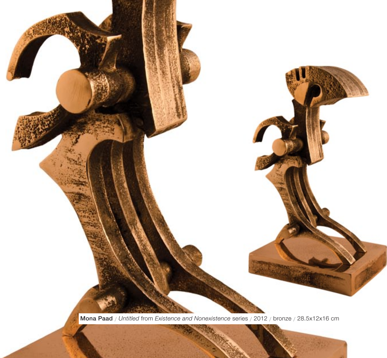
Mona Paad / Untitled from Existence and Nonexistence series / 2012 / bronze / 28.5x12x16 cm