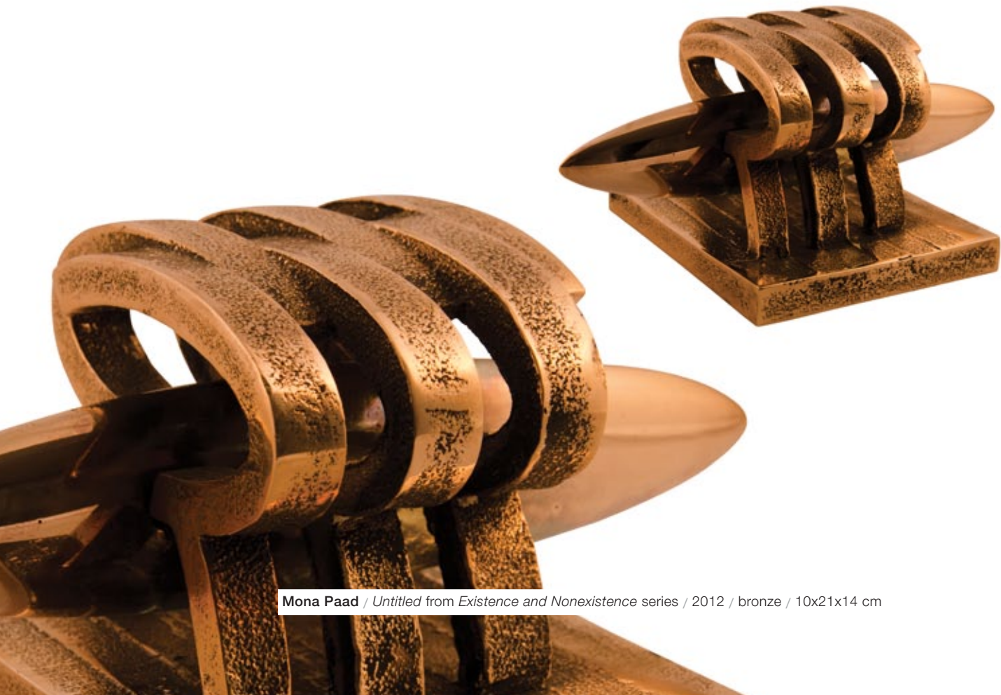
Mona Paad / Untitled from Existence and Nonexistence series / 2012 / bronze / 10x21x14 cm