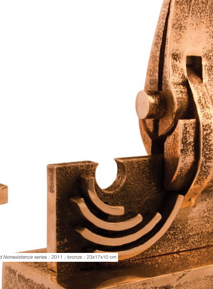
Mona Paad / Untitled from Existence and Nonexistence series / 2011 / bronze / 23x17x10 cm