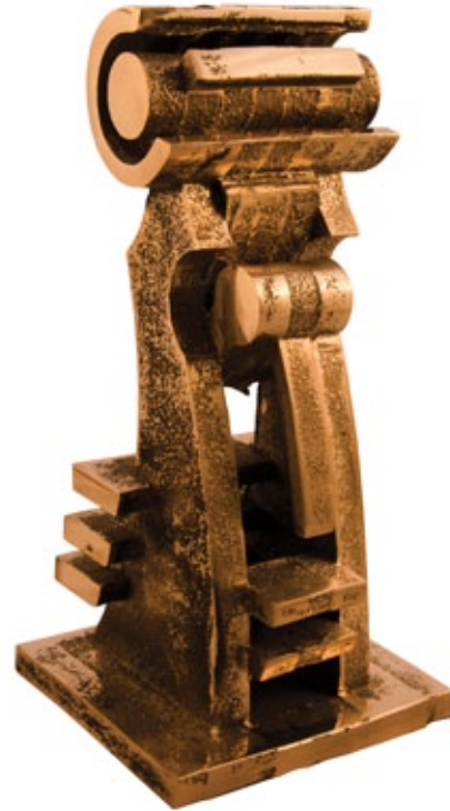
Mona Paad / Untitled from Existence and Nonexistence series / 2011 / bronze / 27x12x13 cm