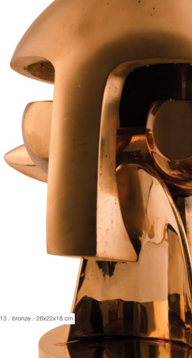
Mona Paad / Untitled from Existence and Nonexistence series / 2013 / bronze / 26x22x18 cm