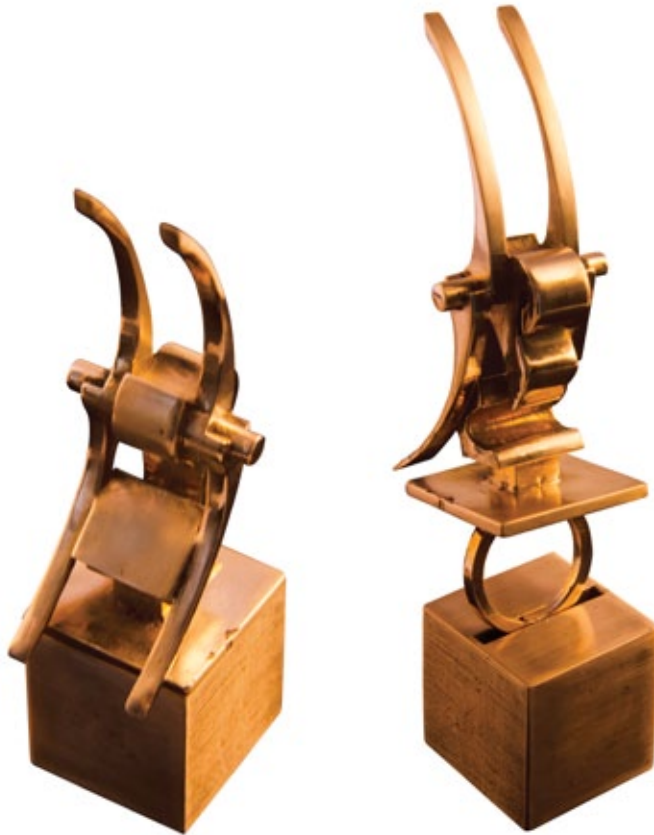
Mona Paad / Untitled from Existence and Nonexistence series / 2012 / bronze / 9x3x2.5 cm