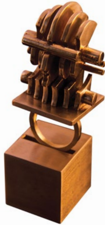
Mona Paad / Untitled from Existence and Nonexistence series / 2012 / bronze / 6.5x3x2.5 cm