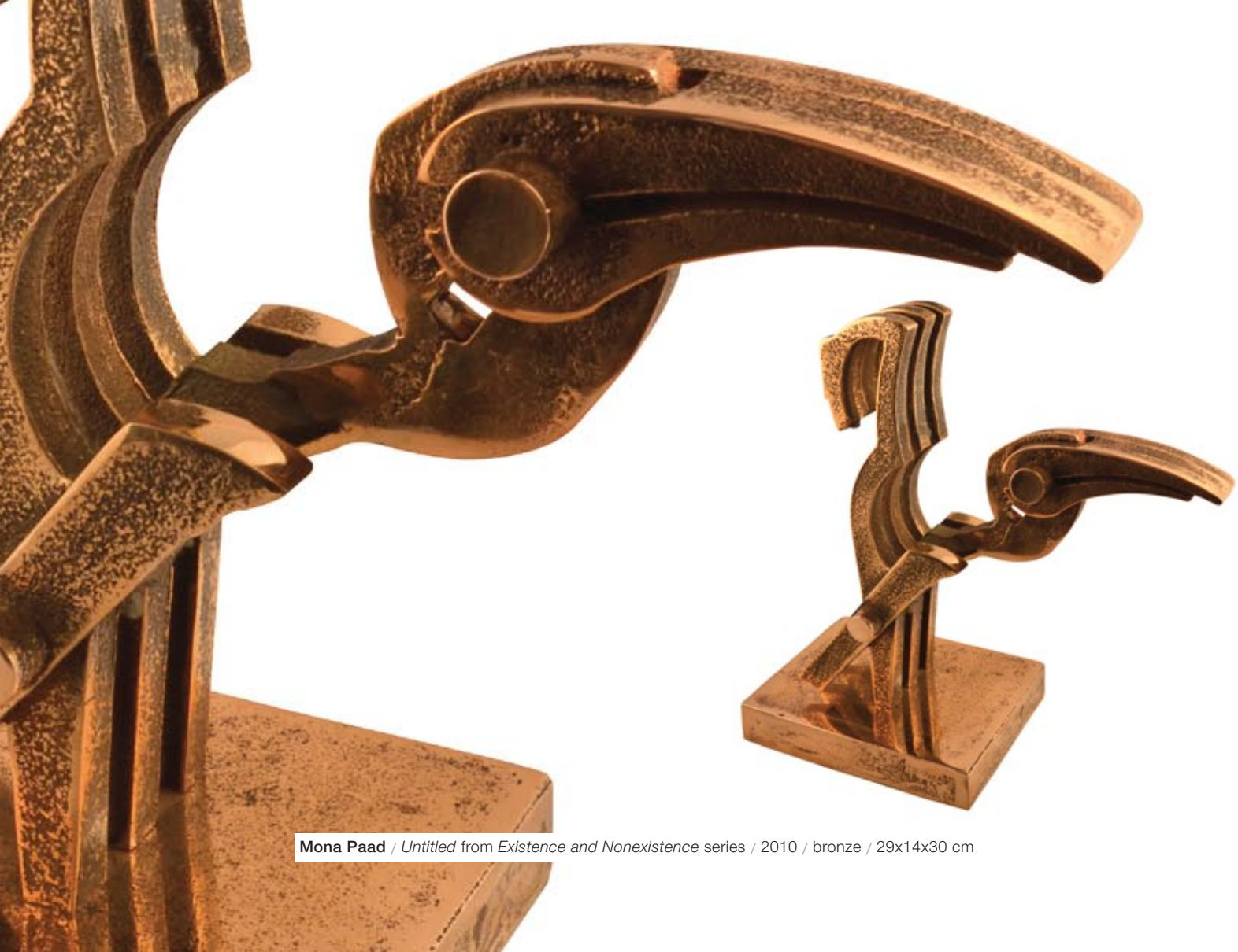
Mona Paad / Untitled from Existence and Nonexistence series / 2010 / bronze / 29x14x30 cm