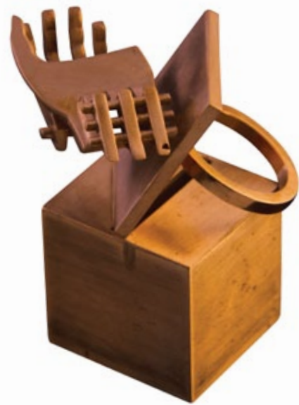
Mona Paad / Untitled from Existence and Nonexistence series / 2012 / bronze / 5.5x3.5x2.7 cm